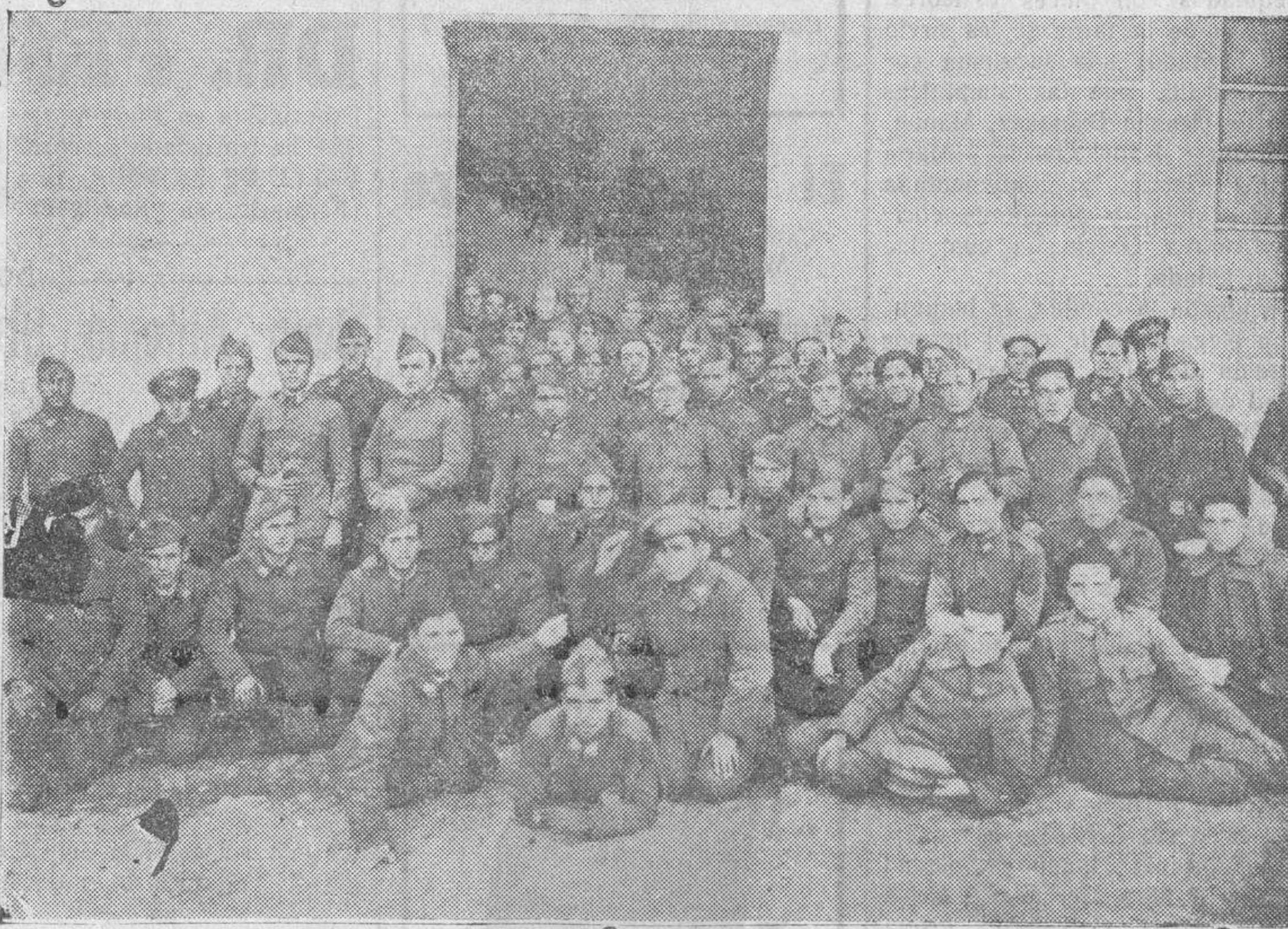
Otro grupo de soldados pertenecientes a la tercera compañía del primer Batallón

En la estación esperaban a las fuerzas el comandante militar de la Plaza, general García Álvarez, con su ayudante; el coronel de Infantería, señor Palenzuela; el teniente coronel, señor Boeza; el te-