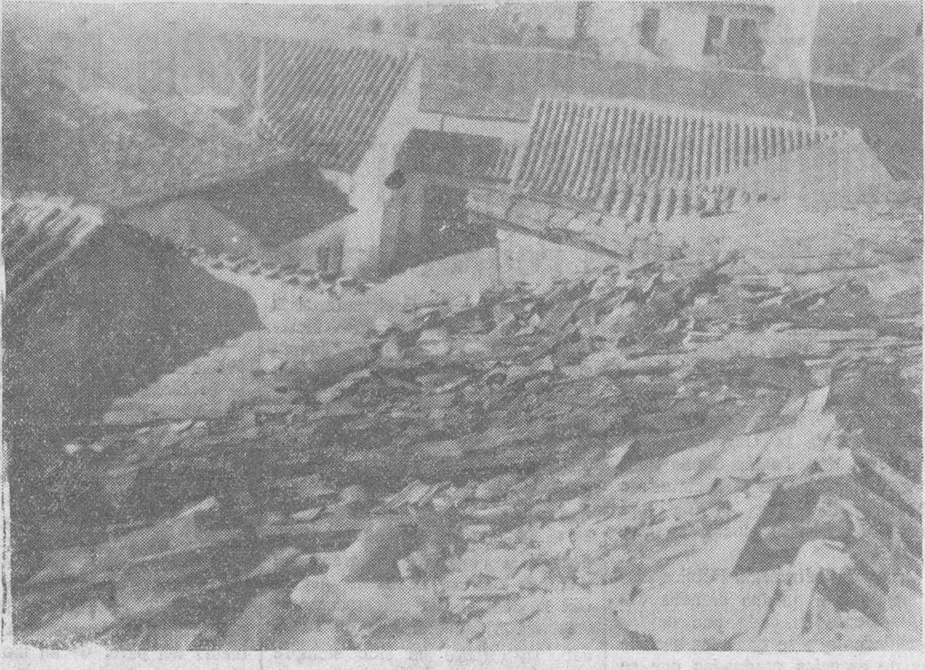
Estado en que quedó la parte del tejado correspondiente a la cocina de la casa número 5 de la calle de San Mateo, donde se originó un incendio, que fue sofocado rápidamente por los bomberos