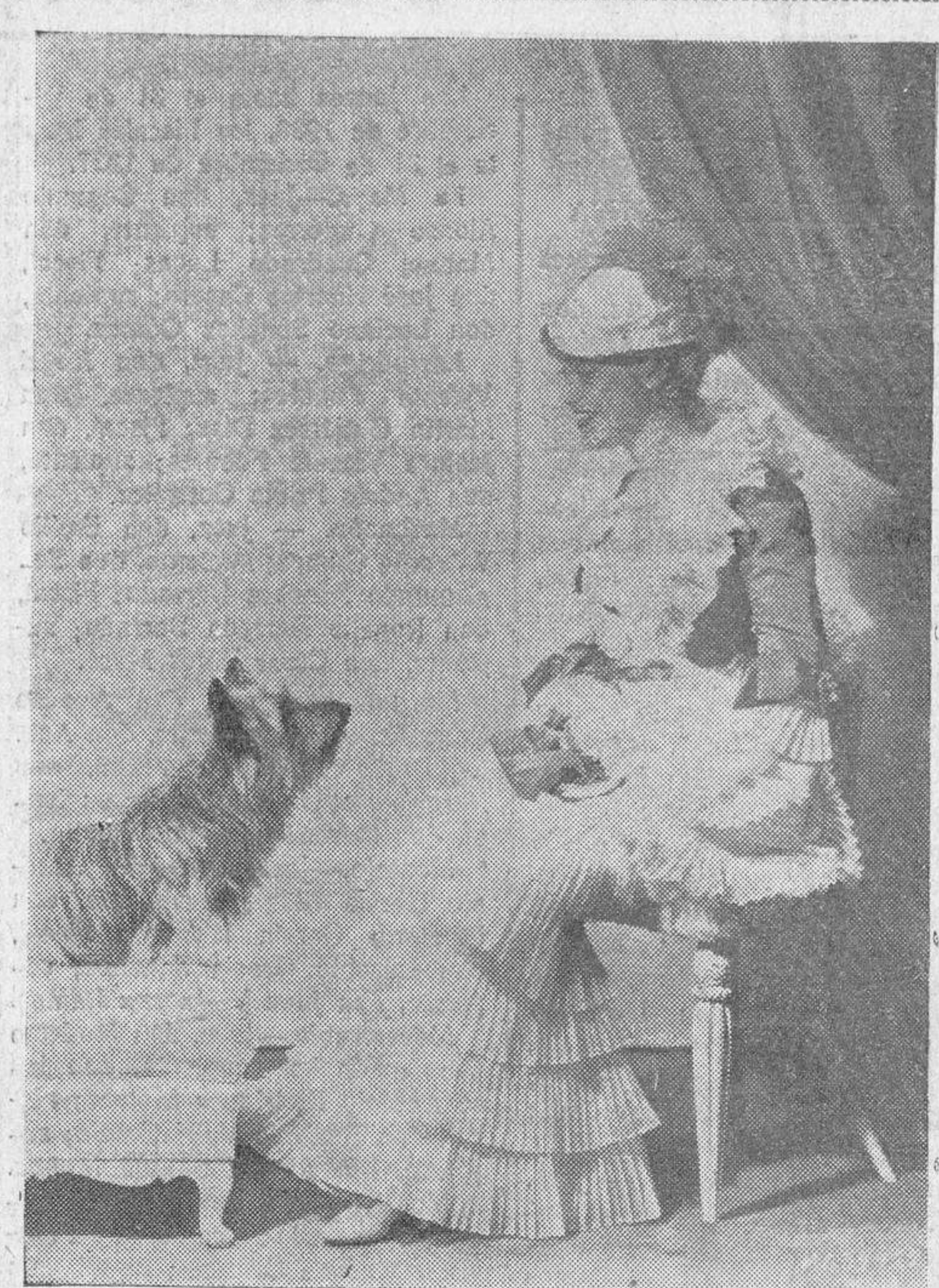
Jeanette MacDonald, con uno de los trajes más vistosos que lucirá en "La viuda alegre", película que filma actualmente la Metro-Goldwyn-Mayer.