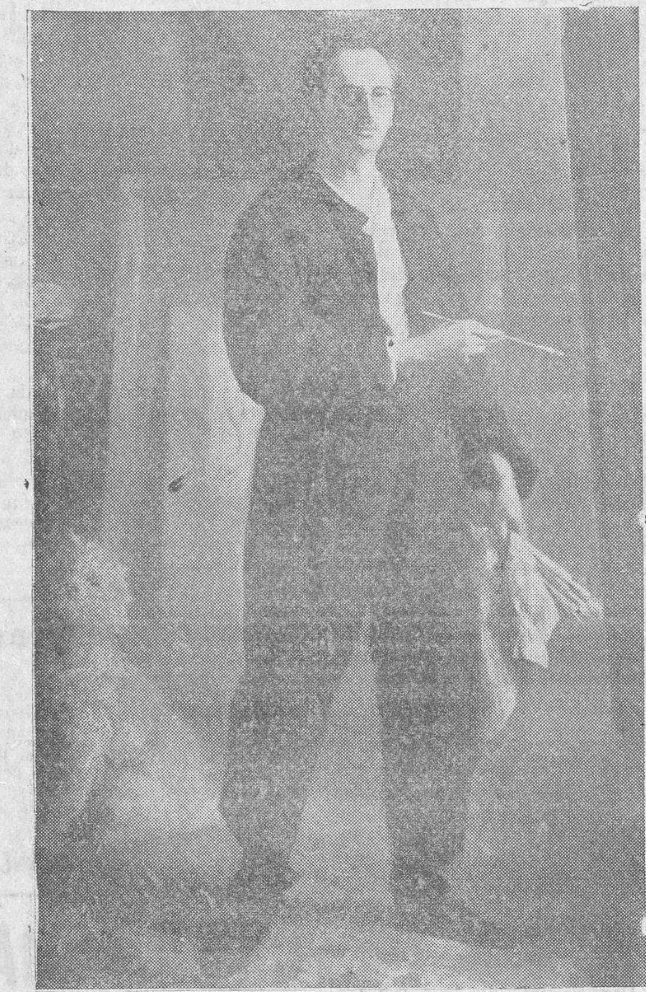
Autorretrato (segunda medalla de la Exposición Nacional)

¿Queréis colocaros? Miles vacantes. Oficiales, vigilantes, carteros, motoristas, vigantes, secretarías, ordenanzas, porteros, peatonos, otros varios. Damos señas de los muchos colocados por nuestra mediación. Con arreglo ley. Centro Informativo, Silva, 30. Madrid. Remitid dos sellos 0,30, para informarnos.