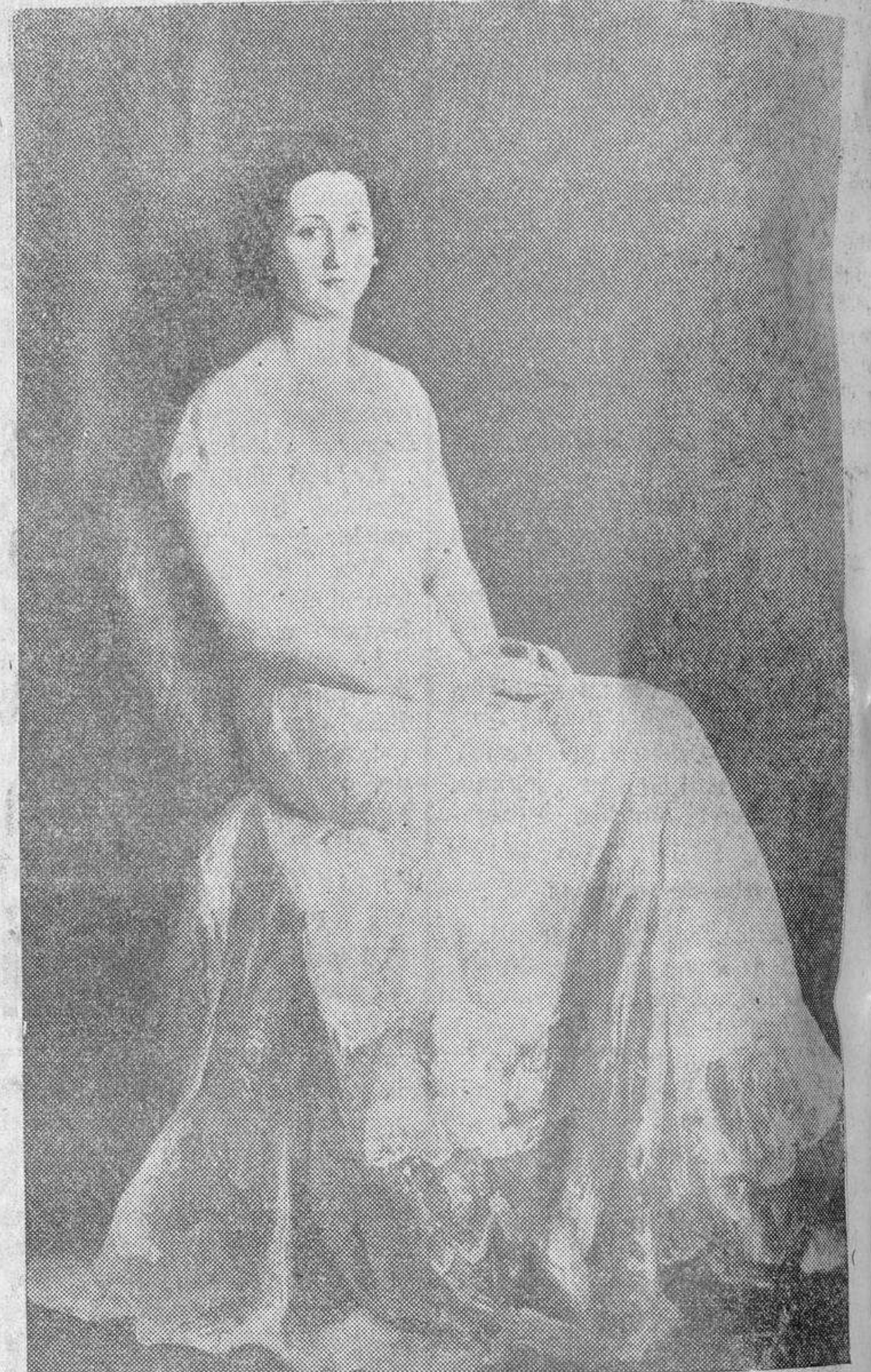
Marquesa de Sales