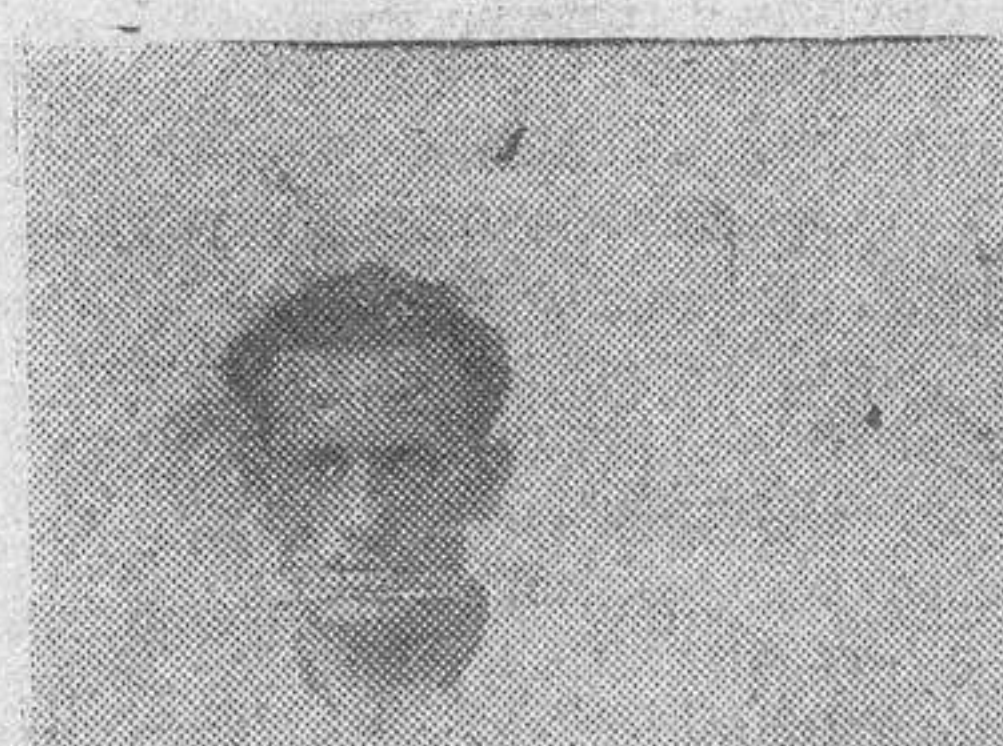
El Gran Premio Ciclista de Bilbao

Insistamos una vez más. El Estado español debe de ocuparse activamente del progreso del deporte. Tomemos el caso de Francia con sus atletas. Y e. de Italia con sus futbolistas. El resultado de estas comparaciones nos demuestra lo fructífero de esa ayuda, que cada vez se hace más necesaria en España. Porque es lo que precisamente necesitan nuestros atletas para triunfar. Campos, pistas, entrenadores, acción libre, para que el actor pueda dar su máximo rendimiento.