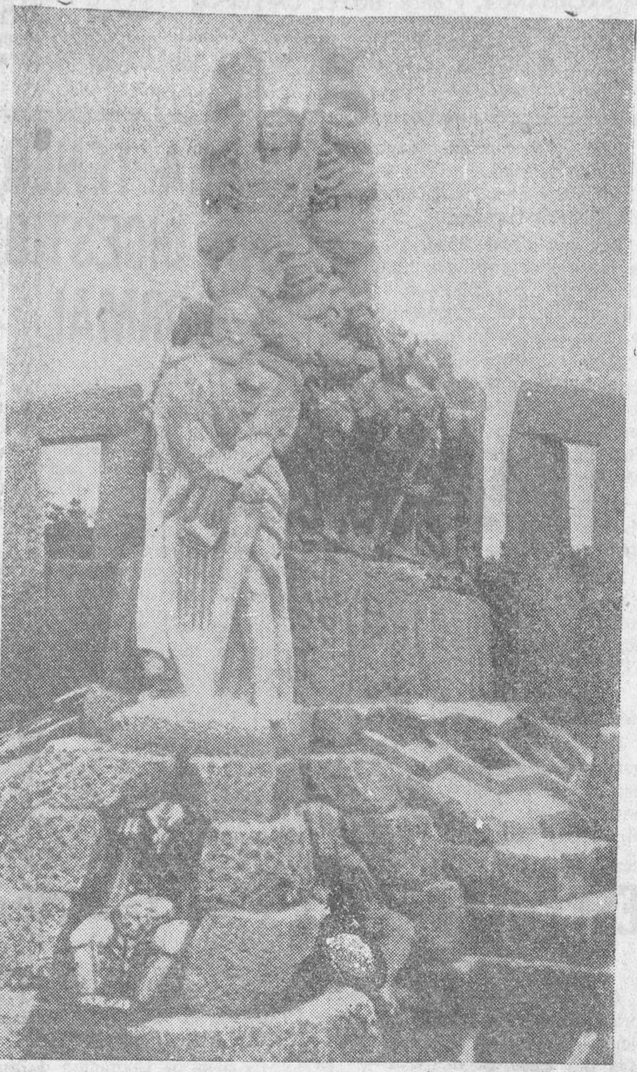
El monumento levantado en Orotuña a la memoria del glorioso poeta gallego Curros Enríquez, que fué inaugurado el pasado sábado por S. E. el Presidente de la República