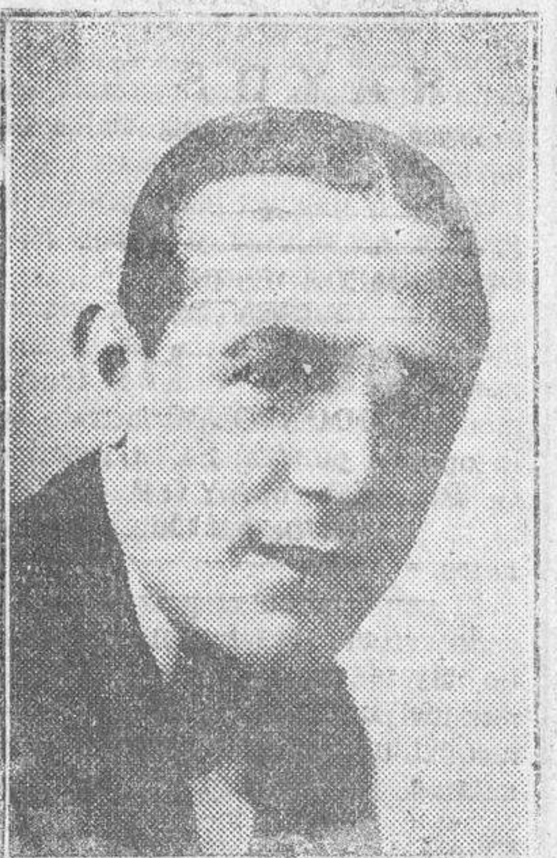
Ignacio Sánchez Mejías, en su época de los máximos triunfos, cuando tomó la alternativa