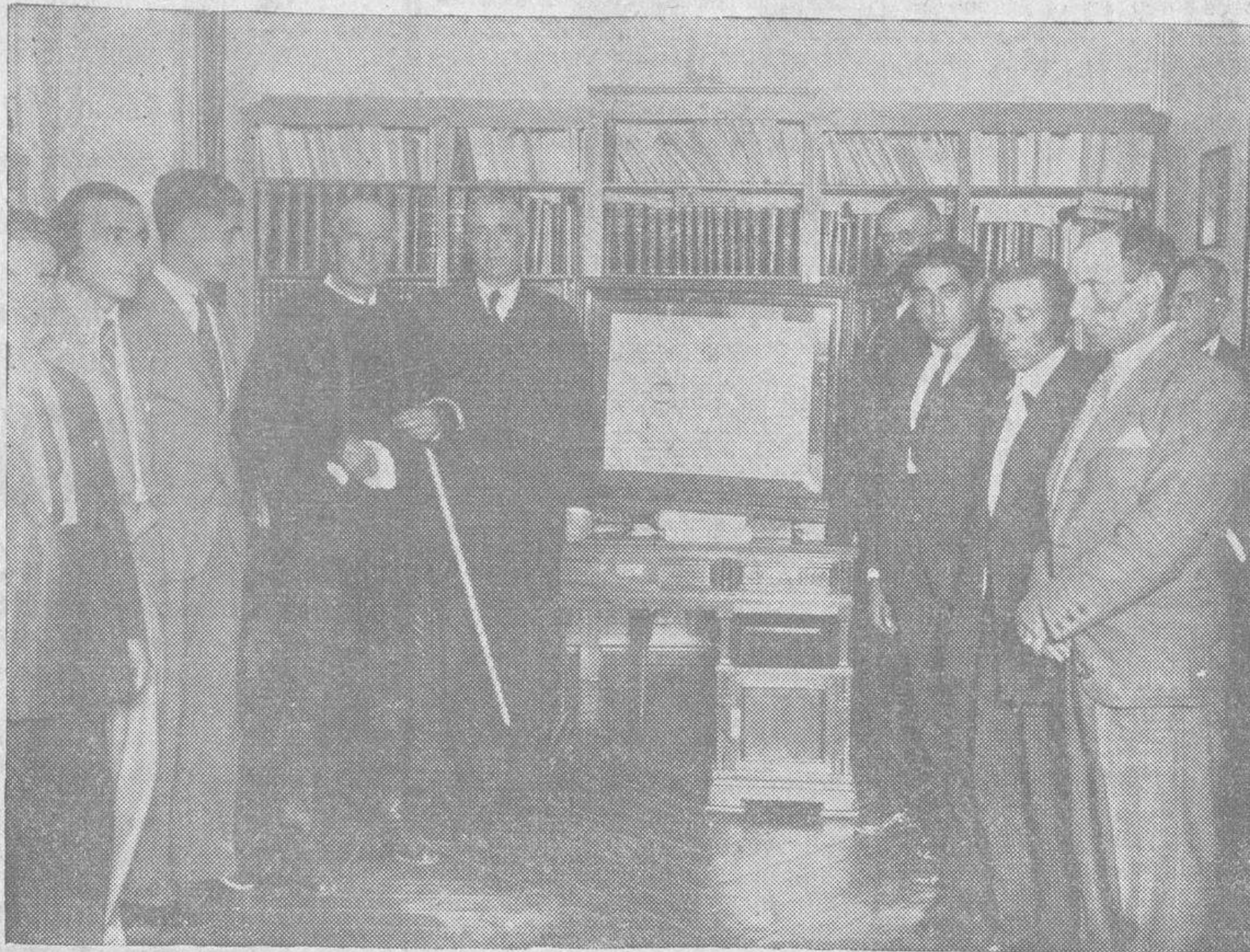
La comisión organizadora del homenaje al Ministro de Instrucción Pública, en Torresmenudas, en el acto de hacerle entrega del pergamino nombrándole Hijo predilecto de aquel pueblo

A las tres y media de la tarde de ayer, momentos antes de regresar a Madrid, el excelentísimo señor ministro de Instrucción Pública, doctor Villalobos, en el domicilio de éste, tuvo lugar un acto cordial y simpático.