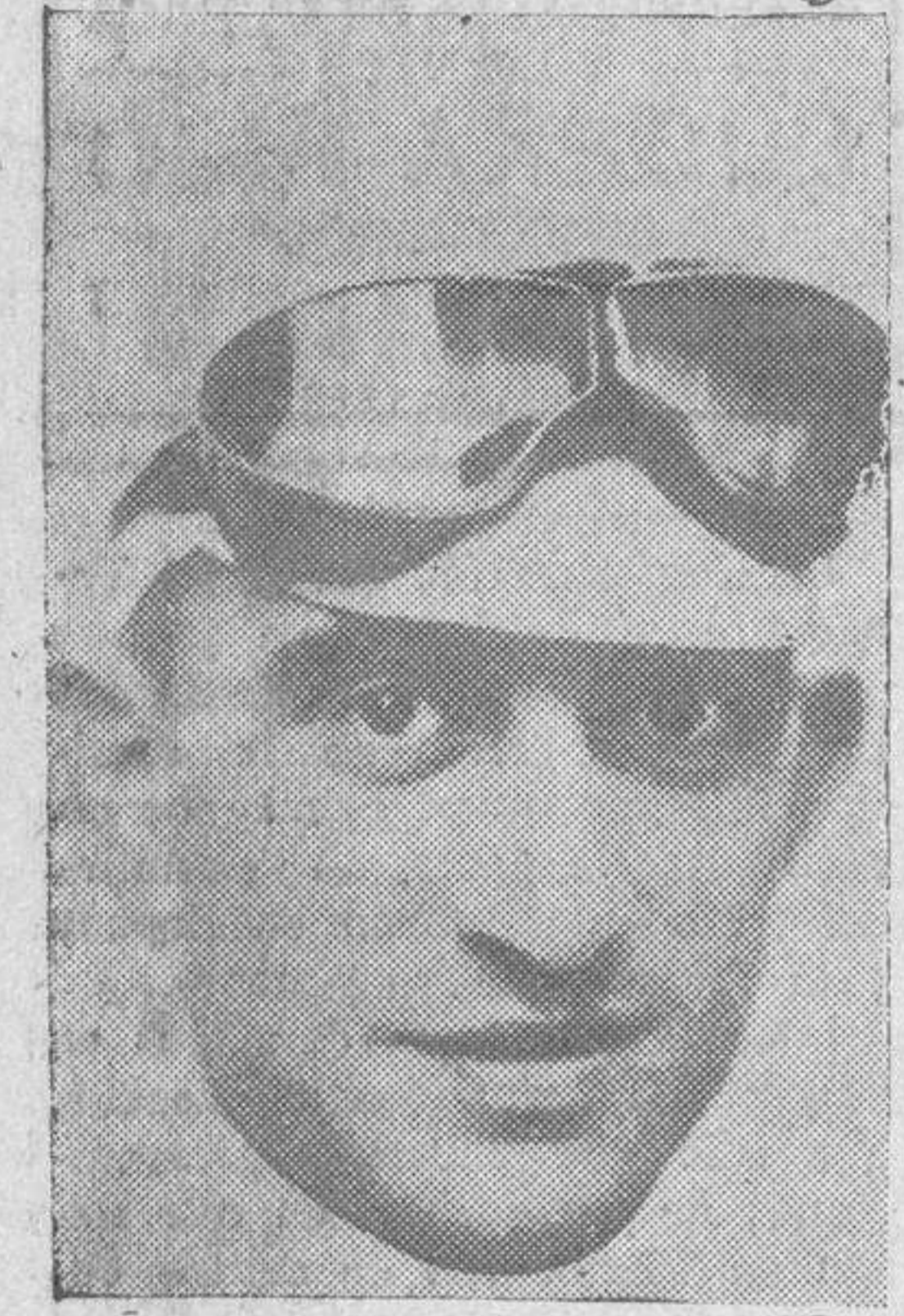
Antonín Magne, vencedor de la vuelta ciclista a Francia, que terminó el domingo

ses han recogido la nota de que la única representación nacional que ha terminado la carrera ha sido la de España, pues Cañardó, Montero, Ezquerro y Trueba tomaron la salida de Paris, y a Paris llegaron.