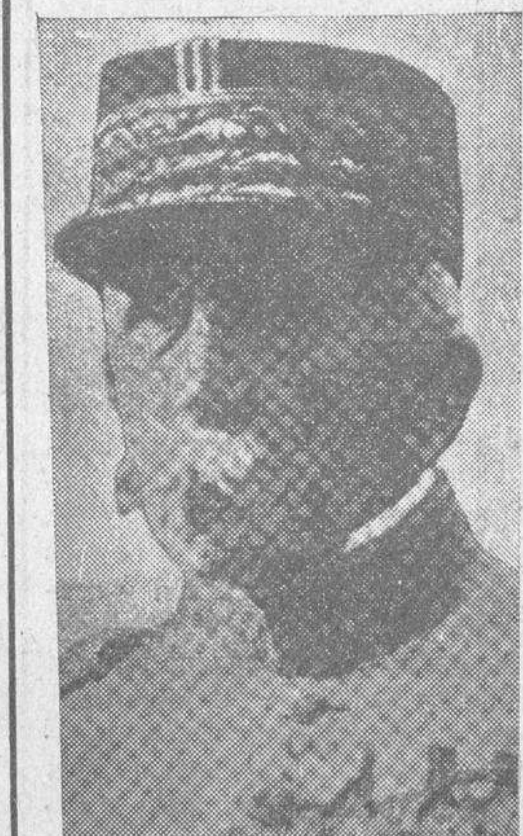
El Mariscal Lyantey, que se halla enfermo de gravedad

En todas sus partes, las últimas disposiciones del ministerio de la Gobernación, que prohíbe inflexiblemente, bajo severas sanciones, desfiles militarizados con insignias, uniformes o banderas de fuerzas políticas.