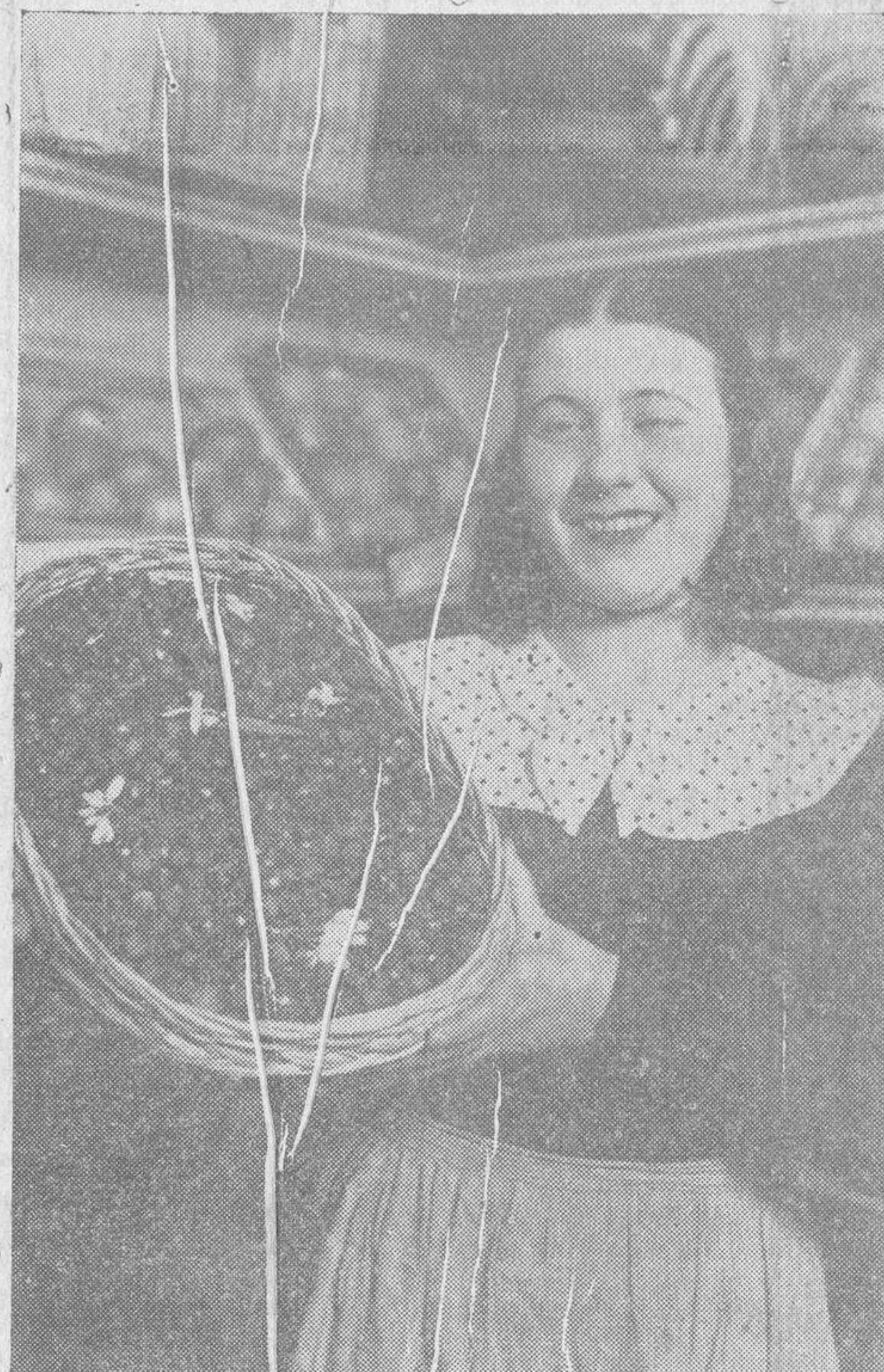
Las primeras Fresas de Aranjuez.