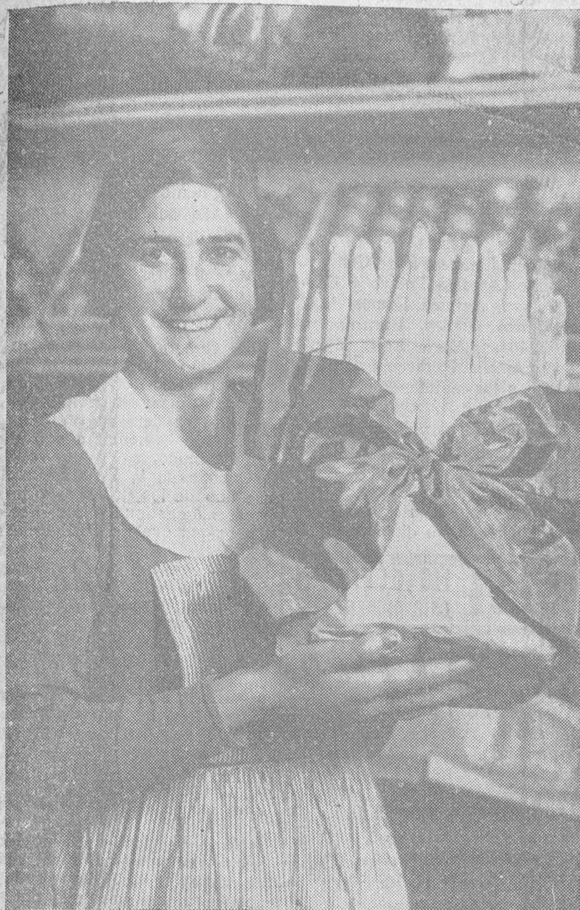
Los primeros espárragos de Aranjuez.