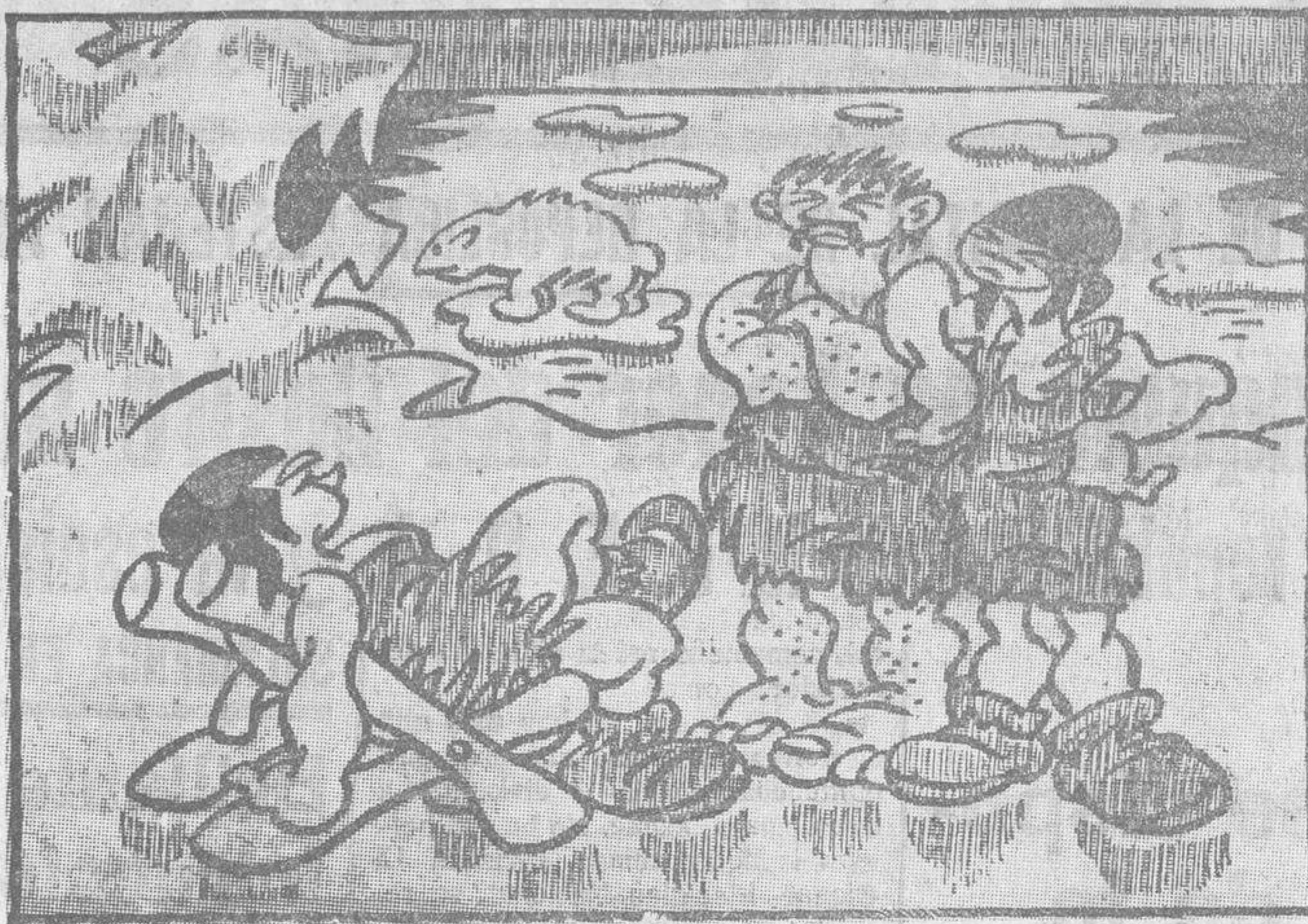
—Este año, amigos míos, no vamos a acabar de broncearnos... ¡Este sol de media noche amanece tan tarde!...