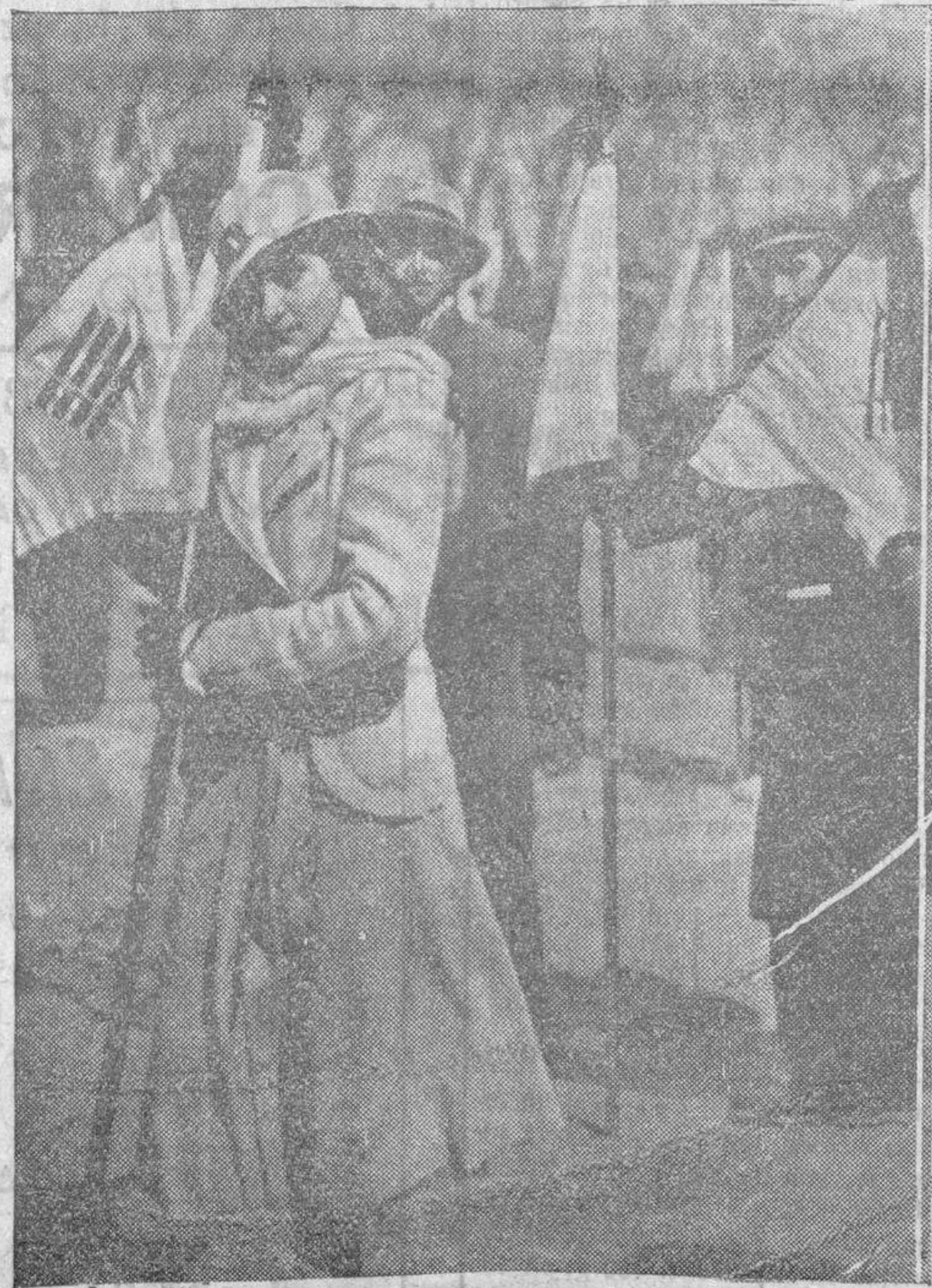
La señorita que en representación de Segorbe asistió a la clausura del Congreso de la Juventud de Acción Popular, llevando el banderín correspondiente a su grupo