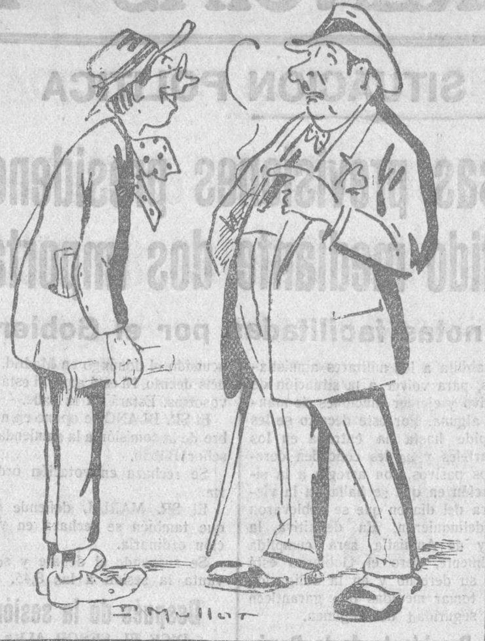
—La cuestión es que, siendo usted sordo, no sé qué cargo pudiera desempeñar. —En reclamaciones, ¿no le parece?..