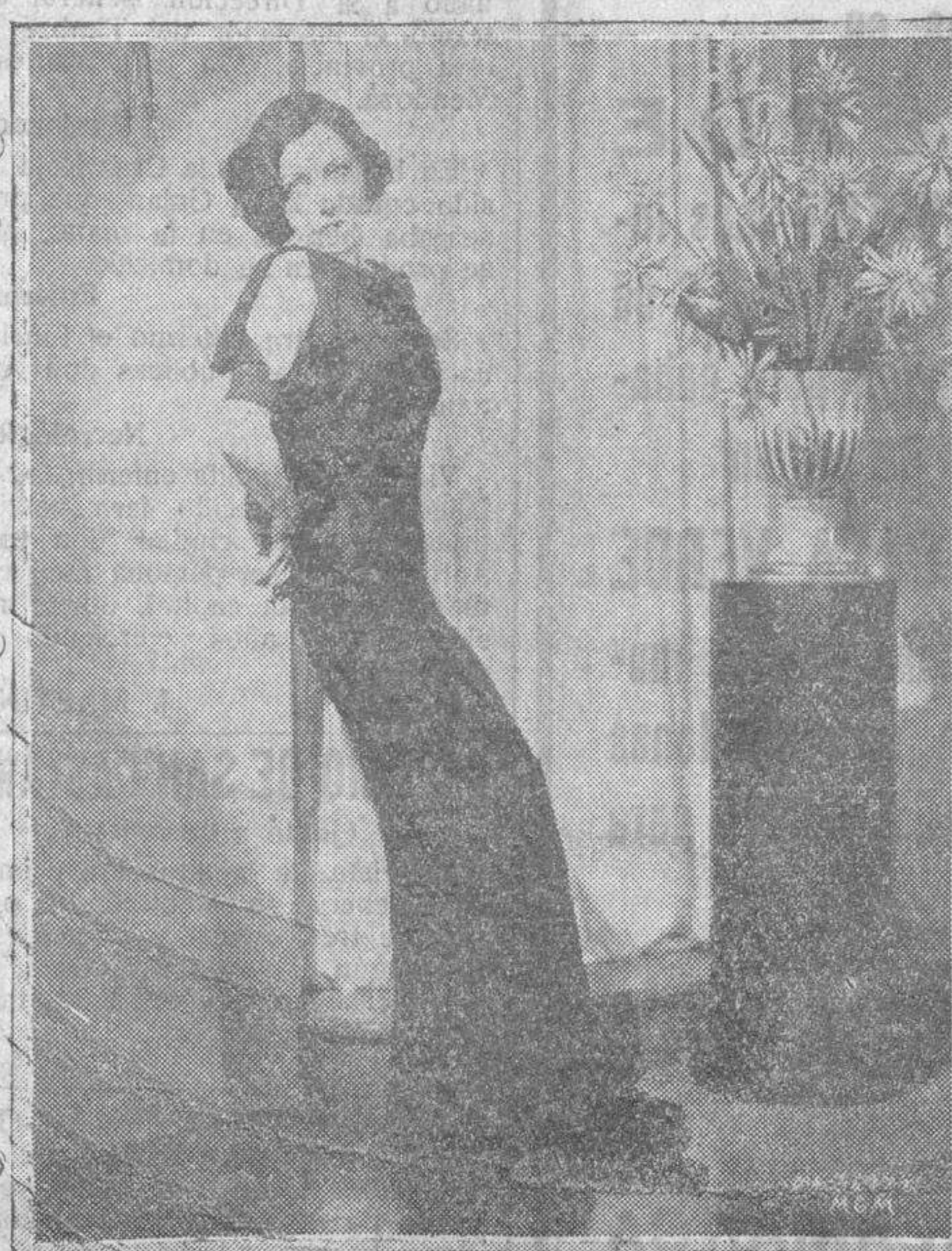
Gloria Swanson, famosa estrella de la Metro-Goldwyn-Mayer, luciendo un primoroso traje de noche

Las conferencias telefónicas diarias de EL ADELANTO con Madrid, tienen, según contrato de trabajo con la Compañía Nacional Telefónica, un mínimo de duración de UNA HORA, prorrogable.