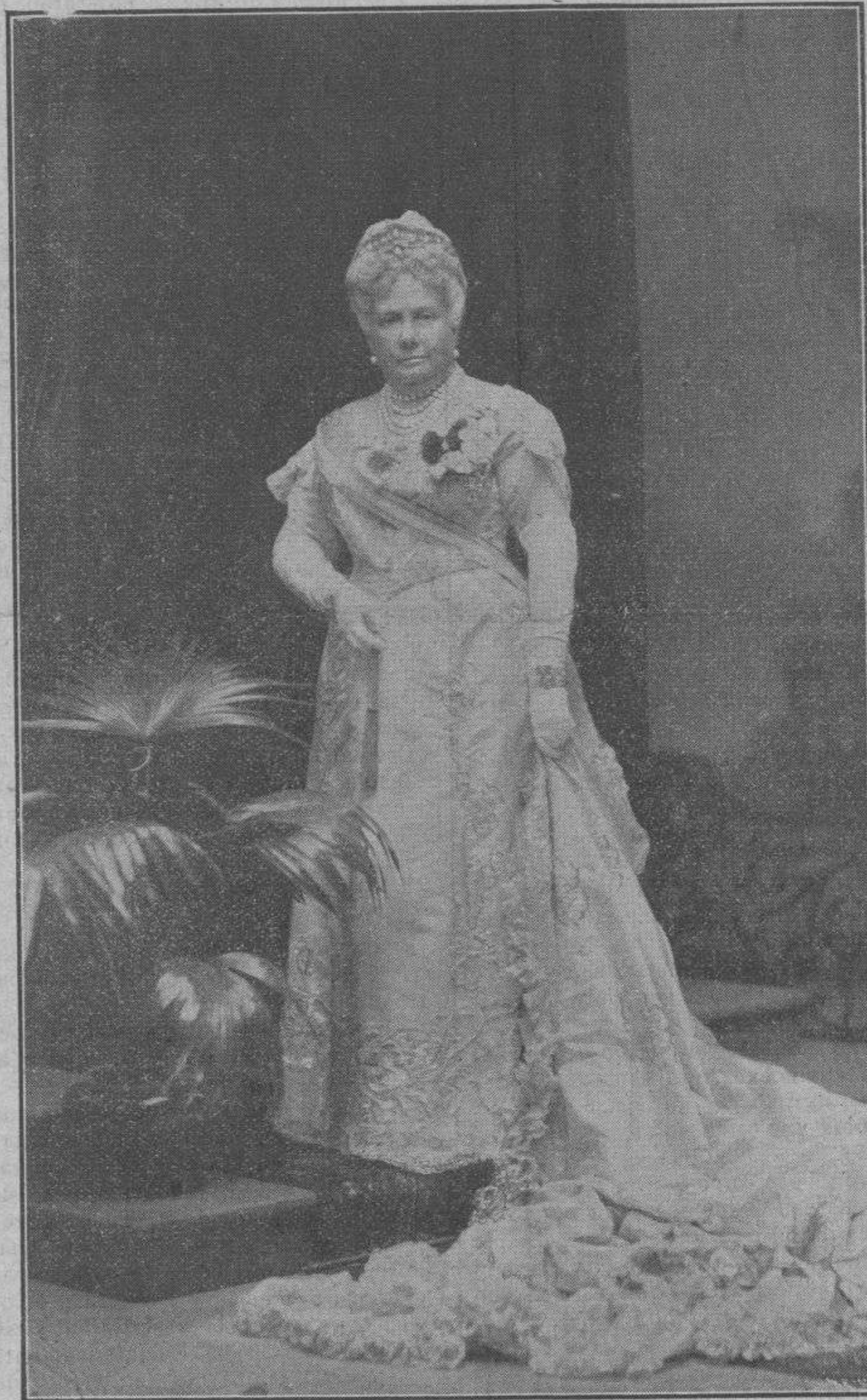
S. A. R. LA INFANTA ISABEL