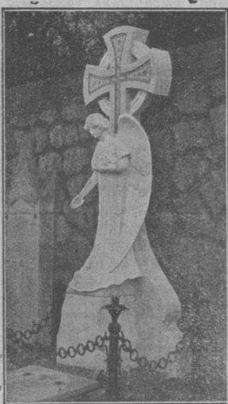
Tumba propiedad de D. Juan Canals en el Cementerio de Sóller

Succursale a REMOULINS. — Téléphone n.º 7.