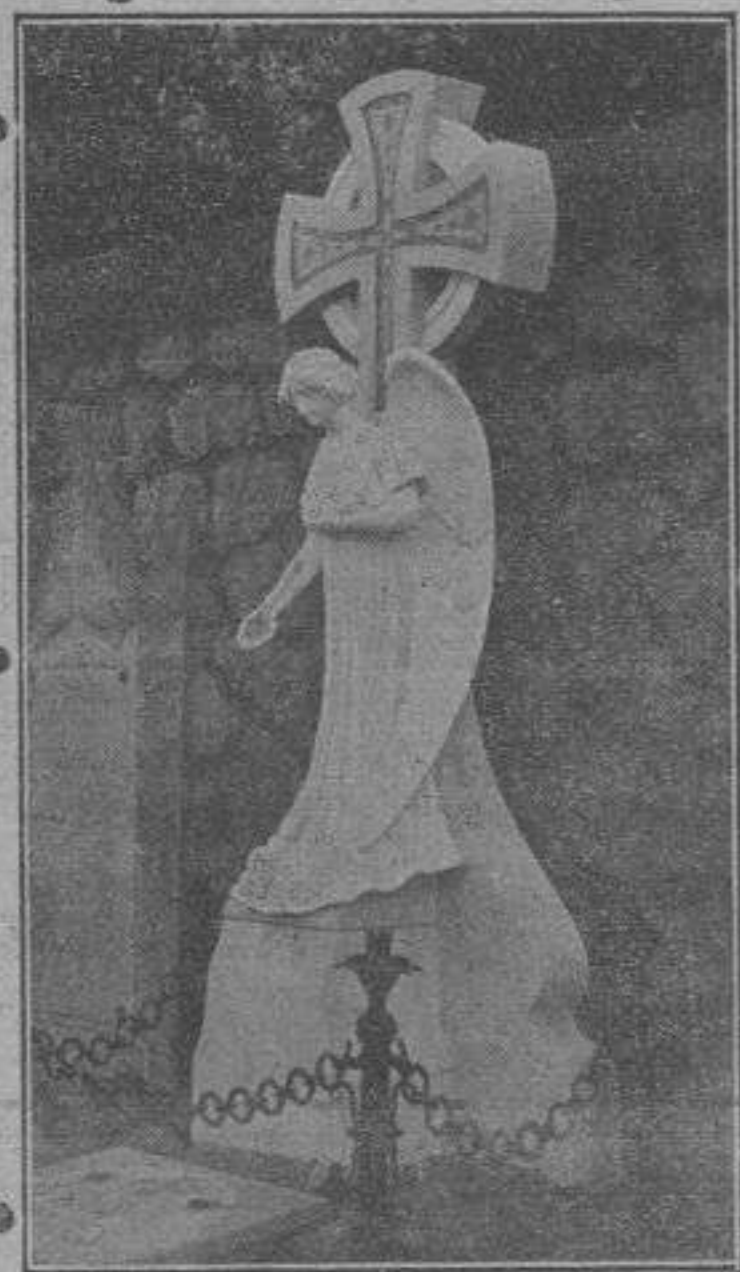
Tumba propiedad de D. Juan Canals en el Cementerio de Sóller

Succursale a REMOULINS. — Téléphone n.º 7.