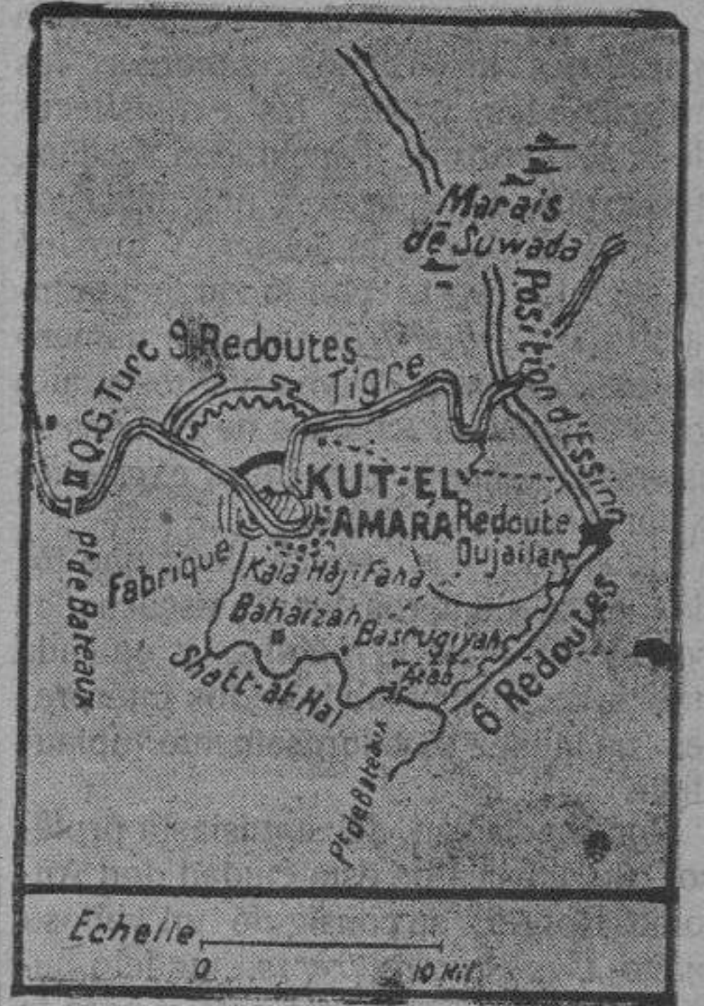
Plano de la región de Kut-el-Amara