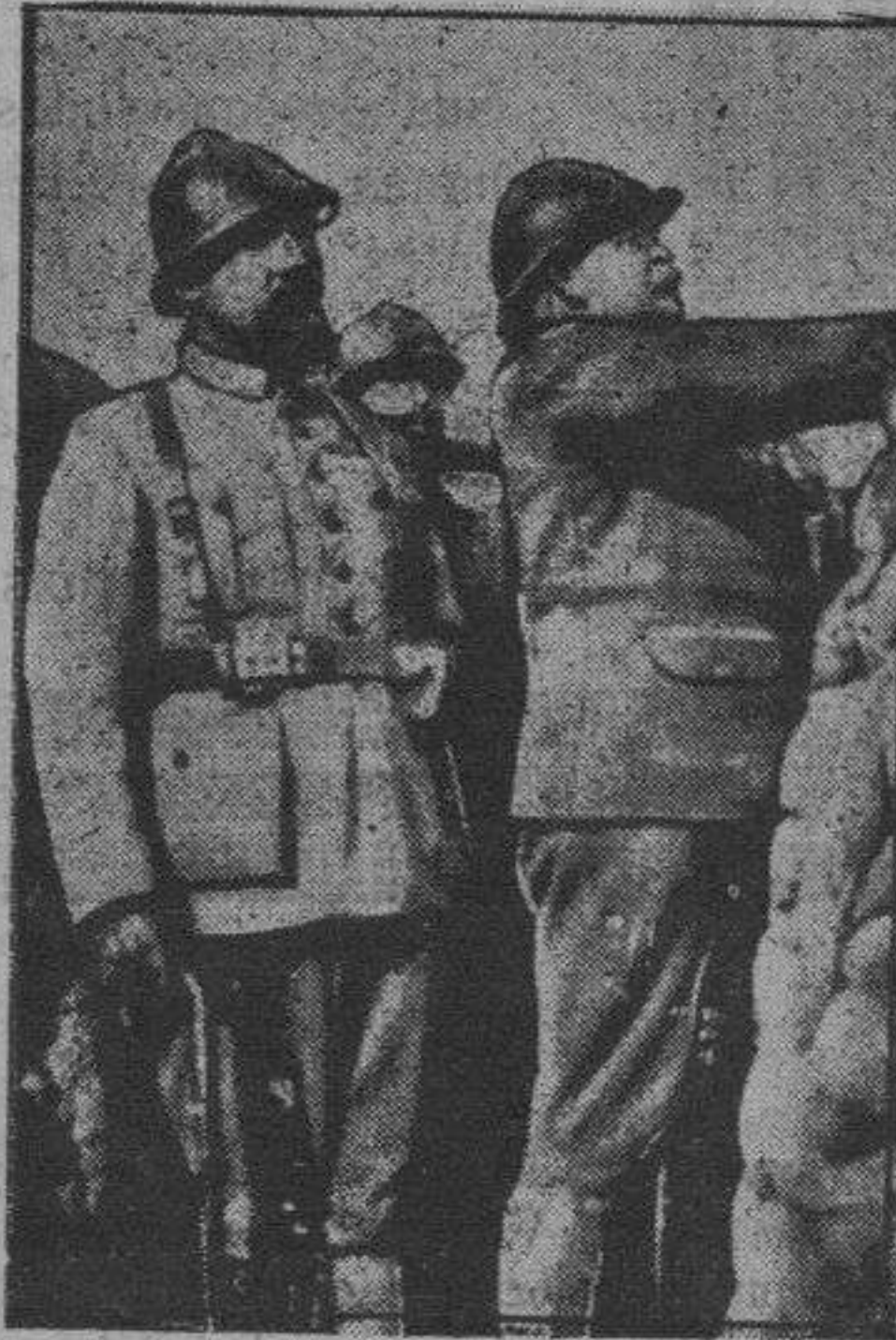
El general Porro