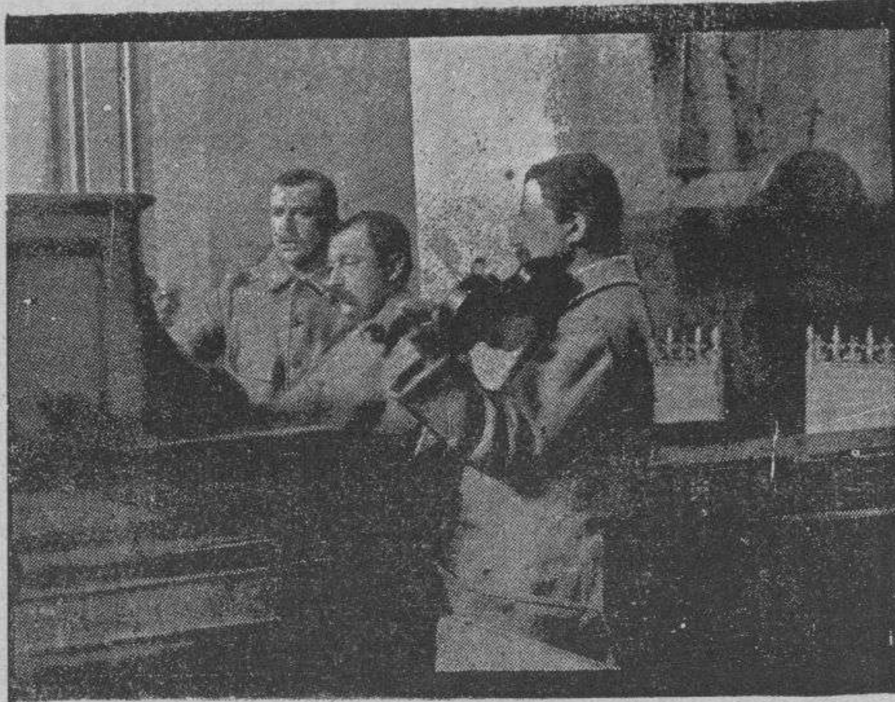
En el armonium de una iglesia de pueblo

era en Valdepinos algo más que querido, veneradísimo. Católico á macha martillo y fiel cumplidor de todas las prácticas religiosas sin ñoñerías, sin beatería, en hombre siempre, las mujerucas y los viejos, los mozos y las mozas, el alcalde y el señor cura, el boticario y el teniente de la Guardia civil, el pueblo entero, en una palabra, decían lo mismo: