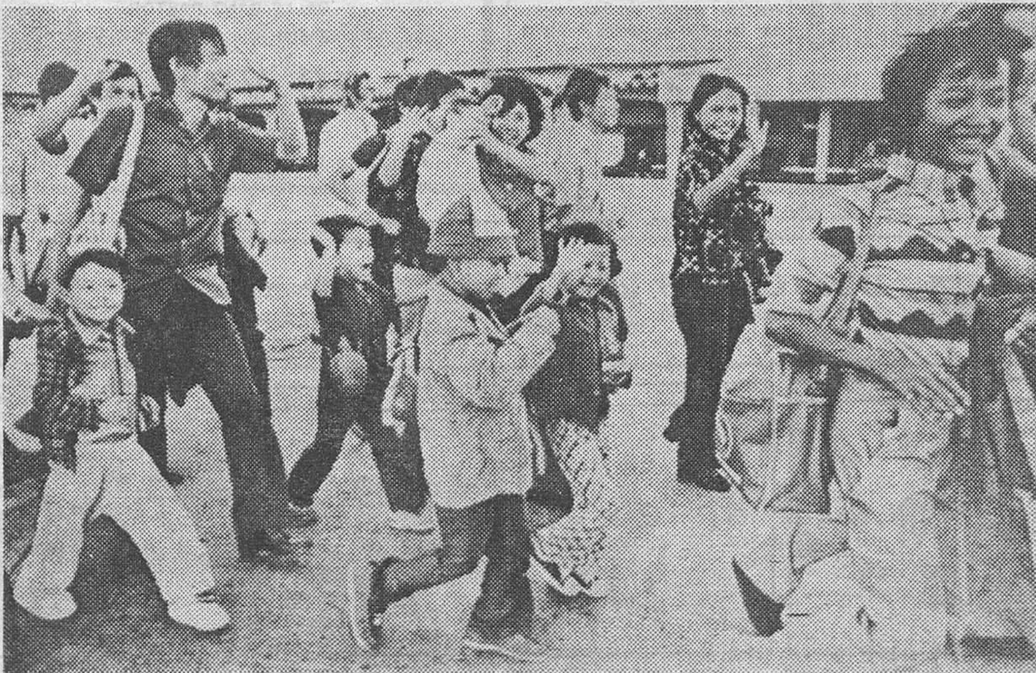
Manila. — Un grupo de 102 refugiados vietnamitas se despiden en el aeropuerto de la capital filipina, poco antes de que tomaran un avión con destino a Israel, en donde se establecerán.