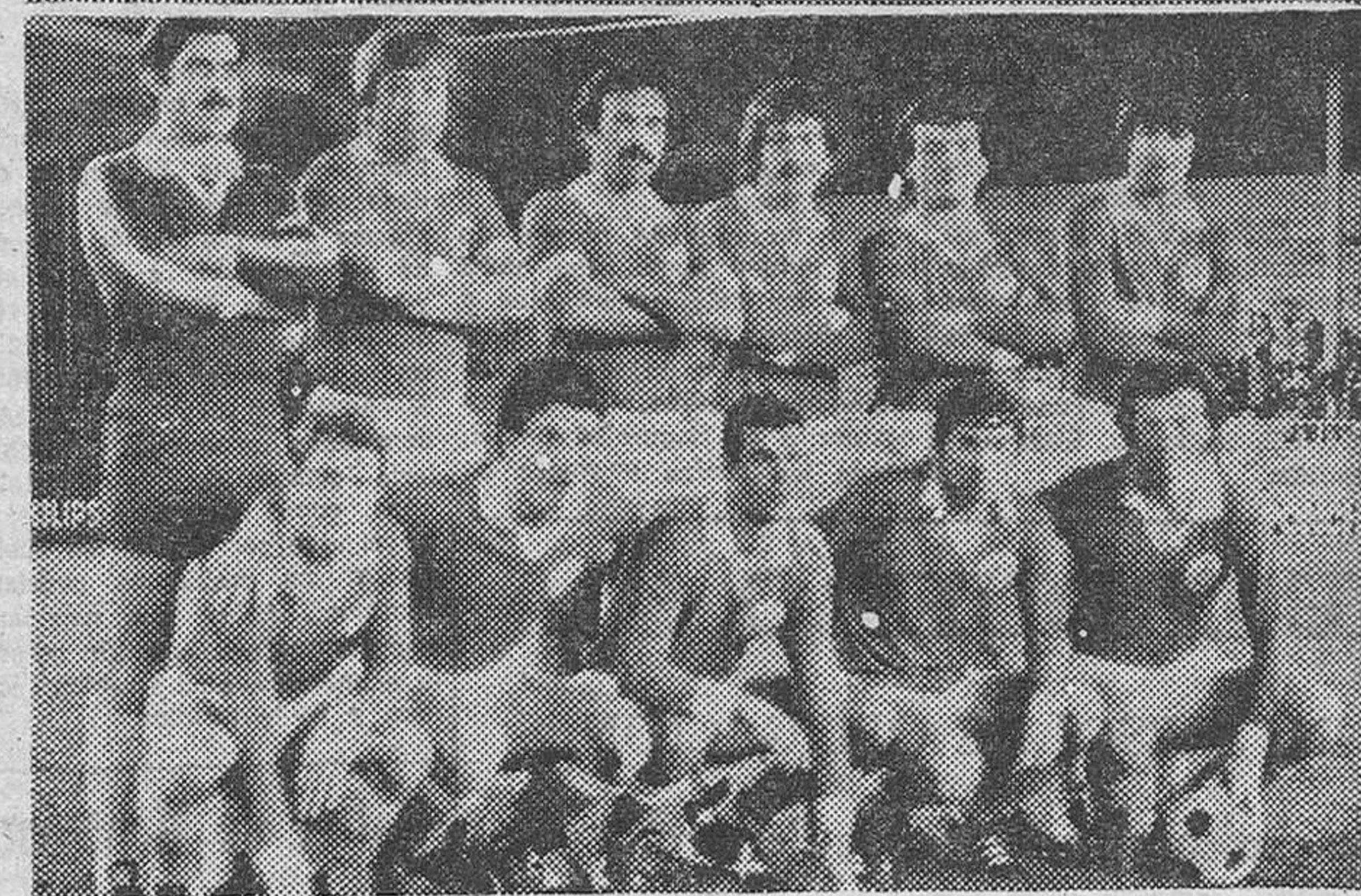
Los equipos del Burgos y del Gimnástico de Tarragona, que anoche se enfrentaron en «El Plantío», en partido de Copa.

lanzó un centro medido que dejó a López, completamente solo y ante la misma boca de gol; pero el remate de cabeza del «pibe» se fue incomprensiblemente fuera.