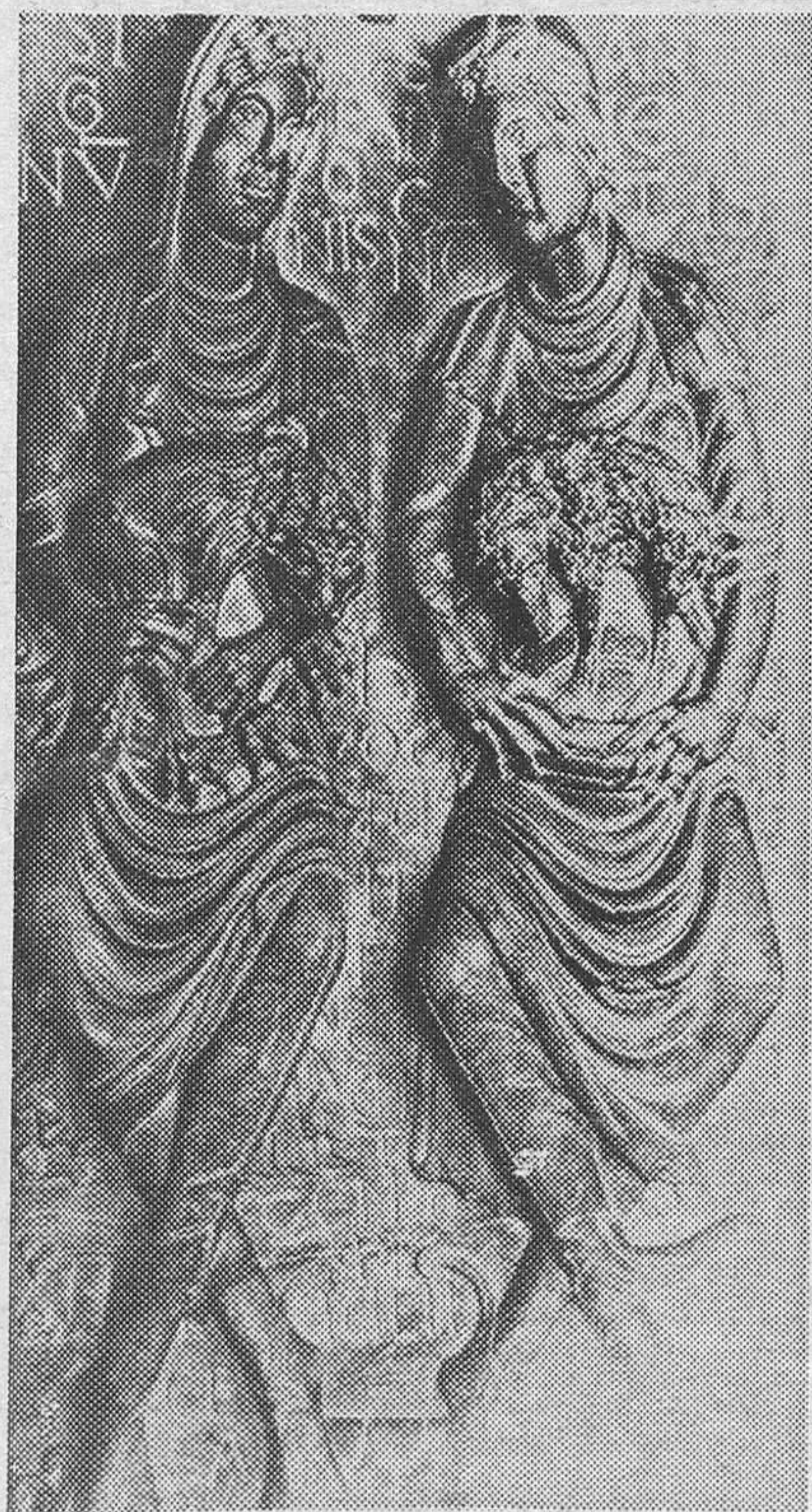
Dos curiosas representaciones románicas de los signos de Leo y Aries.

E L camino entre el mensaje bíblico de Marc Chagall y el mensaje conmovedor de los escultores románicos de Tolosa es, en verdad, largo. Sin embargo, los apóstoles de piedra del célebre y no obstante misterioso escultor Gilbertus surgidos de la gran tradición del arte bizantino no parecen desplazados a pocos metros de los santuosos ángeles de Chagall, que también se inspiró en Oriente. Nada, por otra parte, más de acuerdo con la voluntad de los donantes de Museo Marc y Valentine Chagall, que deseaban hacer de él un lugar de exposición de todas las actividades espirituales de la humanidad, de todos los tiempos y de todos los países.