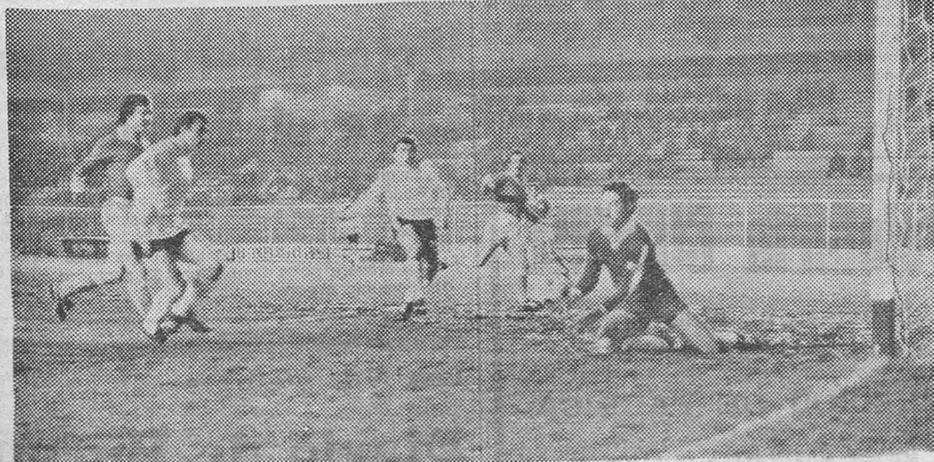
Uno de los infructuosos ataques del Burgos, realizados contra la meta tarraconense, en el curso del primer tiempo, finalizado sin que el marcador llegara a funcionar. —.