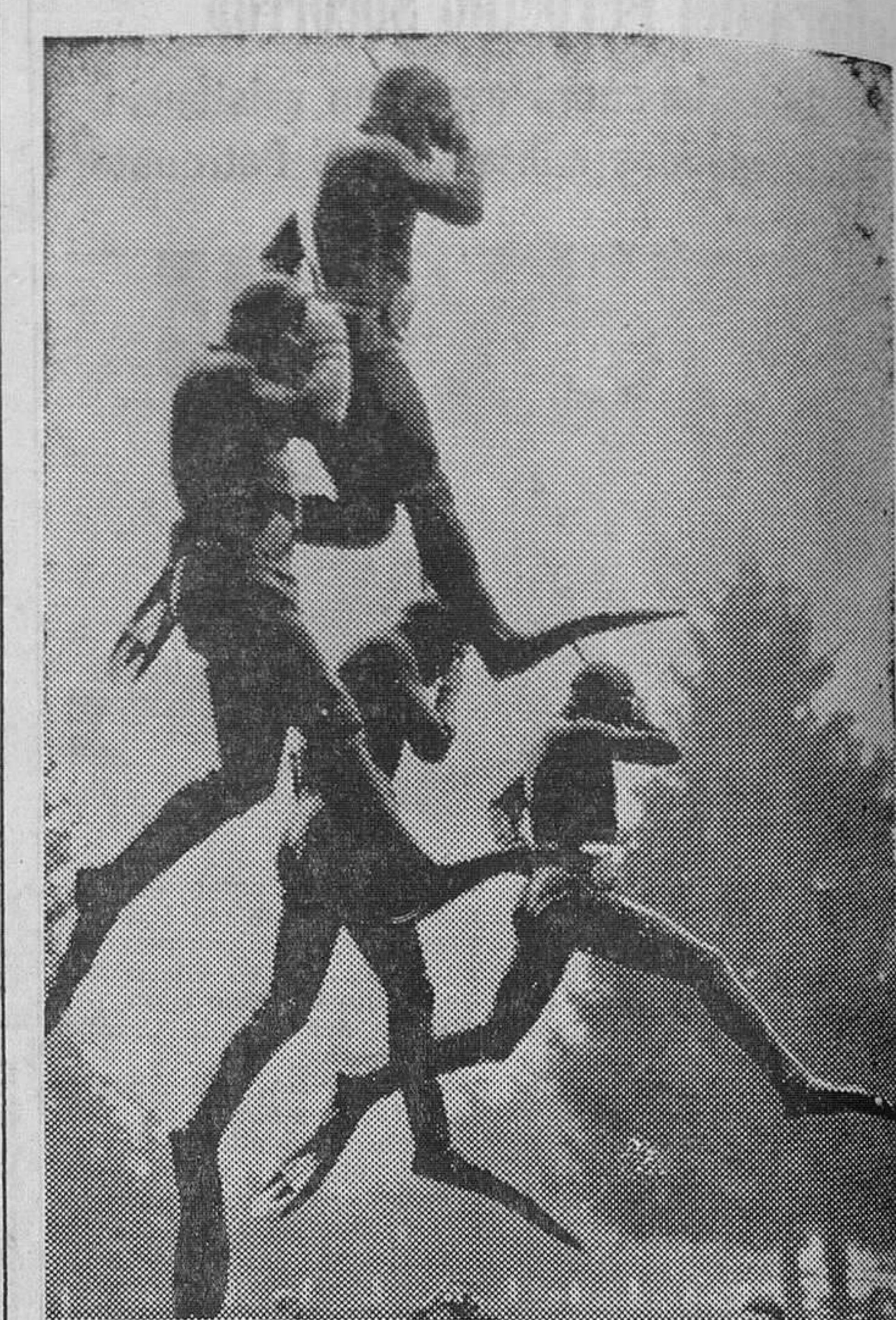
El Ejército suizo cuenta desde ahora con un nuevo tipo de especialistas: los hombres rana, que reciben instrucción en la Escuela de Reclutas de Ingenieros 235. Las prácticas las realiza en el lago Brougg y los periodistas han tenido ocasión ahora de presenciar una de sus demostraciones. En esta fotografía vemos cómo los componentes de un grupo de combate son arrojados al lugar de operaciones desde un helicóptero.