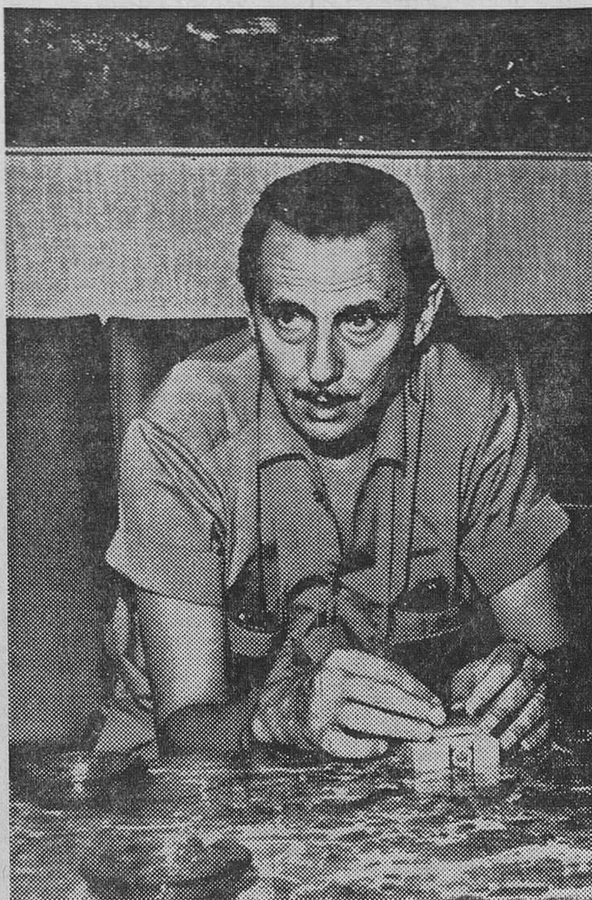
Buero Vallejo encabeza la lista de los autores teatrales españoles de hoy.

En Enero estrenará «El sueño de la razón» basada en los últimos meses de Goya en Madrid T. V. E. no le ha propuesto nunca nada, y si se lo ofrecieran «lo pensaría antes de aceptar»