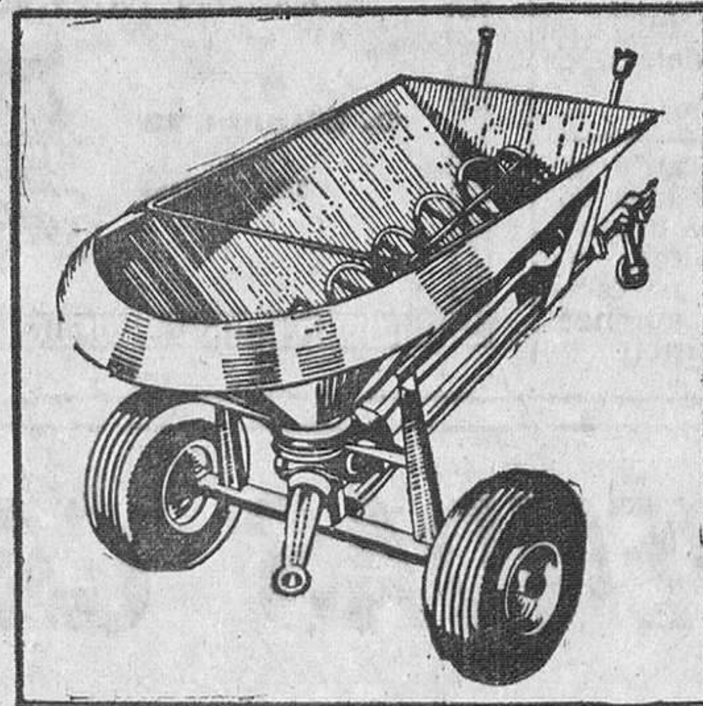
Abonadora Pentón de 2.000 Kg. de capacidad

Homologada por el Ministerio de Agricultura