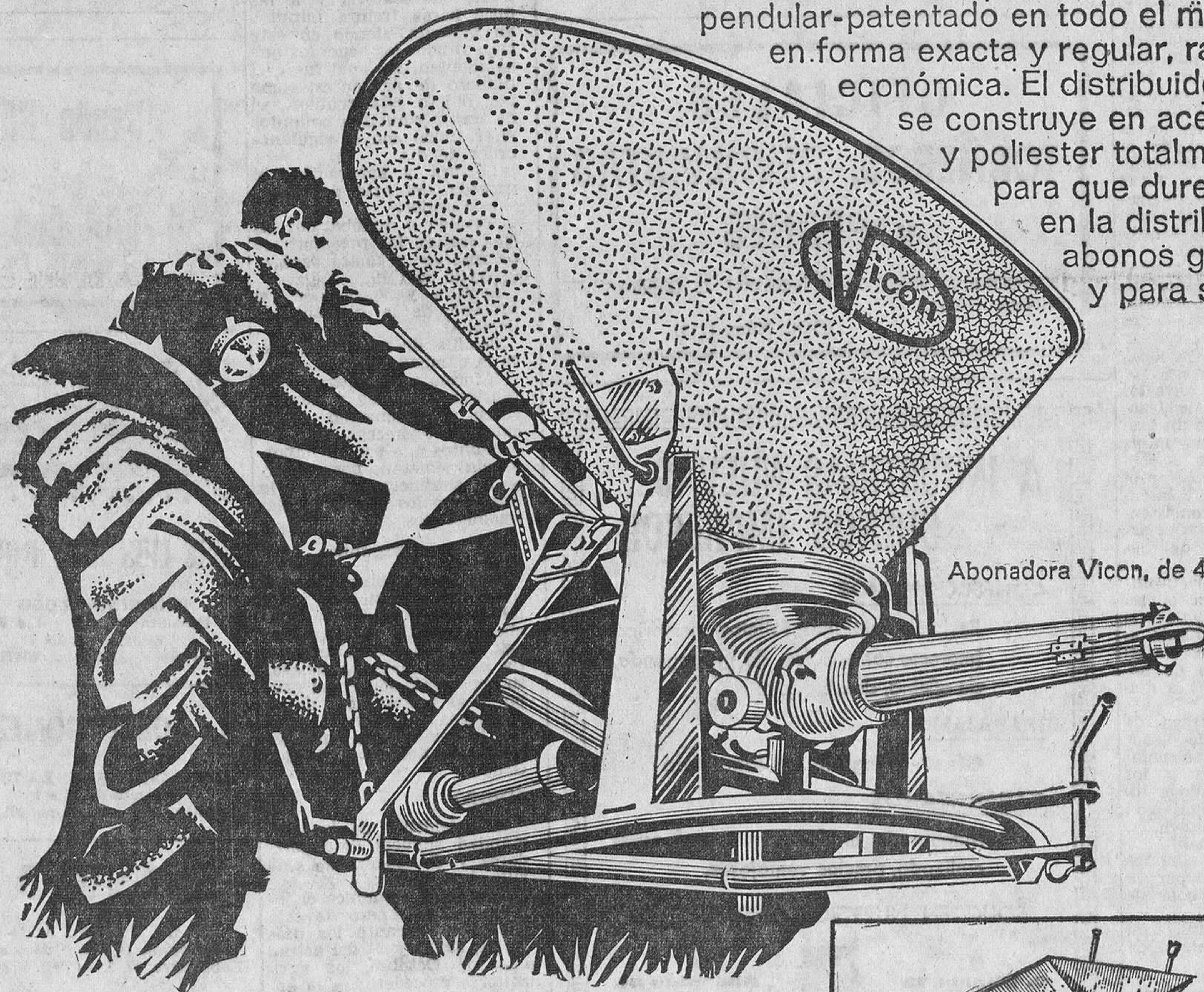
Abonadora Vicon, de 400 T.

No tiren el abono... El distribuidor Vicon de sistema pendular-patentado en todo el mundo-lo esparca en forma exacta y regular, racional y económica. El distribuidor Vicon se construye en acero inoxidable y poliéster totalmente anticorrosivo para que dure años. Puede usarse en la distribución de abonos granulados o en polvo y para sembrar a voleo.