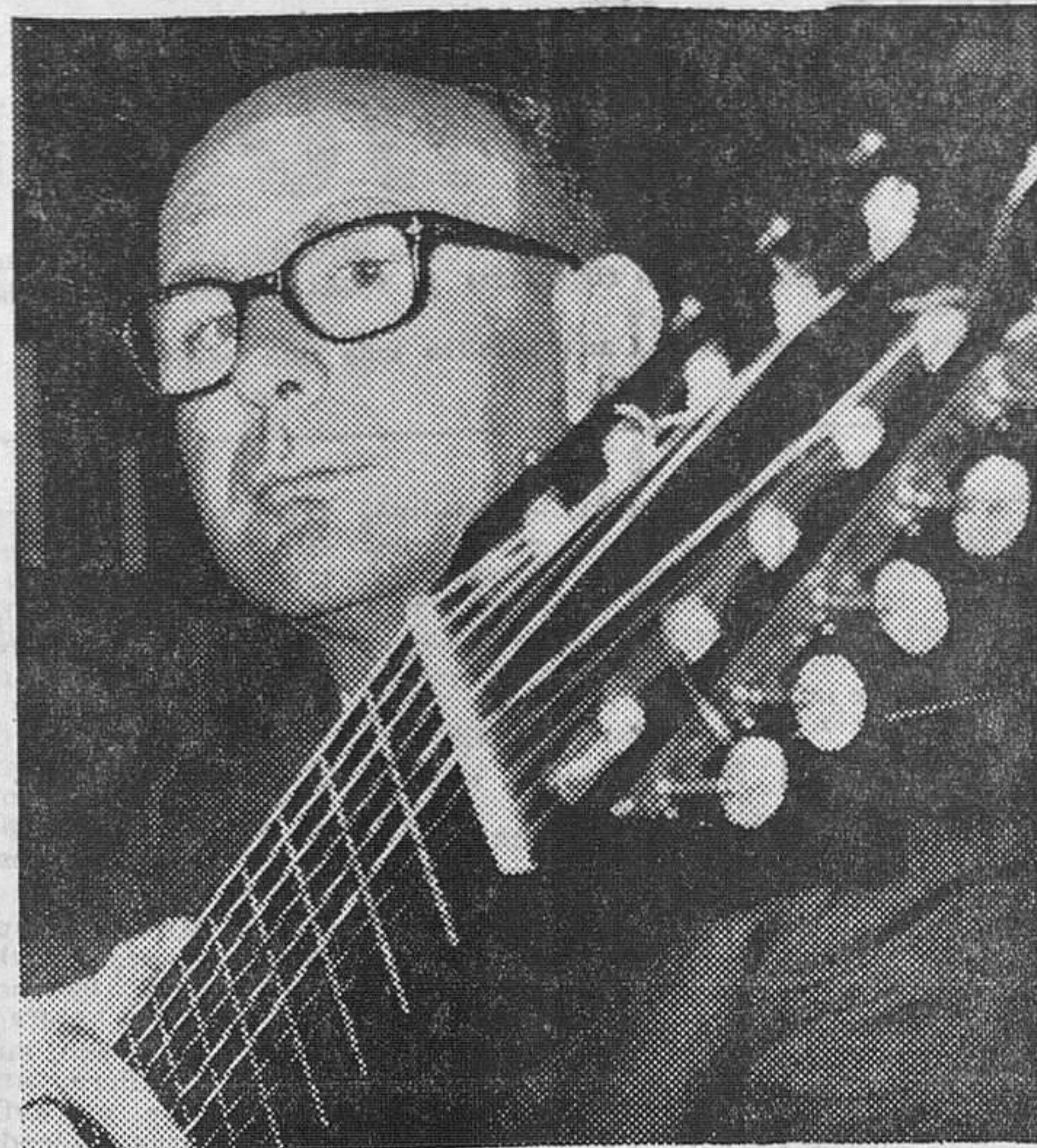
Narciso Yepes, el guitarrista español, de fama universal