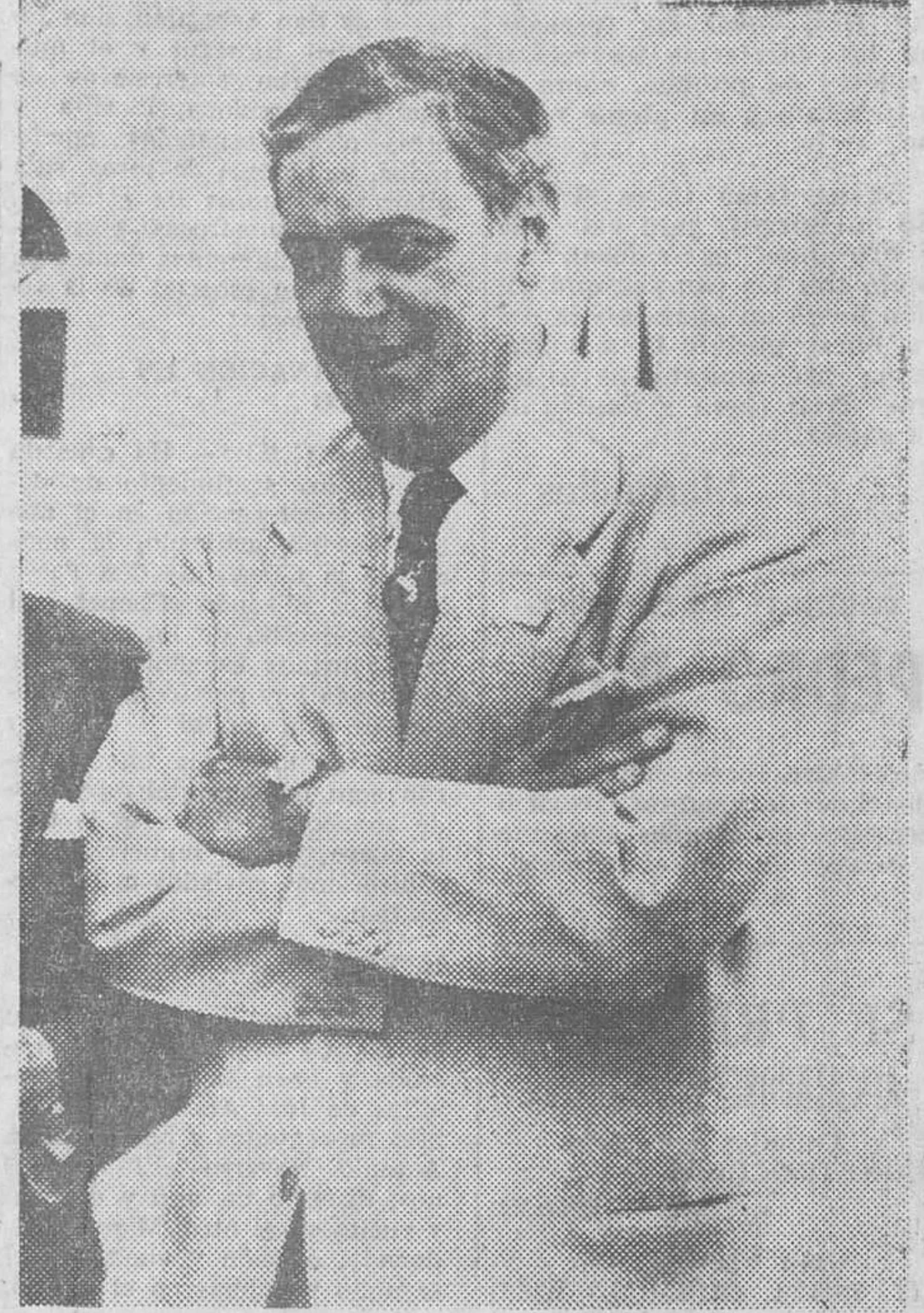
«Si el arte no está ligado al pueblo no es arte siquiera». «¡Hay que ver lo difícil que es la felicidad!». solía decir el ilustre músico cubano - español. En la foto aparece un primer plano del maestro.

Ernesto Lecuona había nacido en el popular barrio habanero Guanabacoa, en el año 1897. Sus padres y sus abuelos eran nativos de Canarias. Desde muy pequeño sintió una gran atracción por la tierra de sus padres. Y su admiración por España la demostró viajando a ella doce veces y permaneciendo en cada una de aquellas ocasiones tiempo indefinido. Y como cosa de destino, Ernesto Lecuona vino a morir precisamente en la tierra de sus antepasados, Santa Cruz de Tenerife, a la edad de sesenta y seis años. Esto ocurrió en Diciembre del 63. Hace, pues, cinco años que desapareció el músico más fabuloso que ha nacido en la isla cubana.