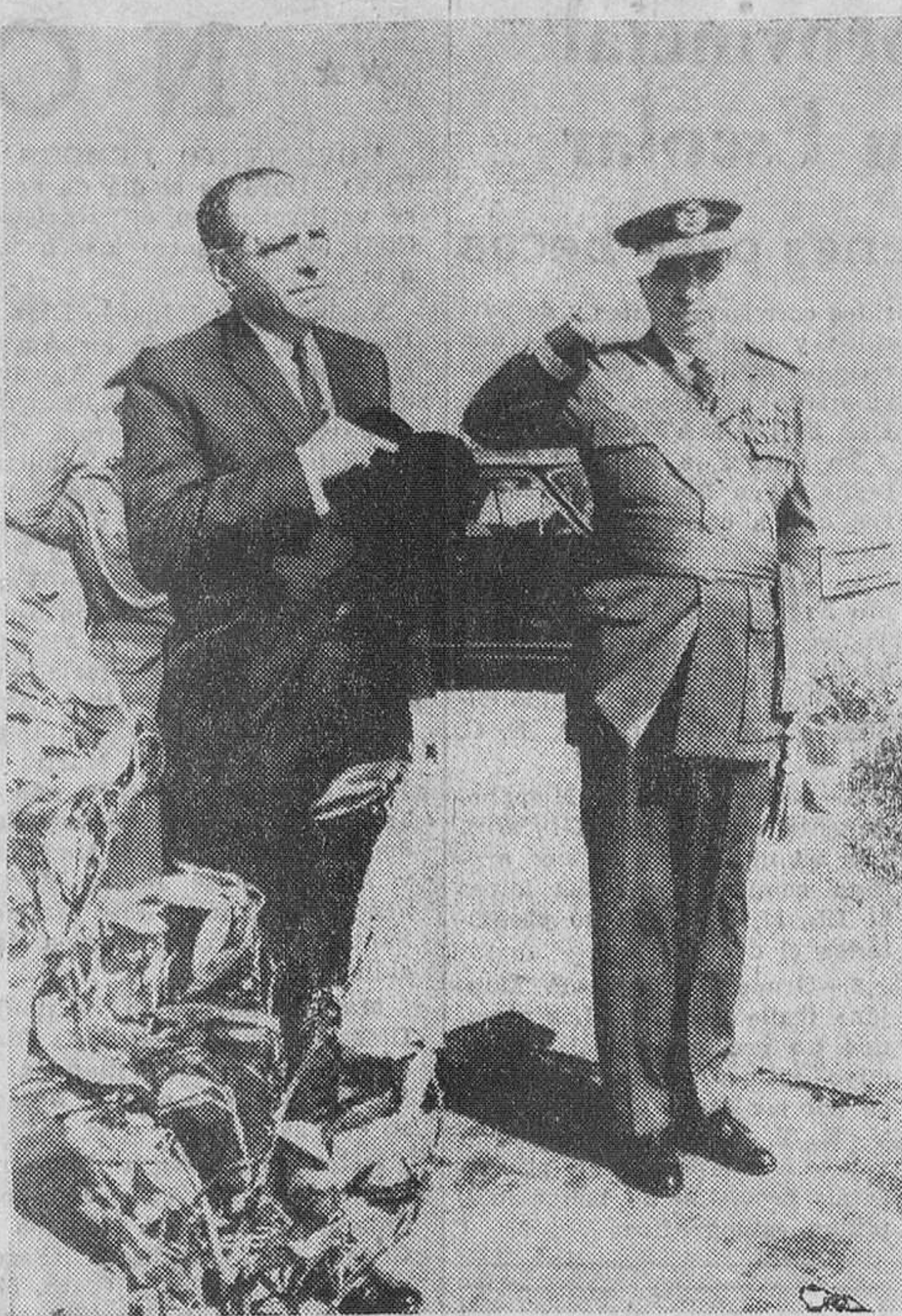
Barcelona.—El presidente de Nicaragua, don René Schick Gutiérrez, escucha los himnos nacionales de España y Nicaragua, a su llegada al aeropuerto de Barcelona.