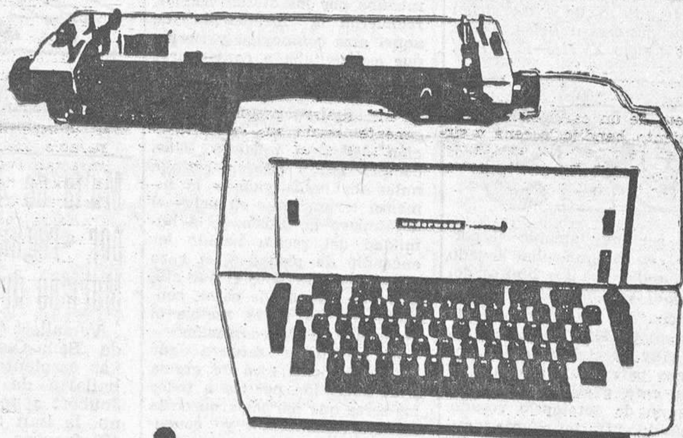
máquinas de escribir UNDERWOOD