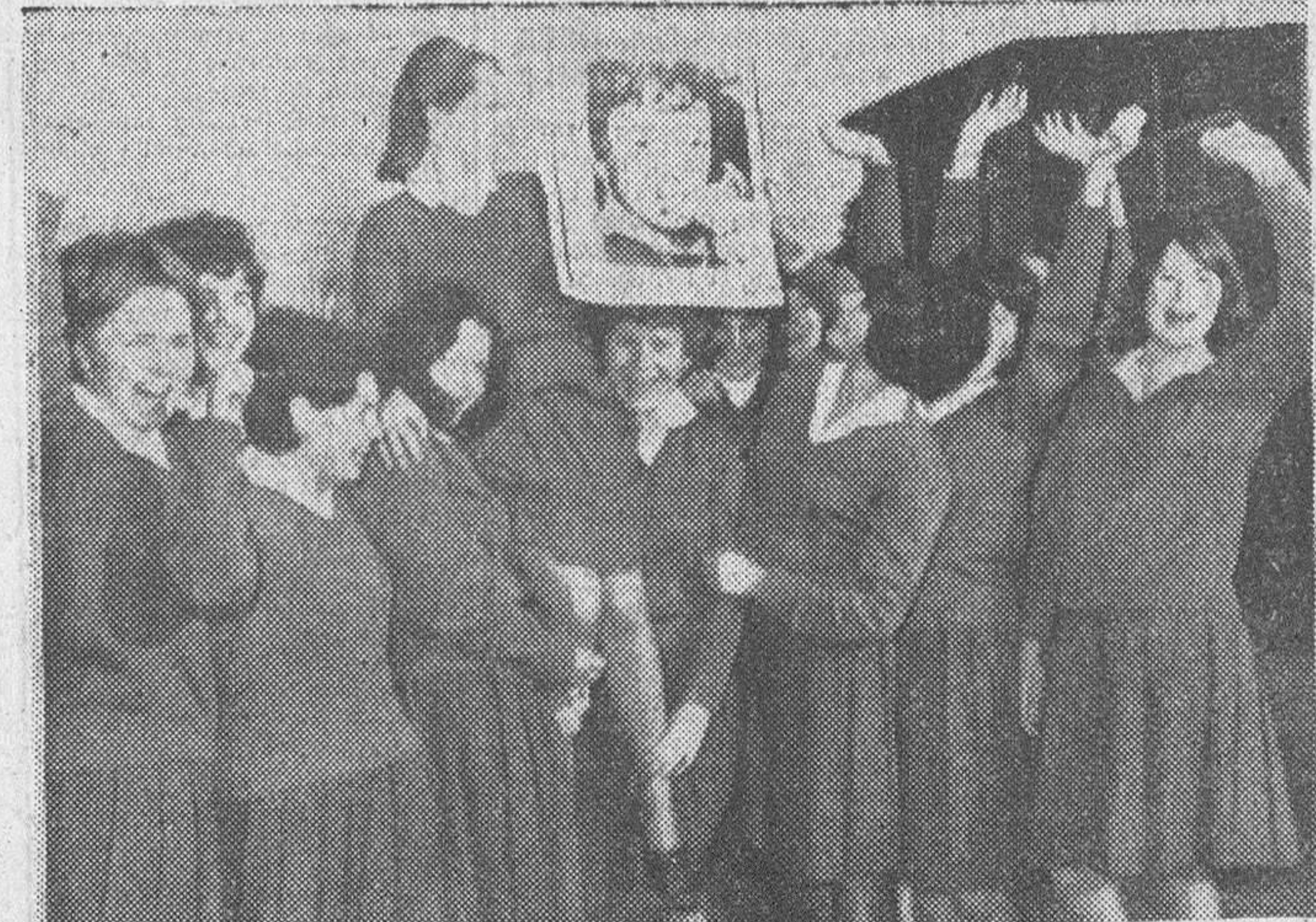
New Malden (Inglaterra).—Las jubilosas niñas elevan a una de ellas que porta una fotografía de la profesora de Educación Física, Ann Packer, ganadora de una medalla de oro en la Olimpiada, en la prueba de 800 metros. Las niñas muestran la foto llegada por radio desde Tokio en la que aparece la profesora mostrando su medalla de oro.