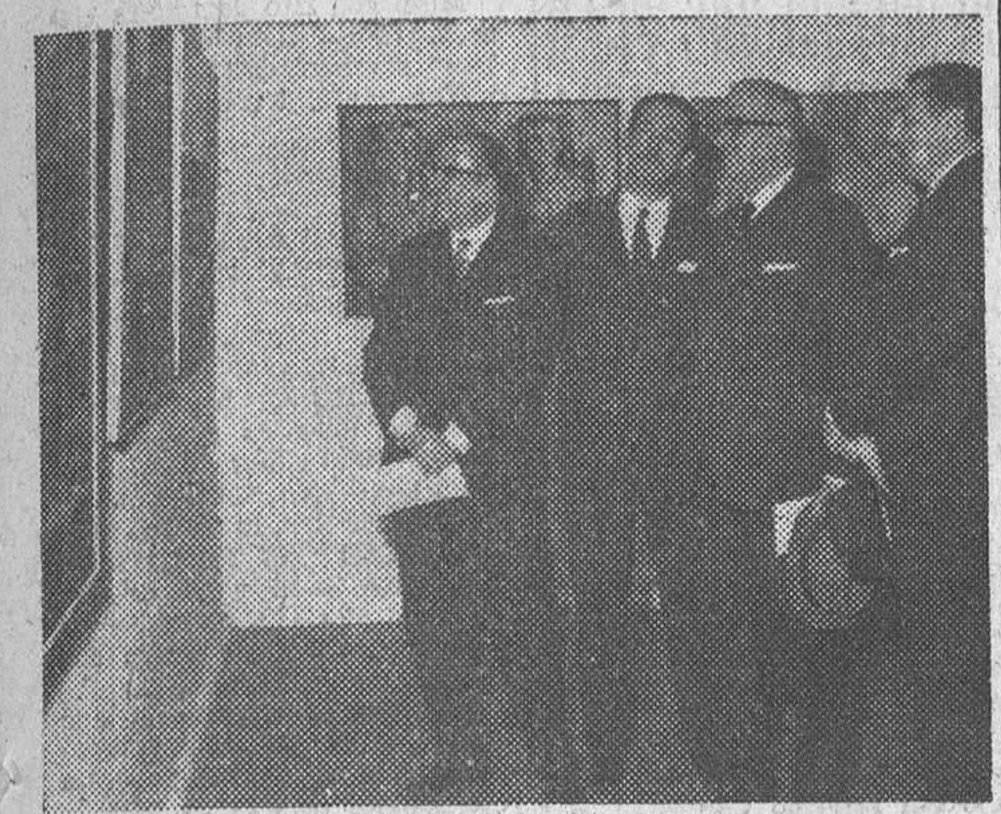
Madrid.—El ministro de Educación Nacional y el subsecretario de su Departamento, acompañados del director general de Bellas Artes y de otras personalidades, durante su visita a la exposición XXV Años de Arte Español con motivo de su inauguración en el Palacio de Exposiciones del Retiro.