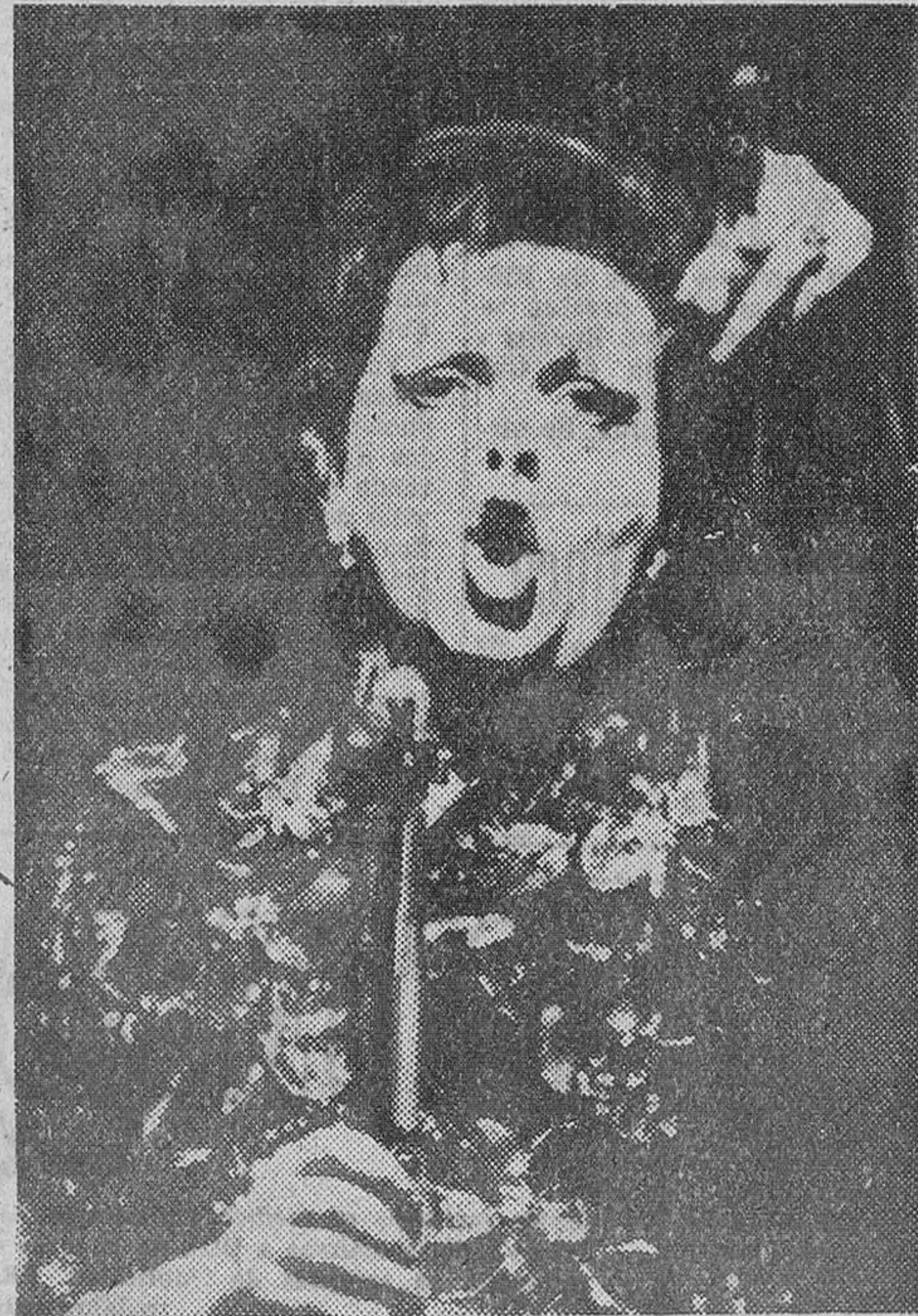
Judy Garland ha sabido conservar la fama que ganó en los primeros años de su juventud.