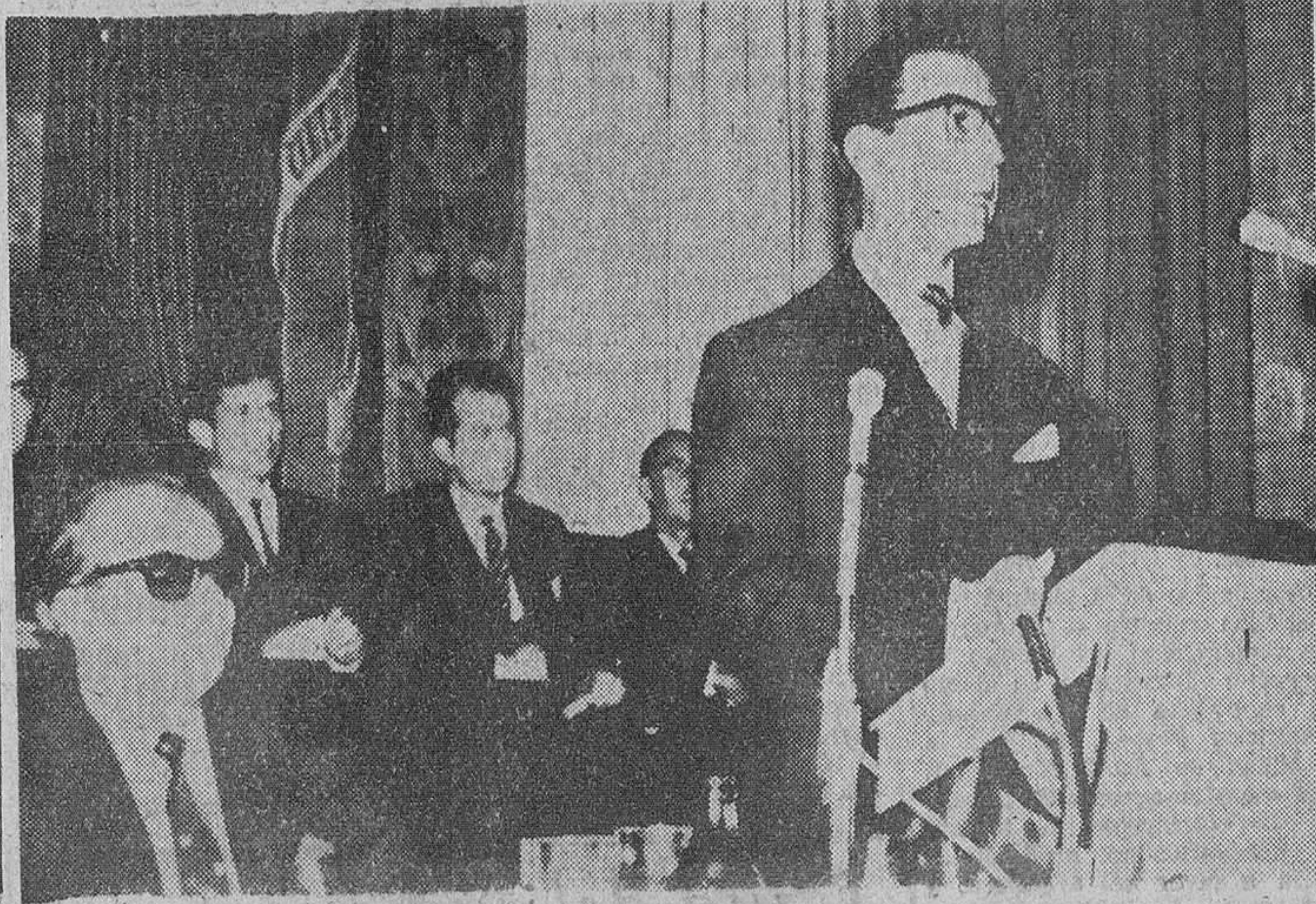
Bilbao. — El ministro de Comercio, señor Ullastres, ha inaugurado en esta capital la III Feria Técnica de Herramientas. Al acto asistieron además de las autoridades locales, el ministro de Comercio de Kenia.

Que se conserve la enseñanza del español en Filipinas