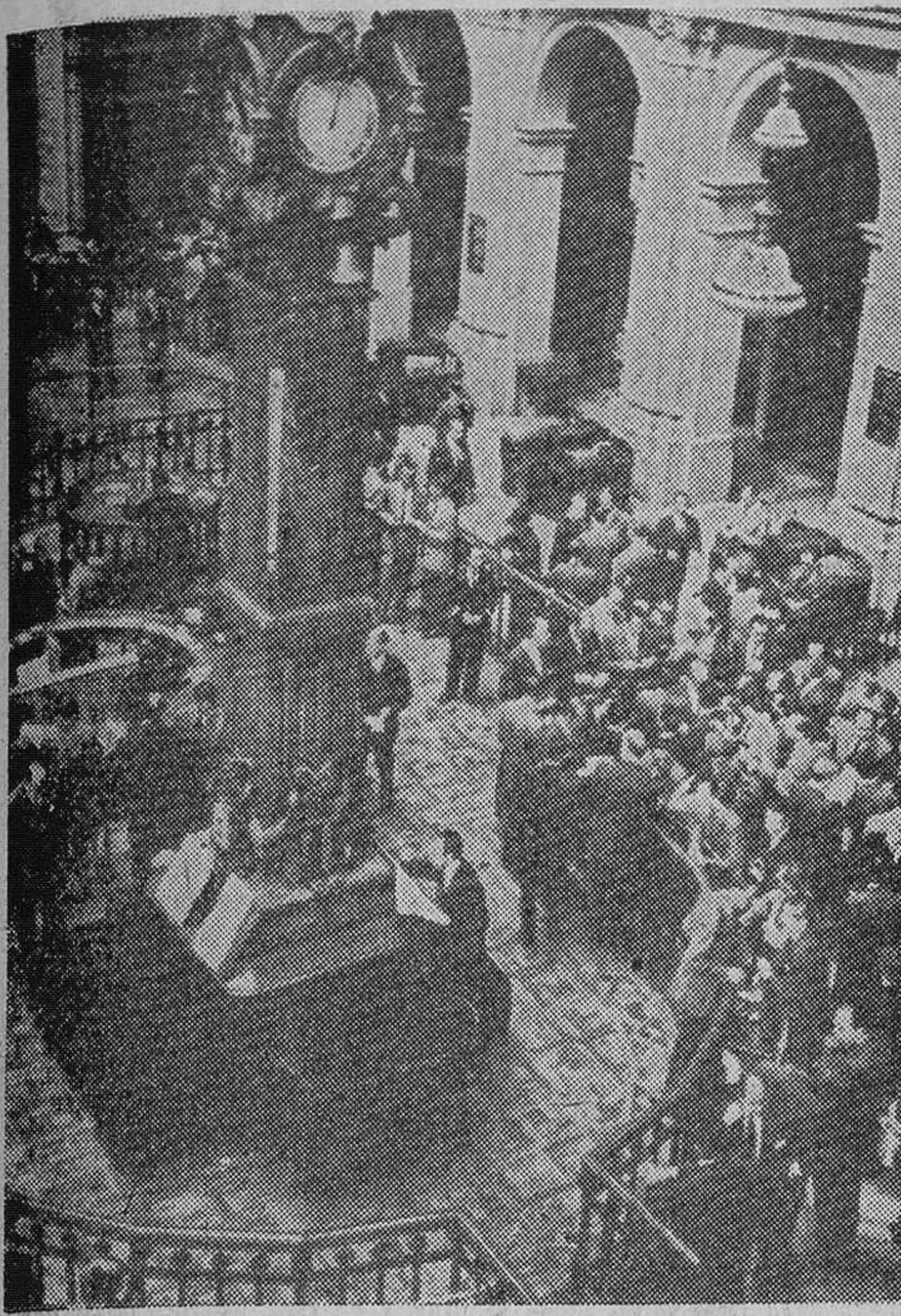
Un momento de las operaciones en la Bolsa de Madrid. La animación de los corros durante las transacciones crea un clima de frenesí, en el que, tras las voces de los agentes, ballan su danza inmaterial los millones de la contratación bursátil.