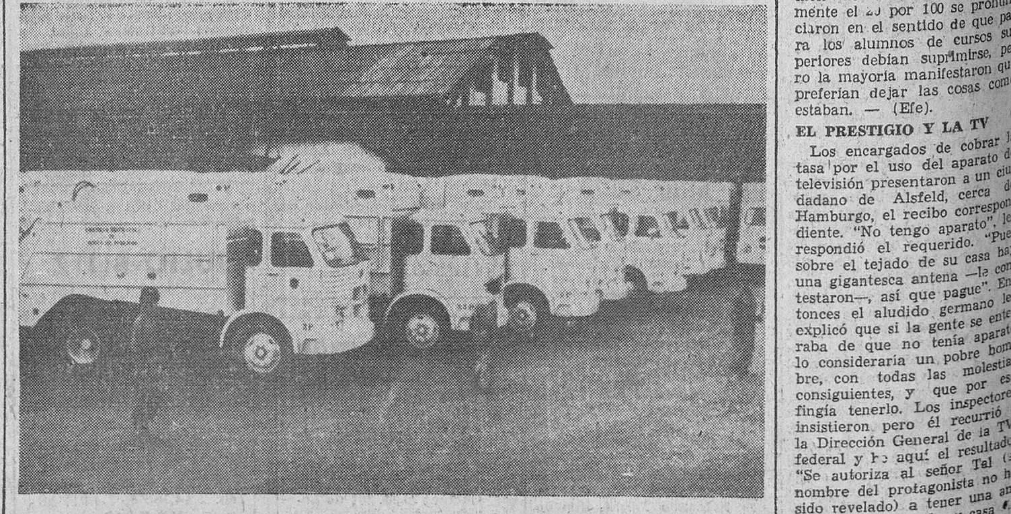
El Ayuntamiento de Bogotá, capital de Colombia, ha comprado a la firma española "Pegaso" 50 camiones destinados al servicio de recogida de basuras en esa ciudad. En la fotografía vemos parte de los camiones dispuestos para entrar en servicio.