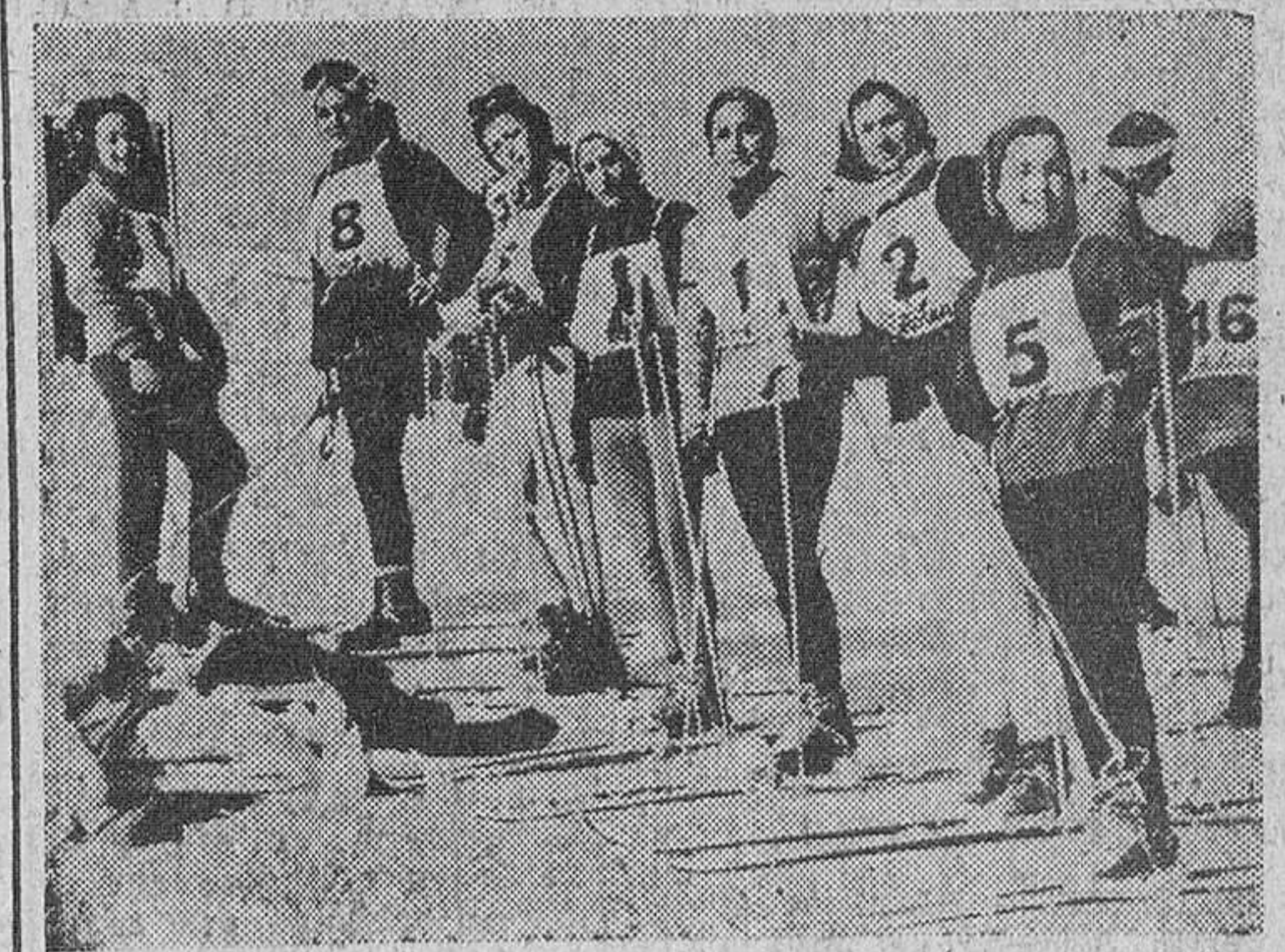
La Molina. — En las pistas de La Molina se ha celebrado el Décimo Derby Internacional de esquí, en las modalidades de habilidad y combinado alpino. — En la fotografía, las participantes femeninas. — (Foto Cifra)