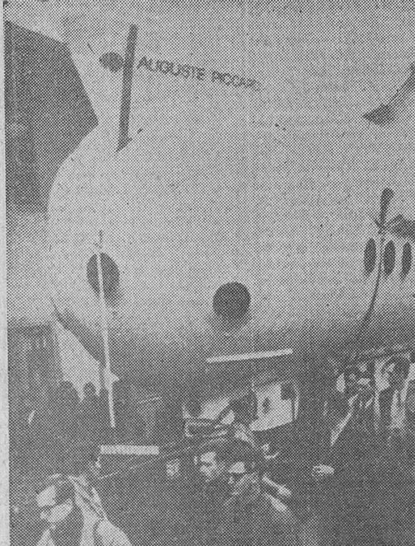
El Mesoscafo «Auguste Piccard», un submarino turístico construido para visitar el fondo del lago de Ginebra, está terminado y dispuesto para su botadura.