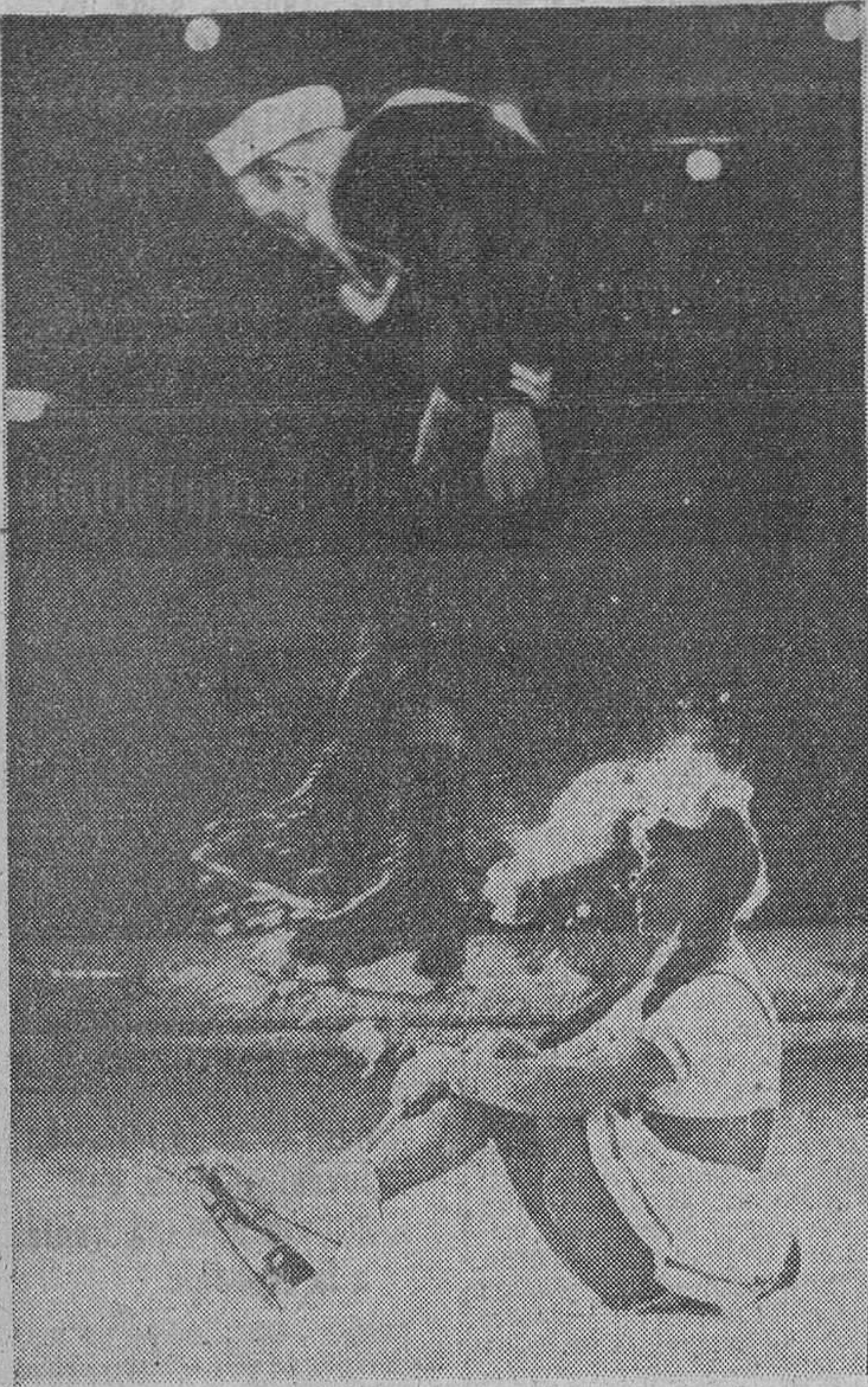
He aquí la más moderna versión de la hazaña de Guillermo Tell. Partir en dos con sus patines, la manzana colocada sobre la cabeza de una muchacha sentada sobre la pista de hielo.