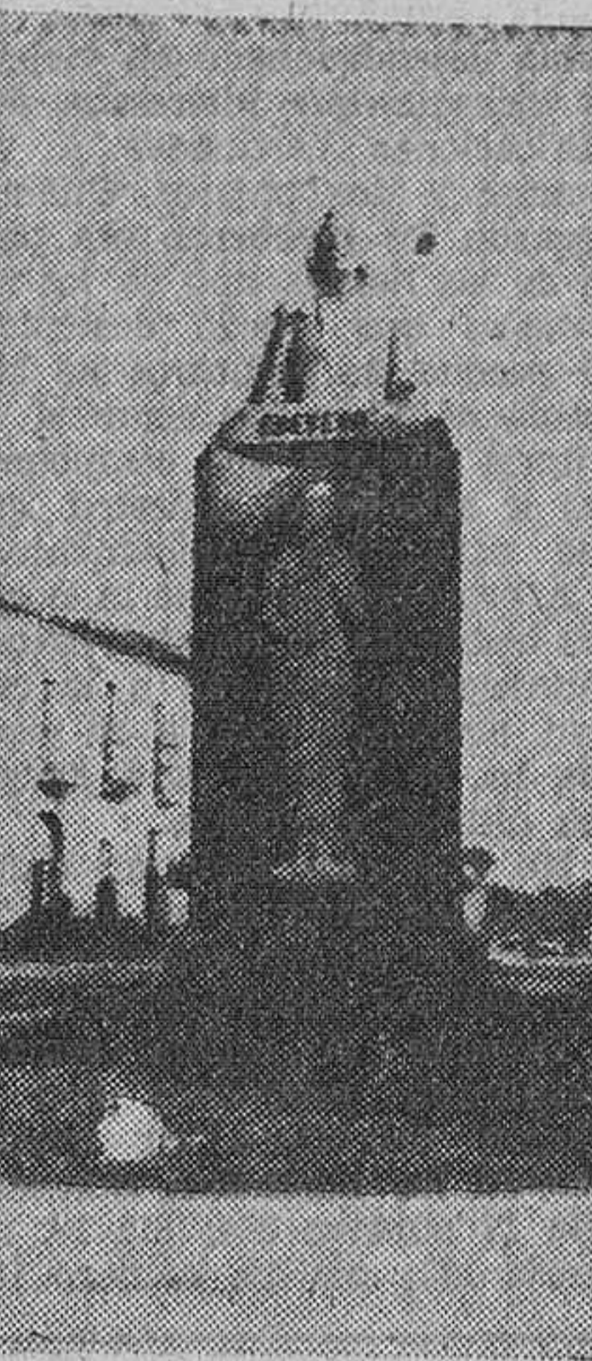
El monumento a Quevedo, en el convento abandonado de Villanueva de los Infantes (Ciudad Real), lugar donde, se dice, está enterrado el insigne poeta y escritor.