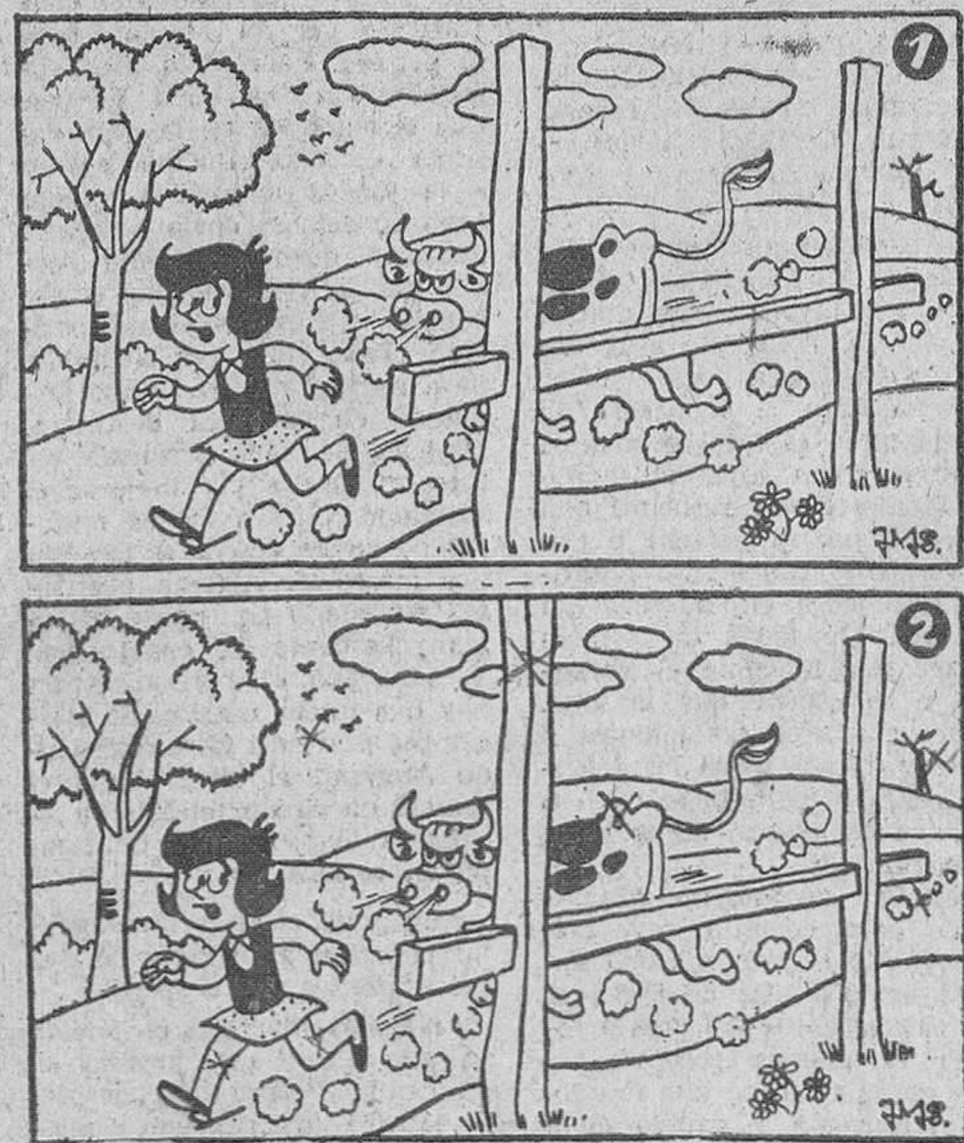
Estos dos dibujos son aparentemente iguales. Siete diferencias los separan. Si es usted buen observador, debe descubrirlos antes de cinco minutos.