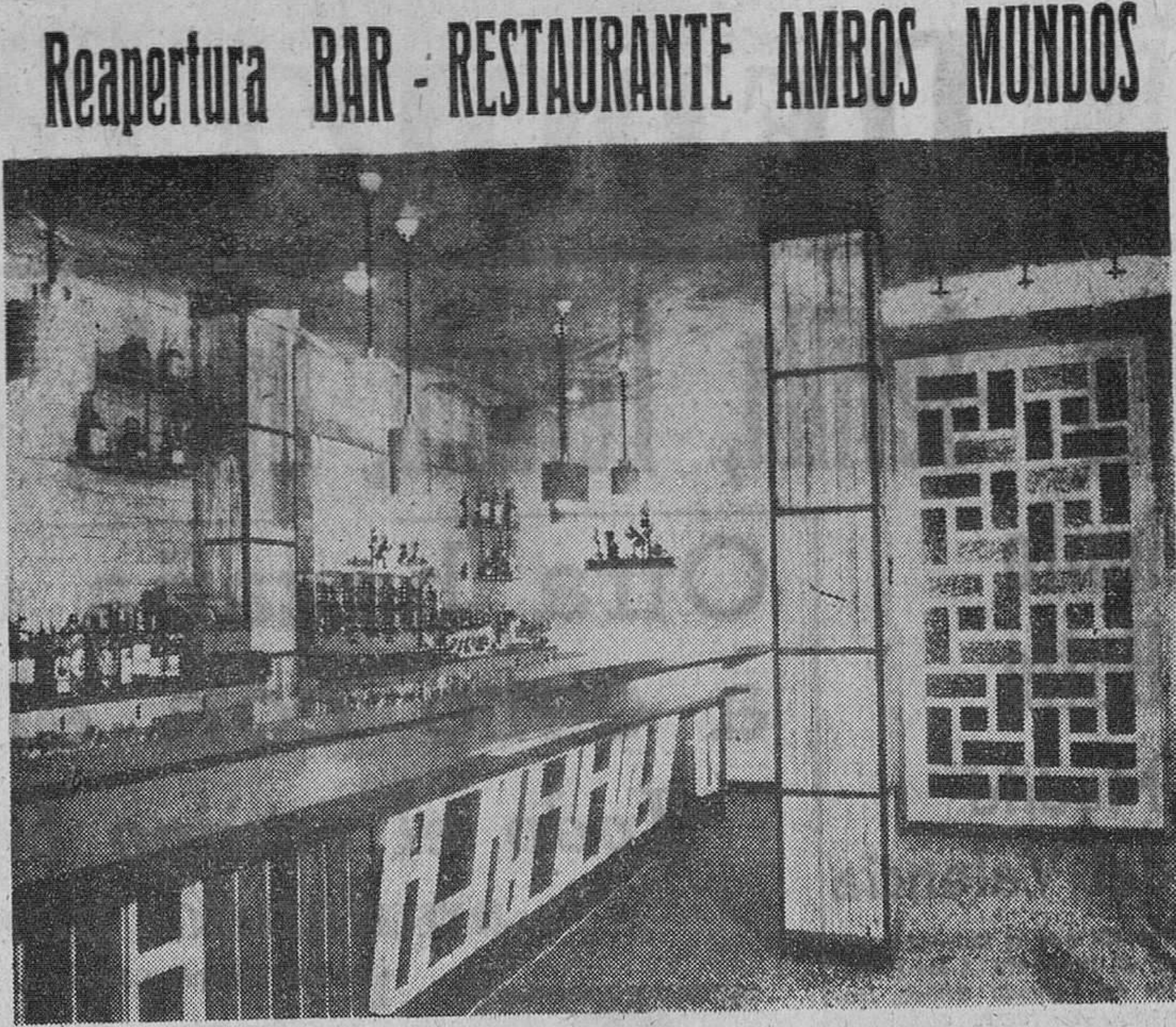
En la presente fotografía, ofrecemos a nuestros lectores un aspecto de la magnífica reforma del BAR-RESTAURANTE AMBOS MUNDOS; que el pasado sábado volvió nuevamente a abrir sus puertas al público.

proposiciones formuladas por las Empresas y teniendo en cuenta sus proyectos de orden económico y social, el que resolverá qué empresa es la que tendrá derecho a gozar de los beneficios que se otorgan. Séptima pregunta. — ¿Habrá libertad de importación de maquinaria? Respuesta. — Dentro de los beneficios concedidos a las industrias de interés preferente, figura hasta el 85 por 100 de exención de los derechos arancelarios. Octava pregunta. — La industria hotelera podría obtener los beneficios del Plan? Respuesta. — Efectivamente, estos beneficios son compatibles.