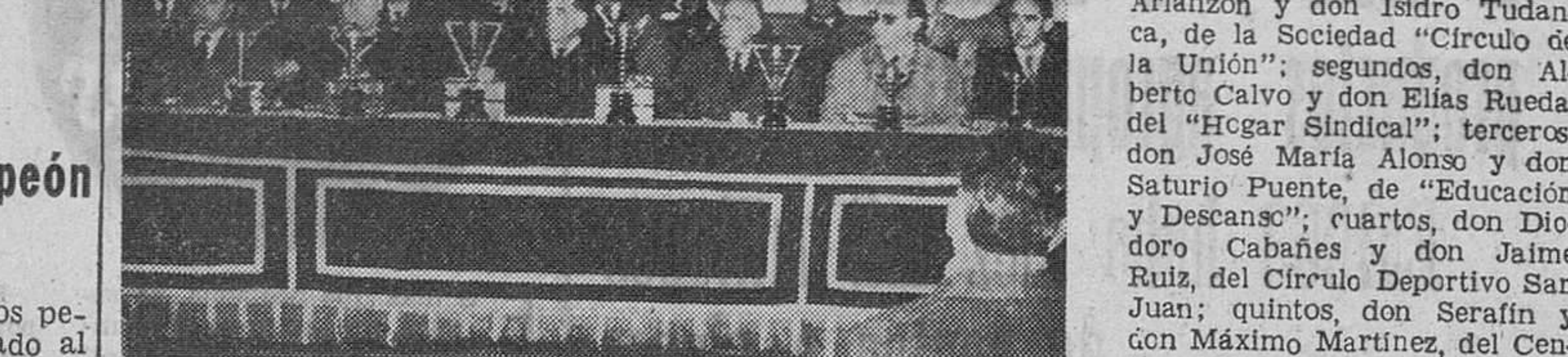
Aspecto del estrado presidencial, durante el brillante acto celebrado el pasado domingo en la Escuela de Agricultura de Saldafuella, con motivo de la entrega de trofeos y premios, a las parejas clasificadas en el V Campeonato de juego de Mus, organizado por la Caja de Ahorros Municipal.—(Foto Fede).

Reparto de trofeos y premios a las parejas clasificadas en el V Campeonato de Mus de la Caja de Ahorros Municipal