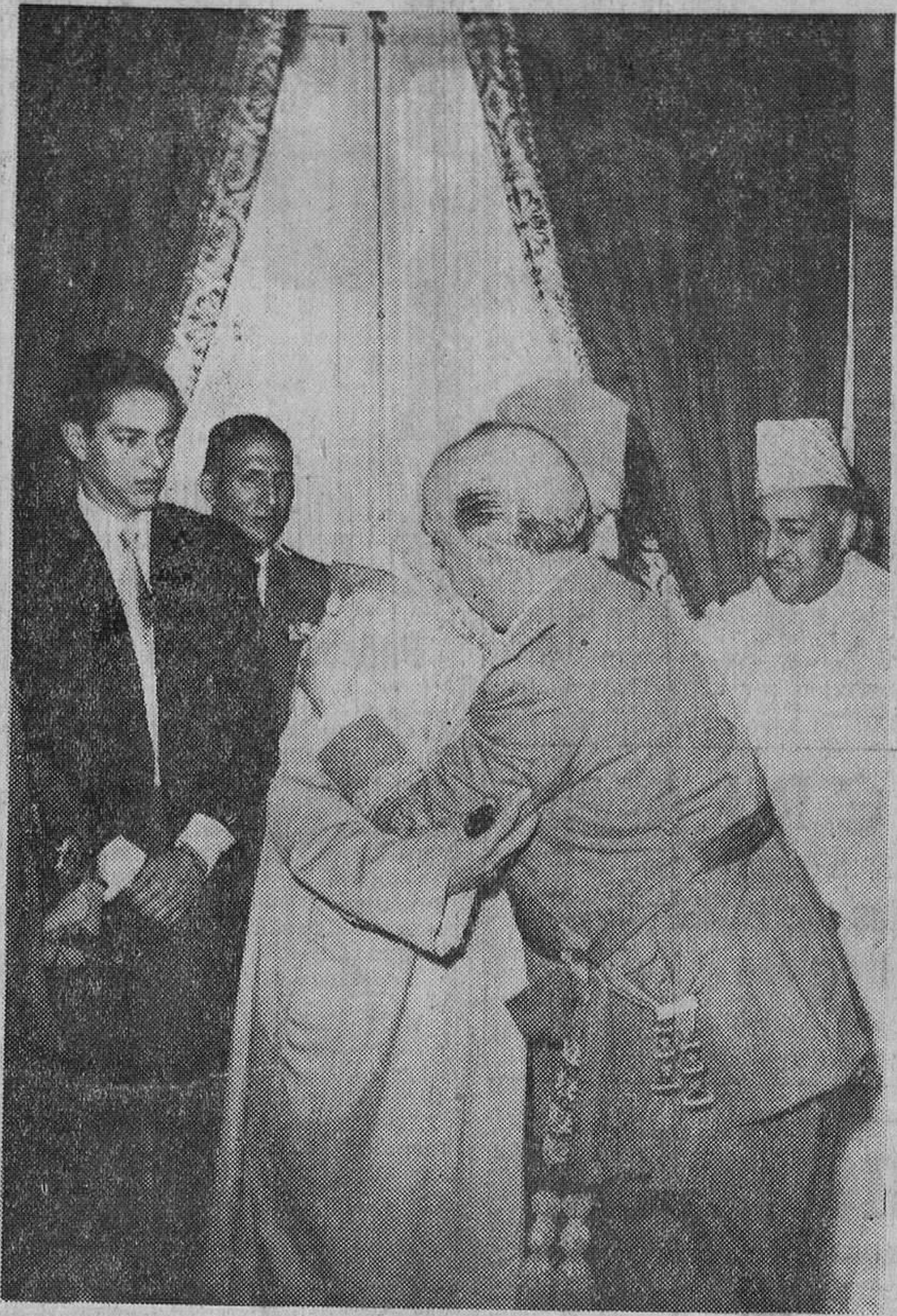
Fotografía retrospectiva de la visita a España, en los primeros días de Abril de 1962, del entonces Rey de Marruecos, Mohamed V, que fue recibido por Su Excelencia el Jefe del Estado. La «foto» muestra una escena cariñosa entre ambos jefes de Estado en el transcurso de dicha visita.