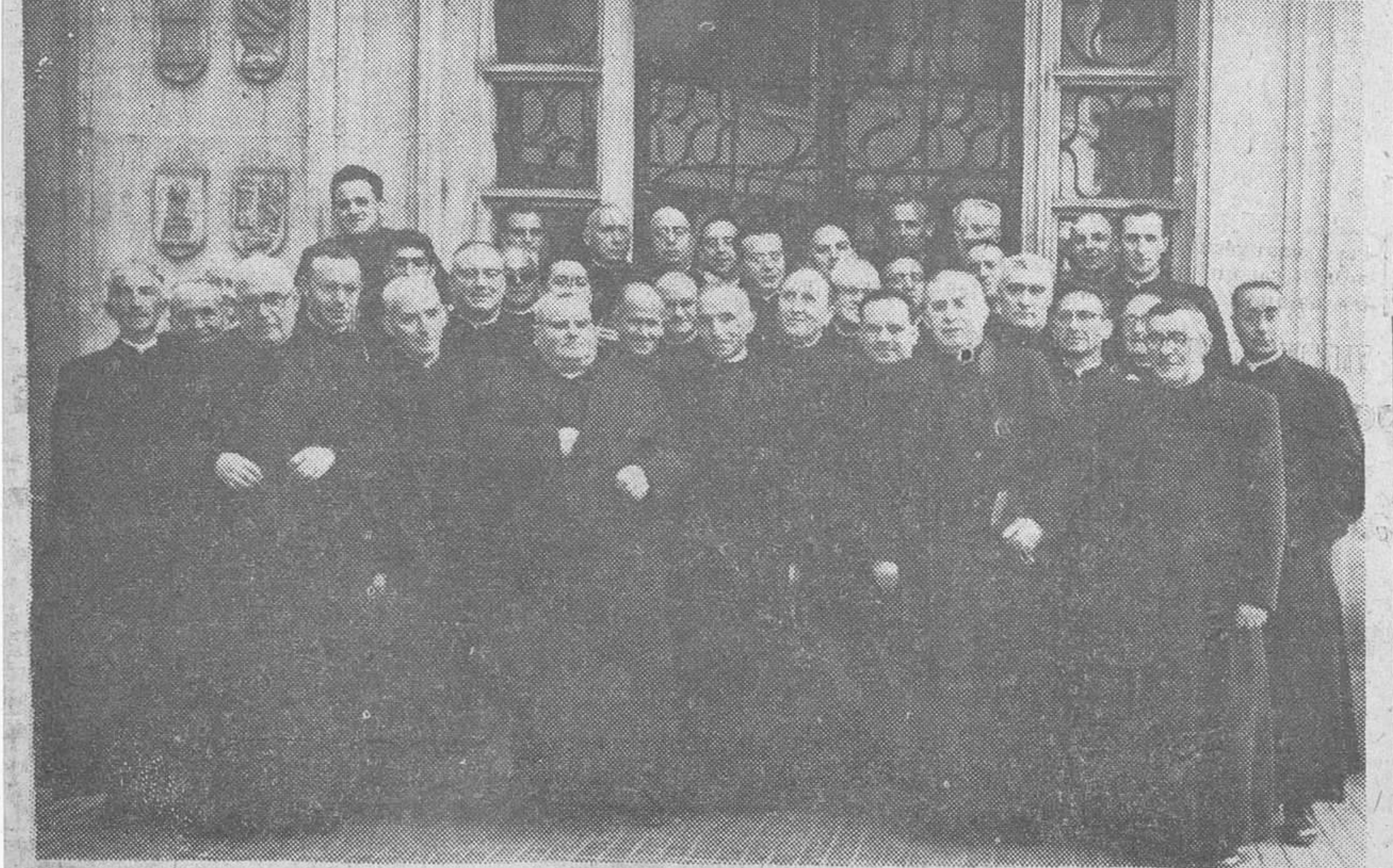
Grupo de sacerdotes de la diócesis de Burgos, viajeros en la excursión gratuita organizada en su honor por la CAJA DE AHORROS, que en la mañana de ayer partió de nuestra ciudad para visitar Segovia, La Granja de San Ildefonso, Valle de los Caídos, El Escorial y Madrid.