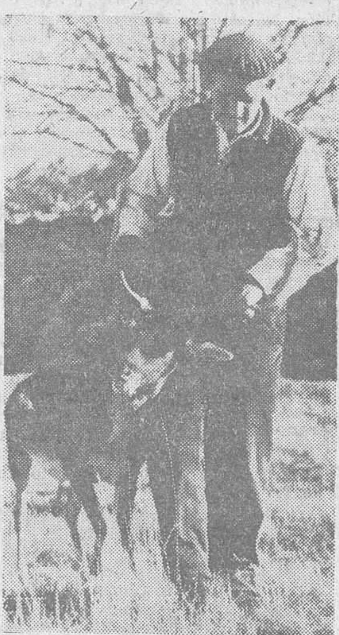
Sólo hay diez mil ejemplares en toda España.

Posiblemente uno de los trofeos de caza más codiciados en el mundo sea la capra montés española; la "capra hispánica". Para cazarla vienen deportistas de todos los puntos, no sólo de Europa sino del mundo entero. Su poca difusión y, concretamente, su escasez numérica, hacen que sea buscada en nuestras sierras como una de las piezas más deseadas. La "capra hispánica" ha corrido el riesgo de su total extinción. Algún tipo, como la "lusitánica", que era la de mayor tamaño, es ya una especie desaparecida. Pero la inteligente labor del Servicio Nacional de Pesca, Fluvial y Caza ha hecho posible la repoblación de diversas especies en algunas zonas, para que este preciado animal no se extinguiese en los montes españoles. Resultado verdaderamente difícil llegar a una concepción exacta en cuanto al número de los ejemplares de cabras montesas existentes actualmente en España. Pero la cifra de diez mil se aproxima con bastante exactitud a la realidad. Poder llegar a ese número ha sido una gran labor. La tarea concreta del Servicio ha sido —y es— evitar por todos los medios la extinción de estos ejemplares y en procurar su repoblación a fin de que sigan constituyendo la atracción de numerosos cazadores españoles y extranjeros que se desplazan en busca de esta codiciada presa.