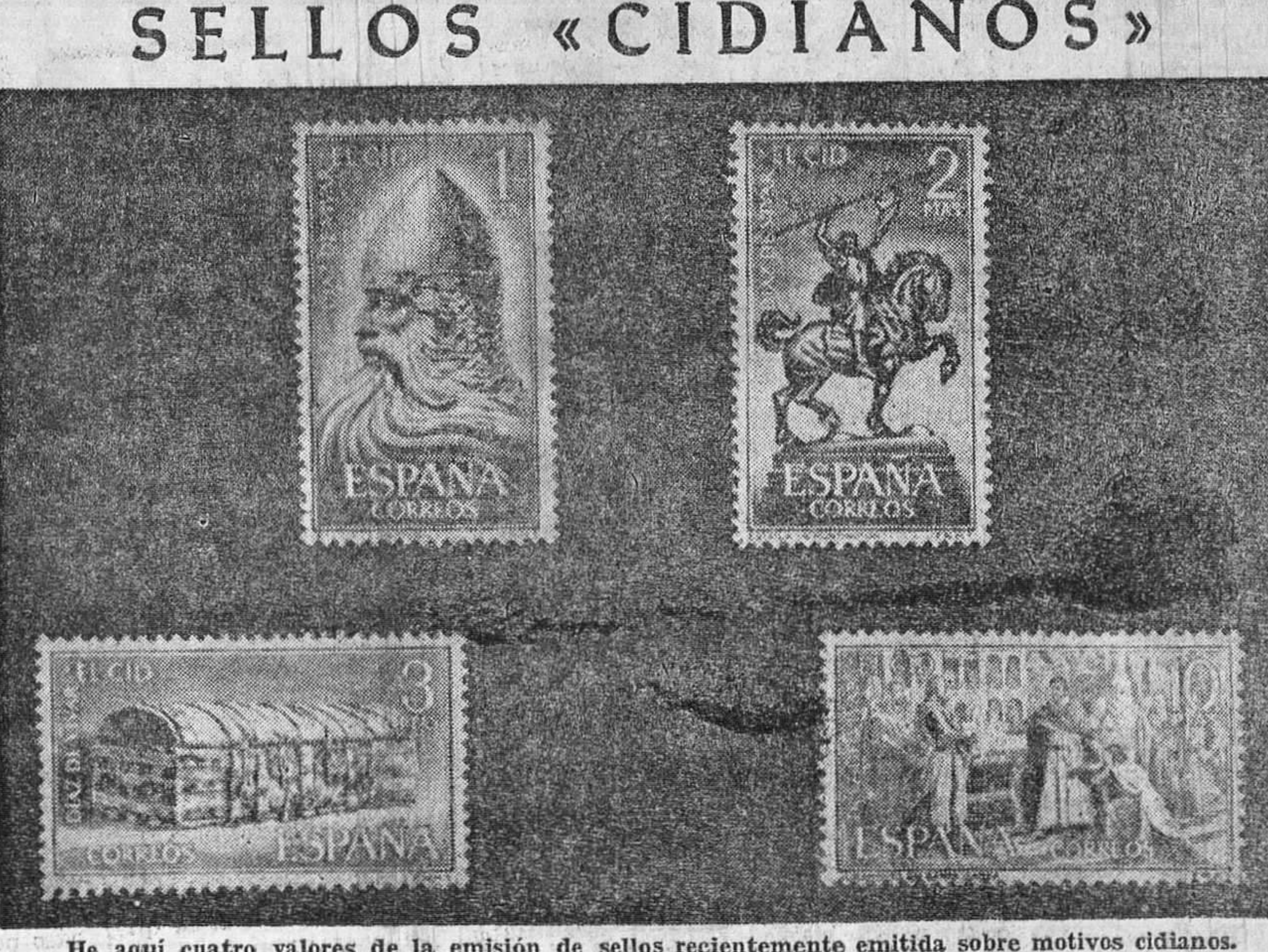
He aquí cuatro valores de la emisión de sellos recientemente emitida sobre motivos cidianos.

En vista de ello, la corporación municipal acordó dar el nombre del general Primo de Rivera a la actual Calle Ancha de esta ciudad.—Efe.