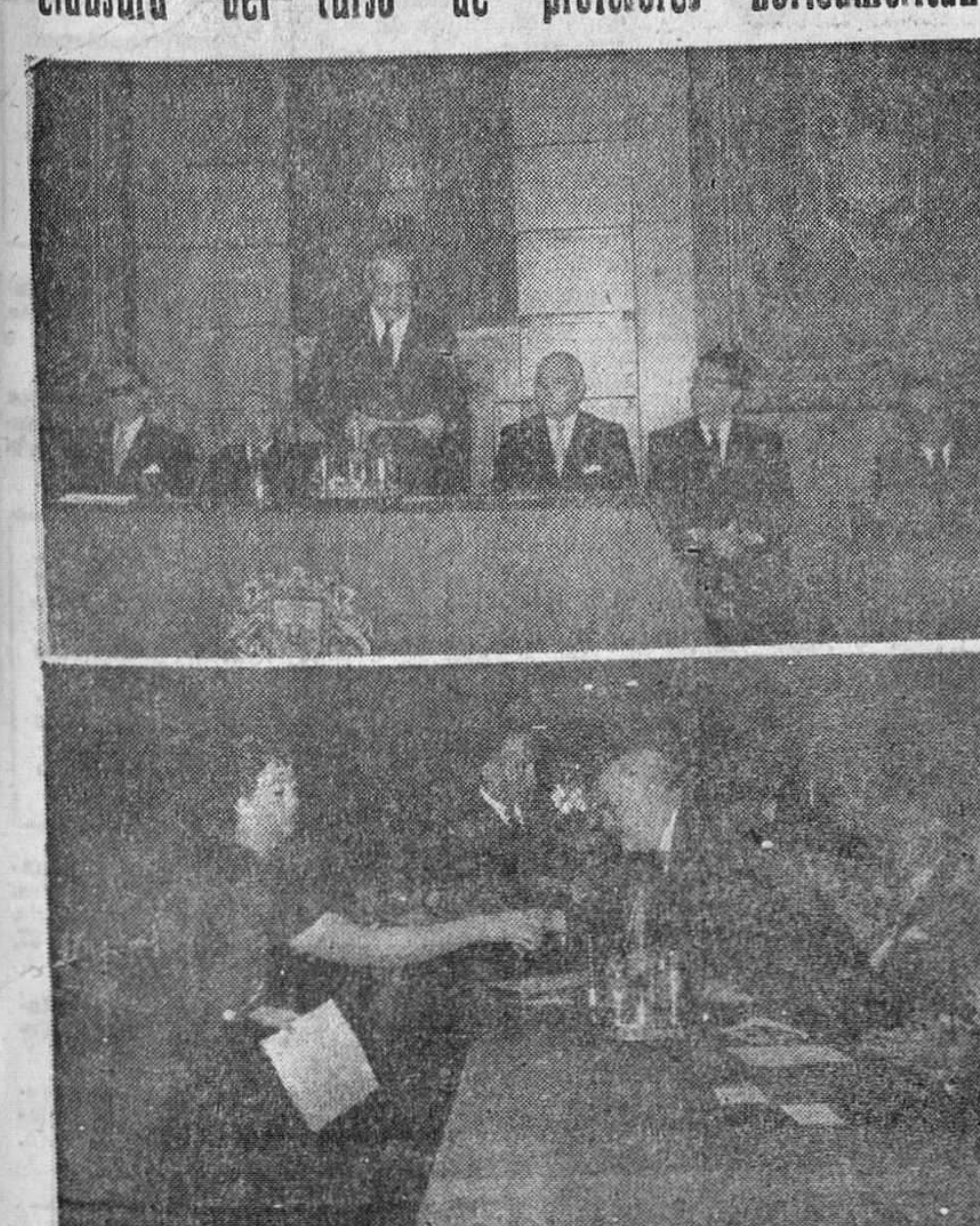
A mediodía de ayer tuvo lugar en la Sala de Jueces del Excelentísimo Ayuntamiento, el acto de clausura del curso de profesores norteamericanos del Instituto de Enseñanza Media. En las fotos de «Fedex» se reconocen dos momentos del acto: el alcalde de la ciudad, pronunciando unas palabras y, en el otro, una de las alumnas recibiendo el diploma entregado por el decano de la Facultad de Filosofía y Letras de la Universidad de Valladolid, que presidió el acto, en representación del Rector Magnífico.