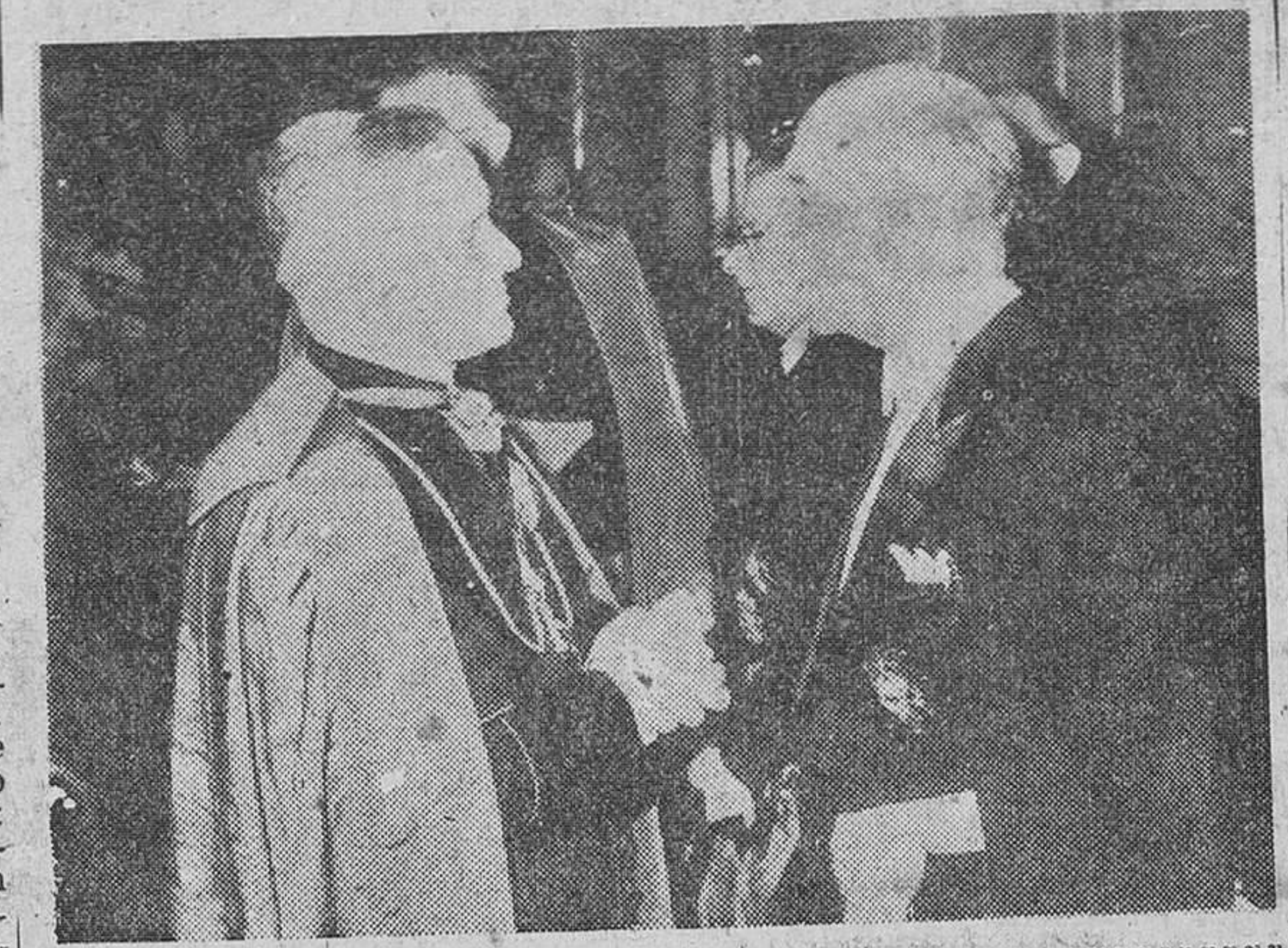
Vienna. — El embajador español, señor Ericé, charla con el Nuncio de Su Santidad en Austria, durante la recepción presidencial ofrecida por el doctor Schary, como es costumbre.