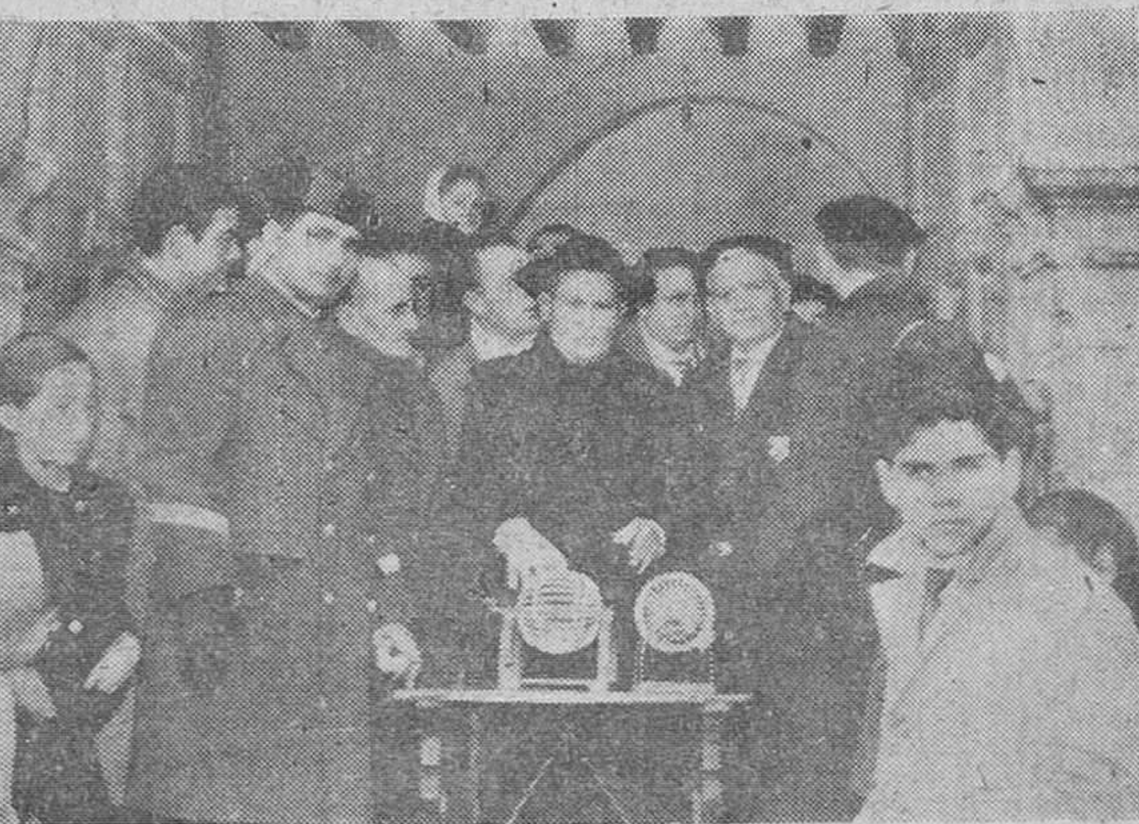
La fiesta de San Antón

«A continuación el anunciante añade su número de teléfono.—Efe.