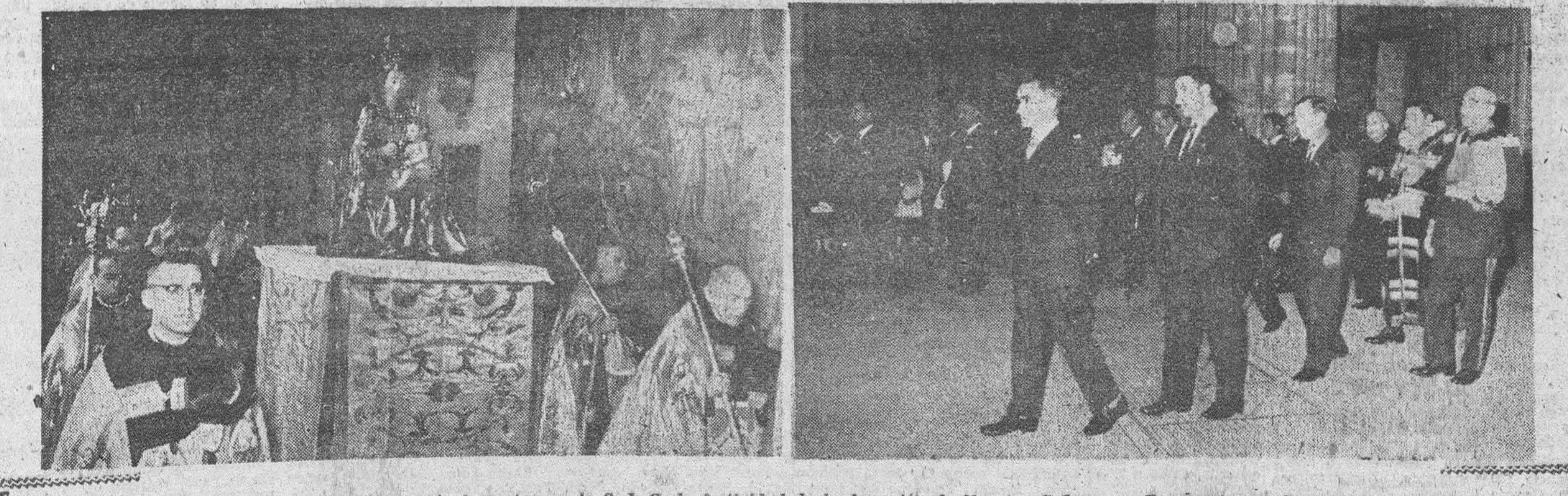
Con el acostumbrado esplendor, se conmemoró el martes, en la S. I. C., la festividad de la Asunción de Nuestra Señora. — En nuestro grabado, a la izquierda, un momento de la procesión claustral, presidida por el Excmo. Sr. Arzobispo; a la derecha, el Ayuntamiento en Corporación, formando en el solemne cortejo.