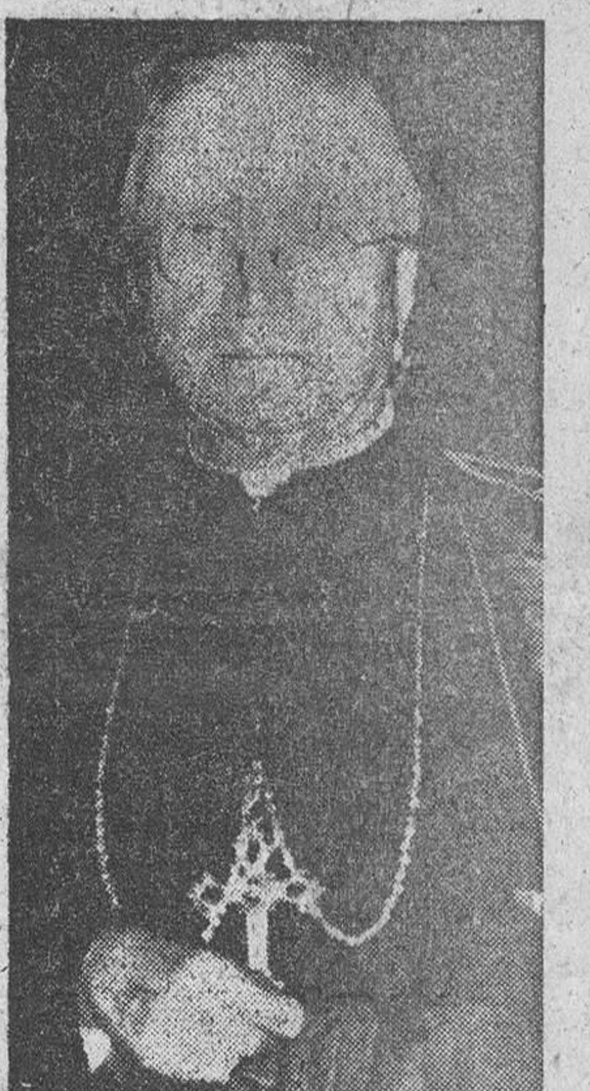
El cardenal Amleto Giovanni Cicognani, nuevo secretario de Estado de S. S. el Papa.