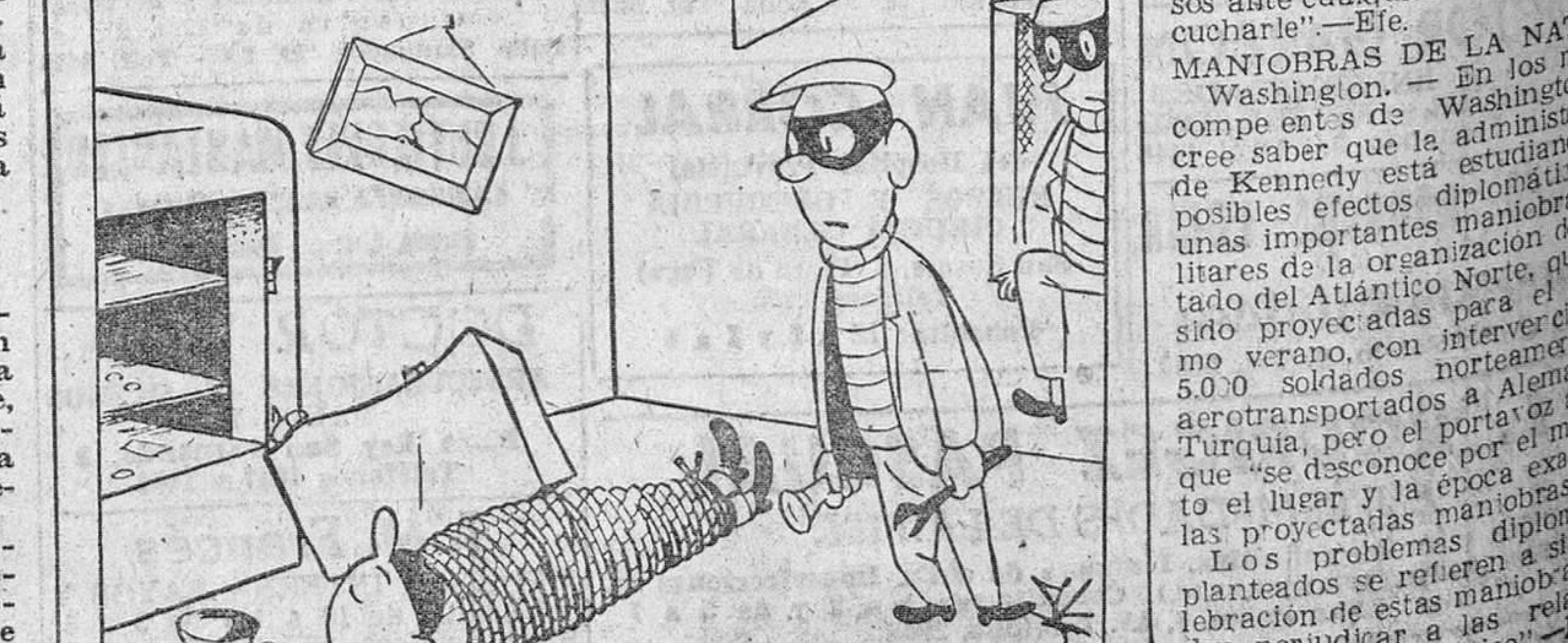
—¡Vaya; ya nos han ganado por la mano otra vez!