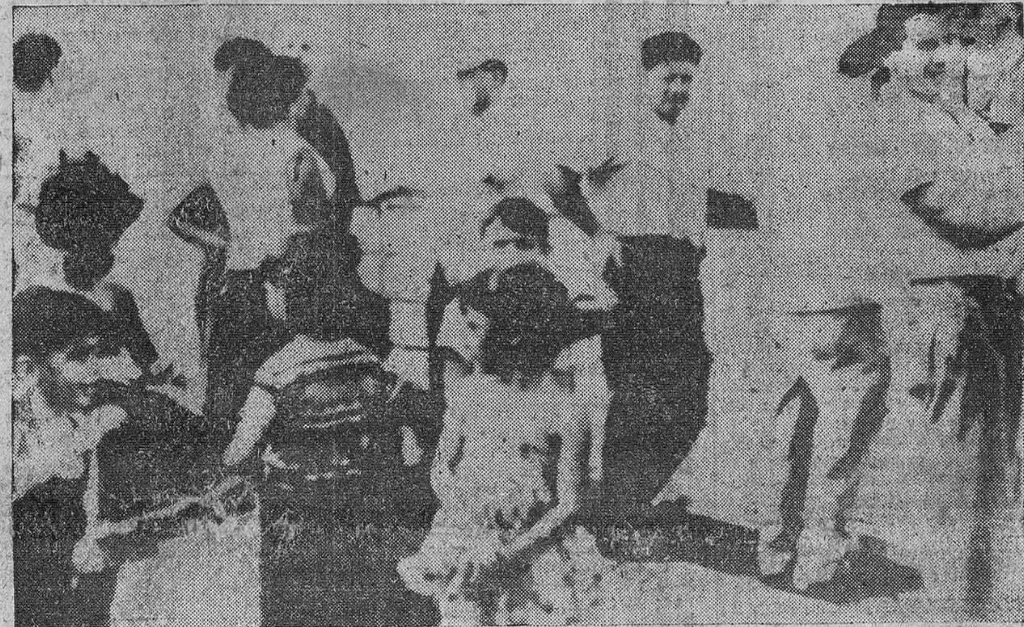
Recife (Brasil).—A la llegada del trasatlántico portugués "Santa María" a Recife, un grupo de pasajeros, entre los que juegan algunos niños, espera en la cubierta el momento de desembarcar.

Censuras a la actitud observada por las Marinas norteamericana e inglesa