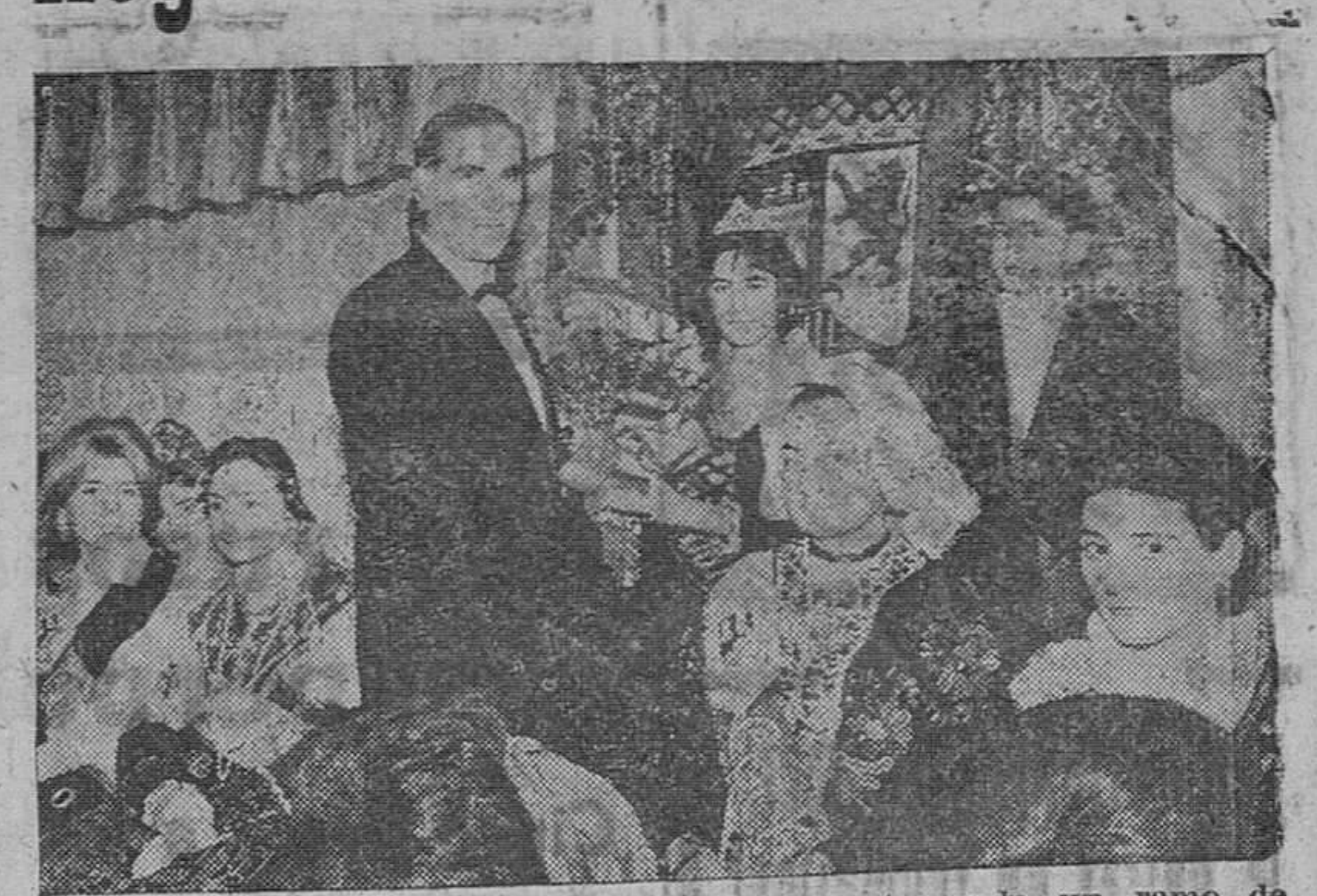
El presidente del Hogar Castellano-Leonés entregando un ramo de flores a la nueva Reina. A ambos lados de ésta, las señoritas representantes de Zamora, Salamanca, Toledo y Burgos, de izquierda a derecha.

colorido describe Castilla... León... Andalucía... Aragón... Cataluña... el Reino murciano... ¡Cómo recreo nuestro espíritu la remembranza de las Santas Emperatrices, Reinas y Princesas que enaltecieron el nombre de Isabel en la vida y en la Historia Patria! Terminó haciendo un canto bellísimo a la mujer española sin distinción de región. ¡Pinceladas! Así denominaba su charla; pero ¡qué pinceladas, queridos paisanos! ¡Qué maravillosa descripción!