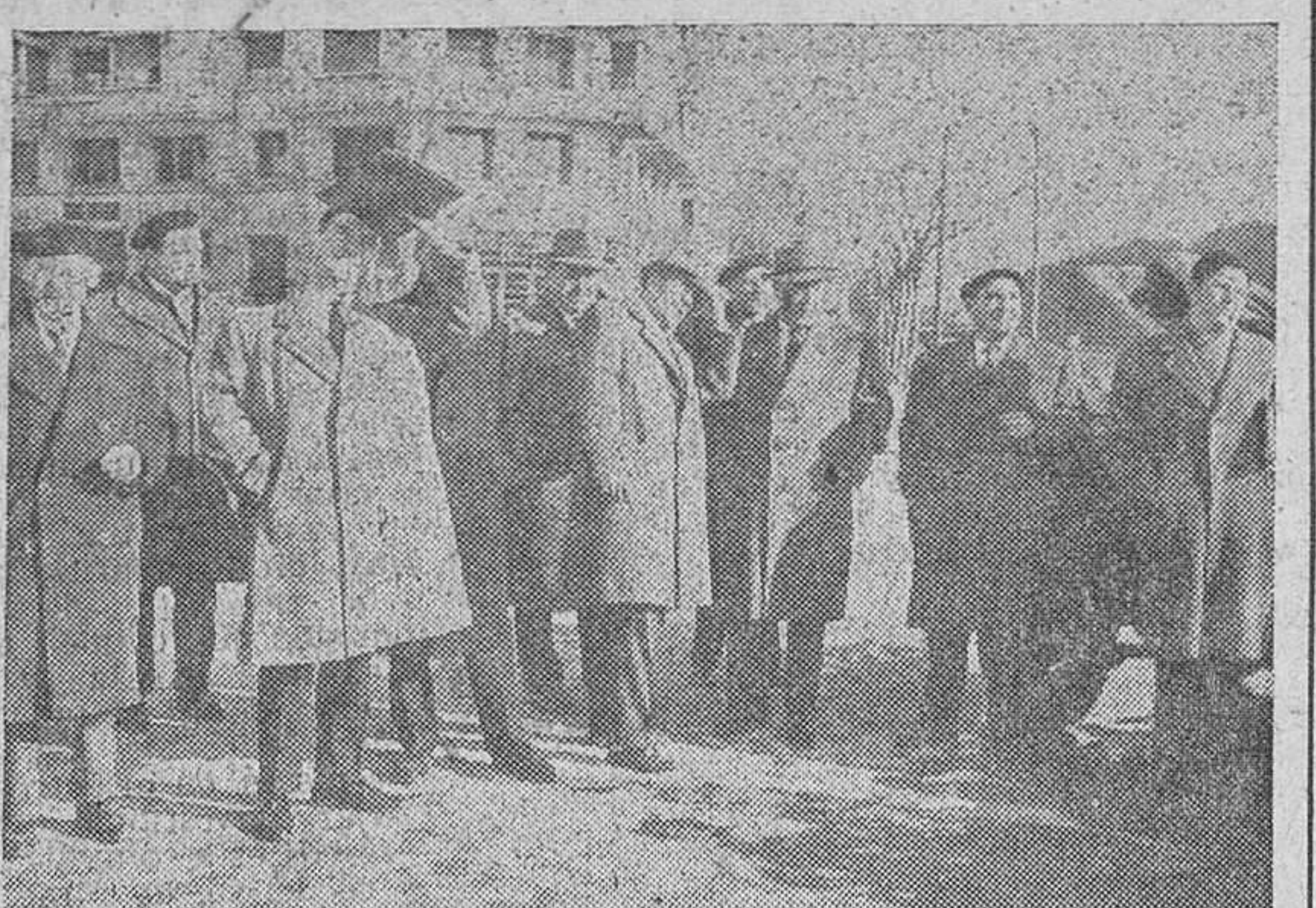
LAS AUTORIDADES, CONTEMPLANDO LAS PRUEBAS DE LA MOTOBOMBA.

Pruebas de una modernísima motobomba contra incendios, en la Avenida de Sanjurjo Parece que van a aplicarse pronto los acuerdos de unificar el servicio de bomberos municipal y provincial