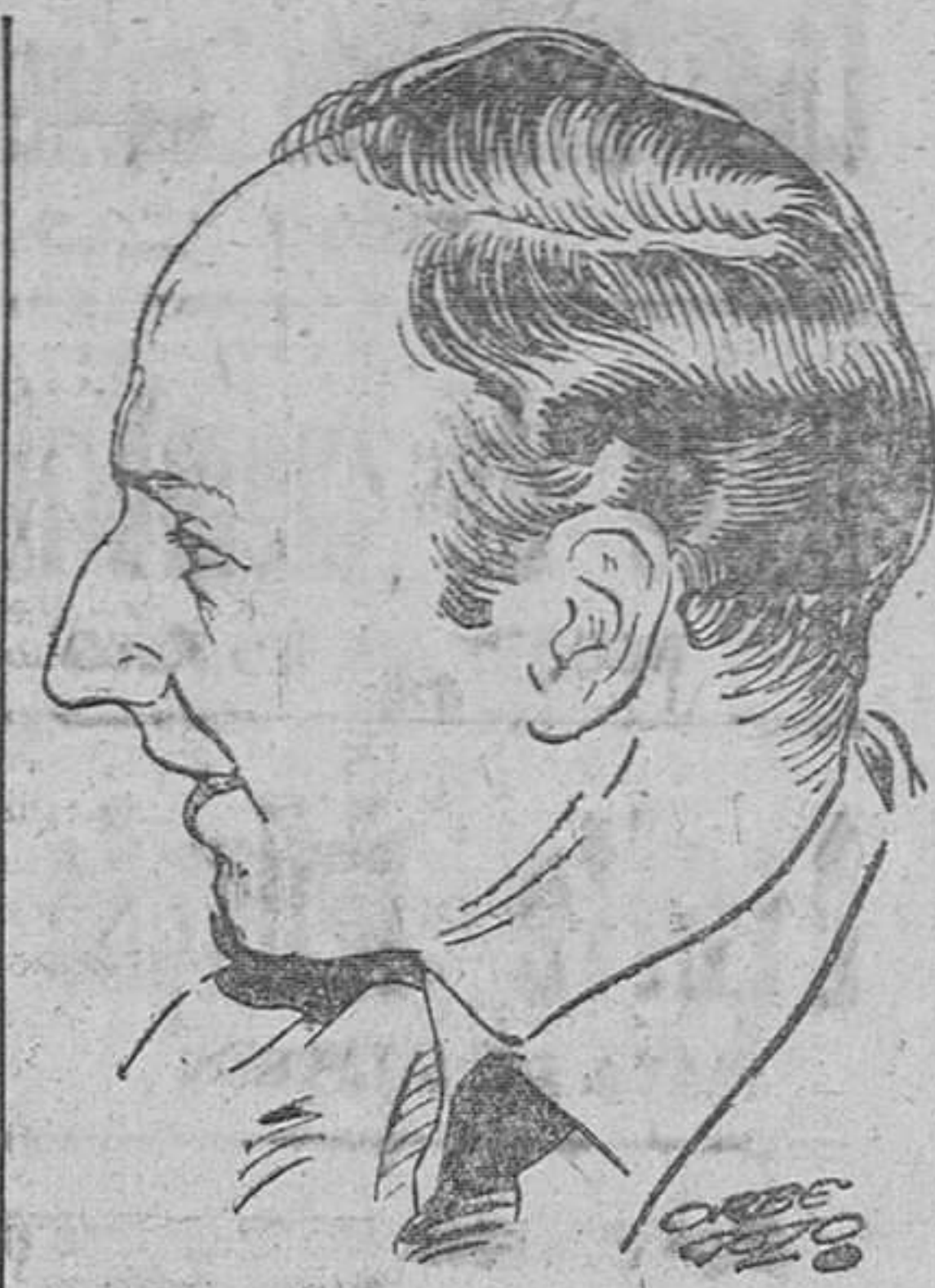
Hay que llevar a la juventud al teatro. Hay que hacer teatro para la juventud.

En el cine, el actor empezó por representar un papel de nada en «Mariona Rebull». Luego, ha interpretado muchas películas. Aparte de su retumbante éxito como protagonista de la versión cinematográfica de la vida de Ramón y Cajal, ha tenido victorias artísticas tan señaladas como las que le confirieron «La cárcel de cristales» o «Maribel y la extraña familia».