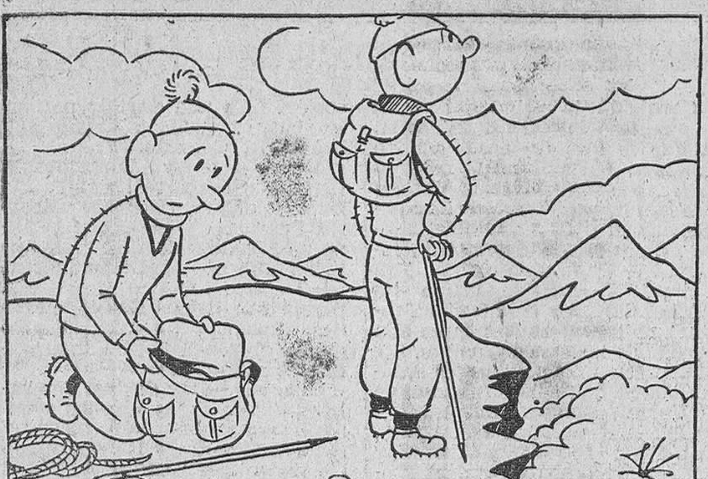
—Tómate todo el tiempo que quieras para admirar el paisaje; se me han olvidado los bocadillos.