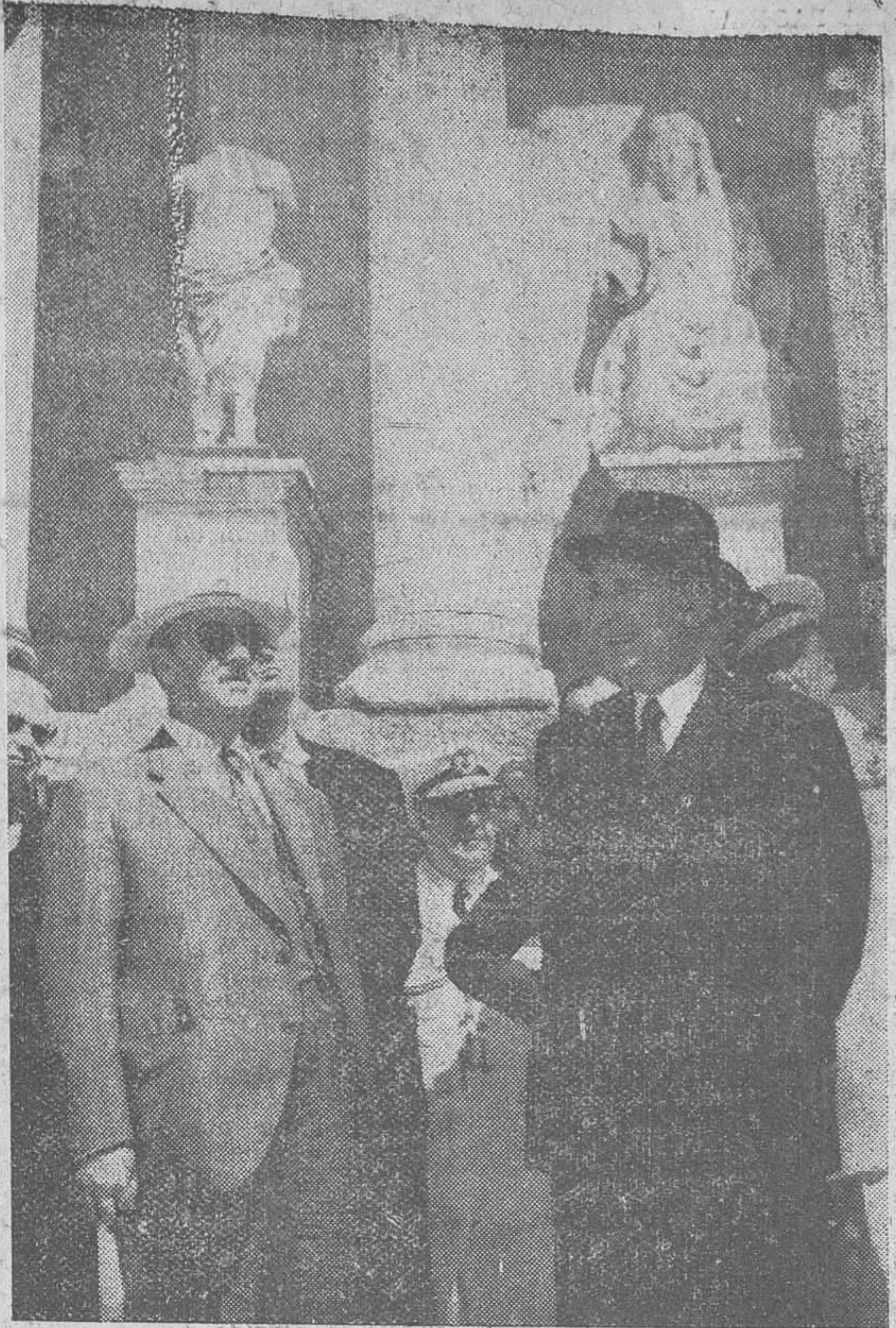
Mérida. — En un descanso de las conversaciones entre S. E. el Jefe del Estado español, Generalísimo Franco y S. E. el presidente del Consejo de ministros de Portugal, Dr. Salazar, los dos estadistas visitaron el Teatro Romano, donde fueron fotografiados.

Todos los miércoles, excepto cuando se halla de viaje, el Caudillo concede numerosas audiencias a personalidades civiles y militares, así como a otras muchas personas que a él acuden en demanda de ayuda y consejo. También hubo audiencias en los Pala-