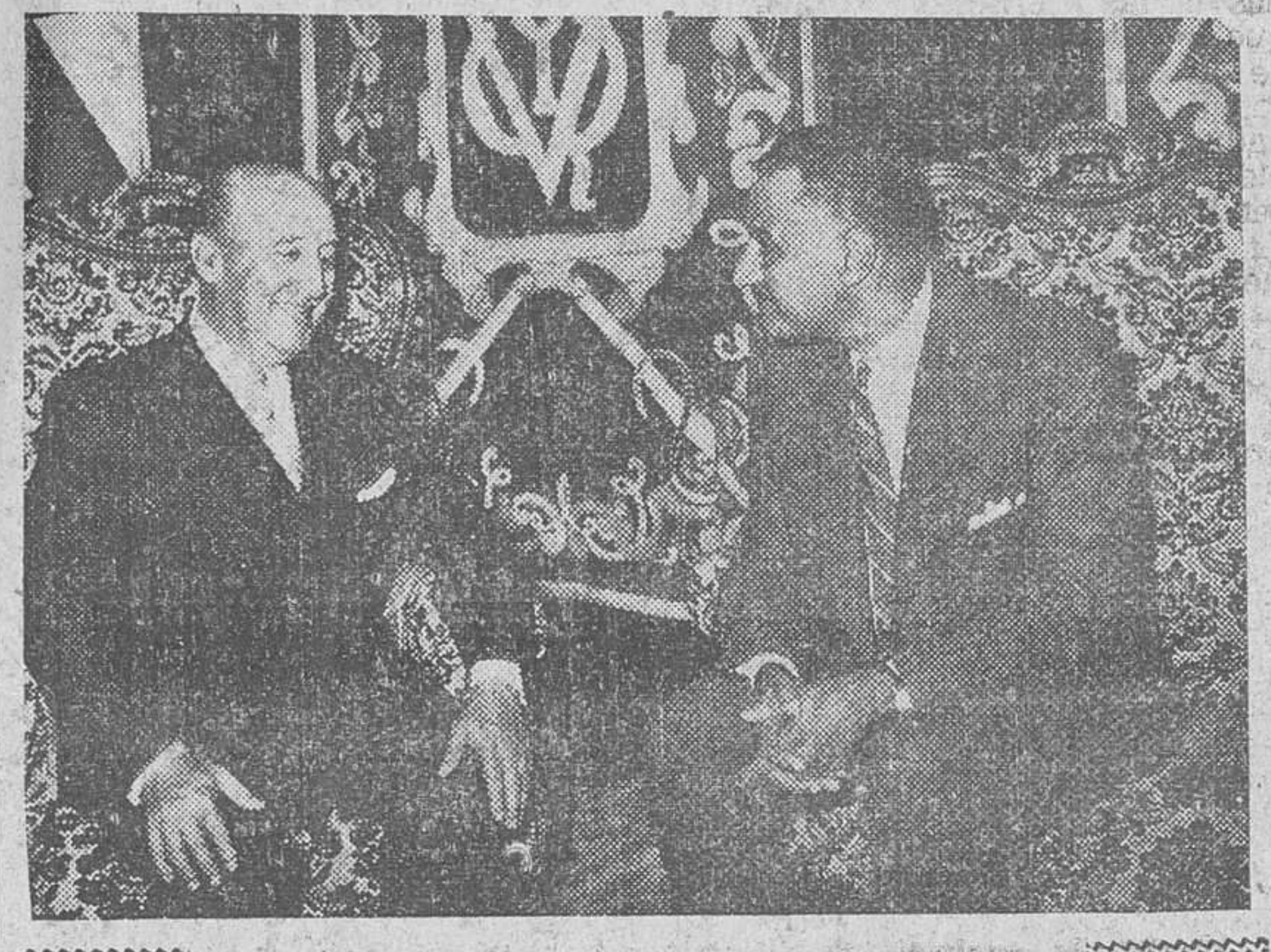
El presidente de la R. A. U. departiendo con S. E. el Jefe del Estado español.

En el palacio de Las Cabezas (Cáceres), el jefe del Estado se entrevistó con Su Alteza Real, el Conde de Barcelona. La entrevista se desarrolló en términos de gran cordialidad y fueron examinados temas importantes para la vida nacional.