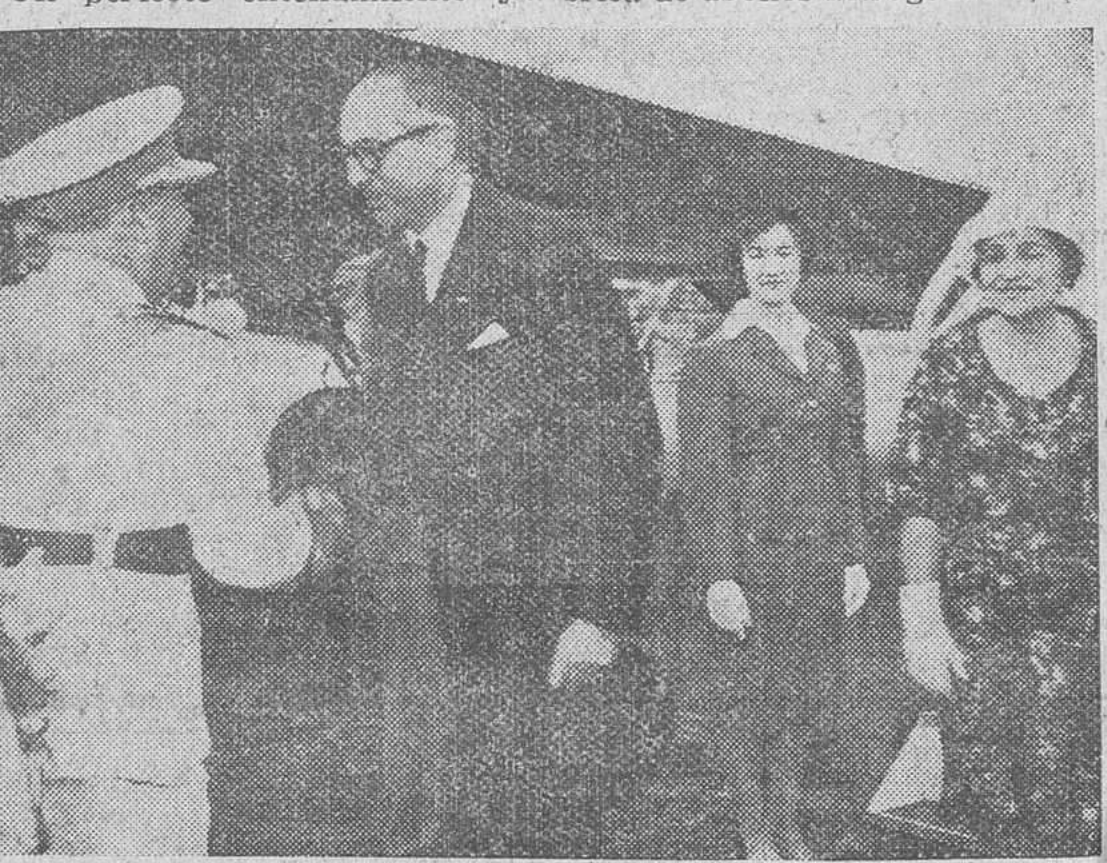
Llegada de Frondizi al aeropuerto de Barajas, donde el Caudillo le dió la bienvenida en nombre de todos los españoles.

do español, más de la mitad del tiempo que permaneció en Madrid. Procedía de El Cairo e hizo escala en el aeropuerto madrileño, de paso para Nueva York, a donde se dirigía para participar en la Asamblea General de la ONU. El tono de su estancia fue el de una constante cordialidad y simpatía, que culminó en el abrazo de despedida de ambos Jefes de Estado.