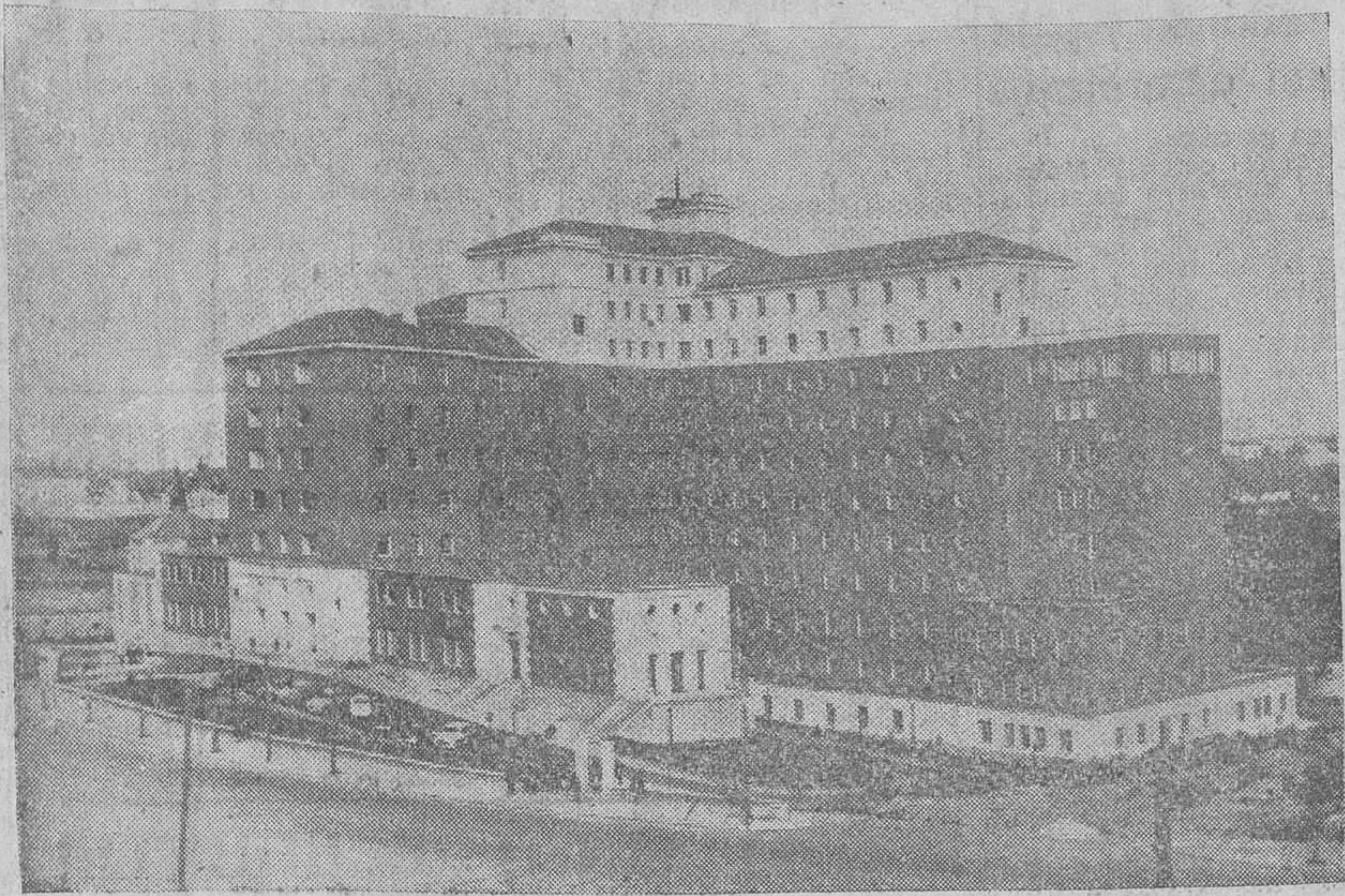
FACHADA PRINCIPAL DE LA RESIDENCIA "GENERAL YAGÜE", INAUGURADA POR EL CAUDILLO EN 25 DE JULIO.