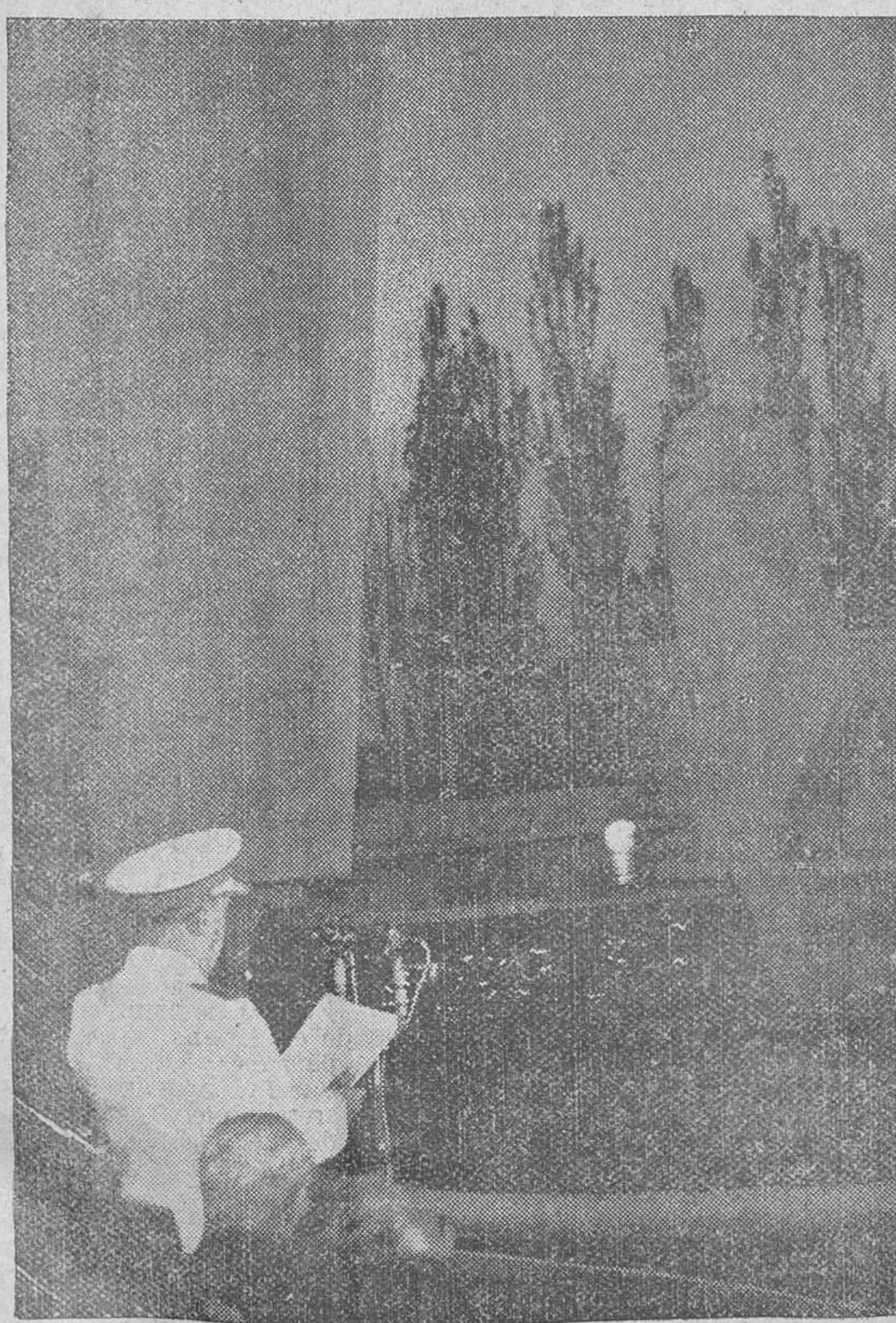
Madrid. — S. E. el Jefe del Estado durante el acto inaugural del monumento nacional a Don José Calvo Sotelo, levantado en la plaza de Castilla y con motivo de cumplirse el XXIV aniversario de su muerte.