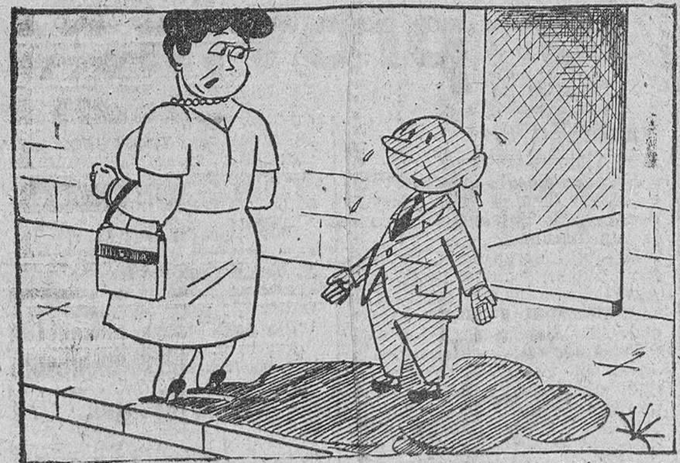
—No, señora, yo no la sigo; es que el Ayuntamiento taló todos los árboles de esta calle.

AUNQUE NO LE QUEPA EN SU CABEZA IBERIA le da MAS Por 14.980 0 ptas. (impuestos aparte) T-1200