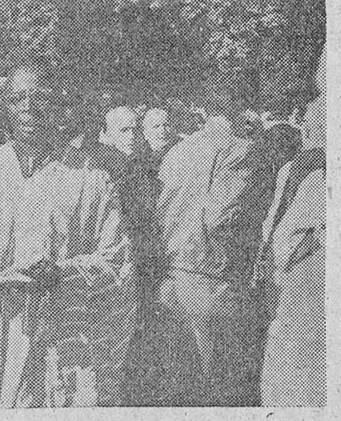
Los reportajes gráficos de "Fede" que no desaproveché ocasión de tirar placas y más placas...