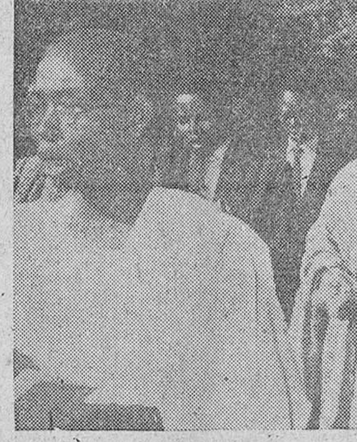
Como un testimonio de la Verdad ecuménica del catolicismo, en el mismo cortejo procesional en que formaba la peregrinación diocesana burgalesa...

cabaza y como siempre con nuestro Rvdm. Prelado que presidió también tal solemnidad, acaso la