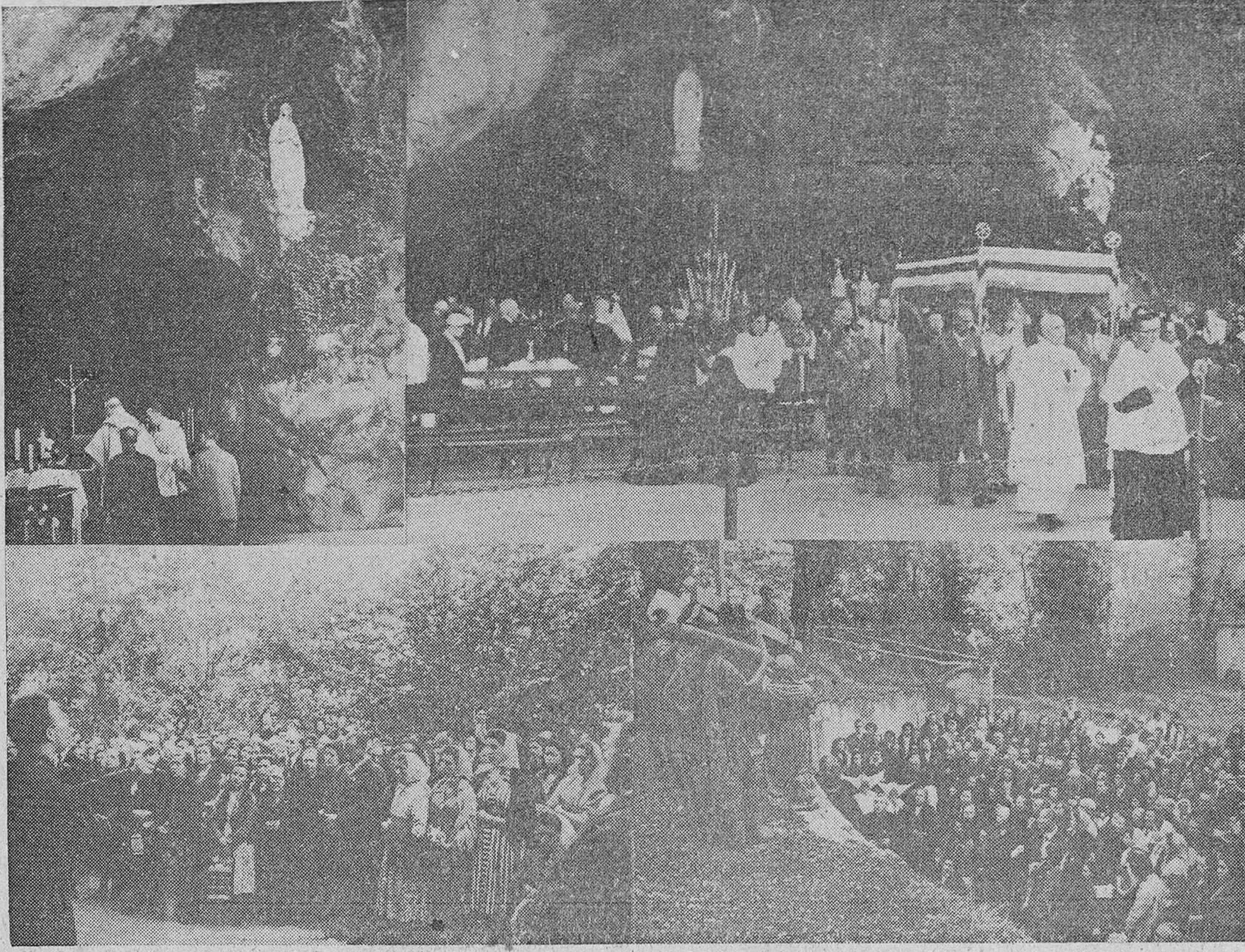
Cuatro documentos gráficos de la estancia de la II Peregrinación Diocesana burgalesa en Lourdes. En la parte superior, a la izquierda, nuestro Rvdm. Prelado...