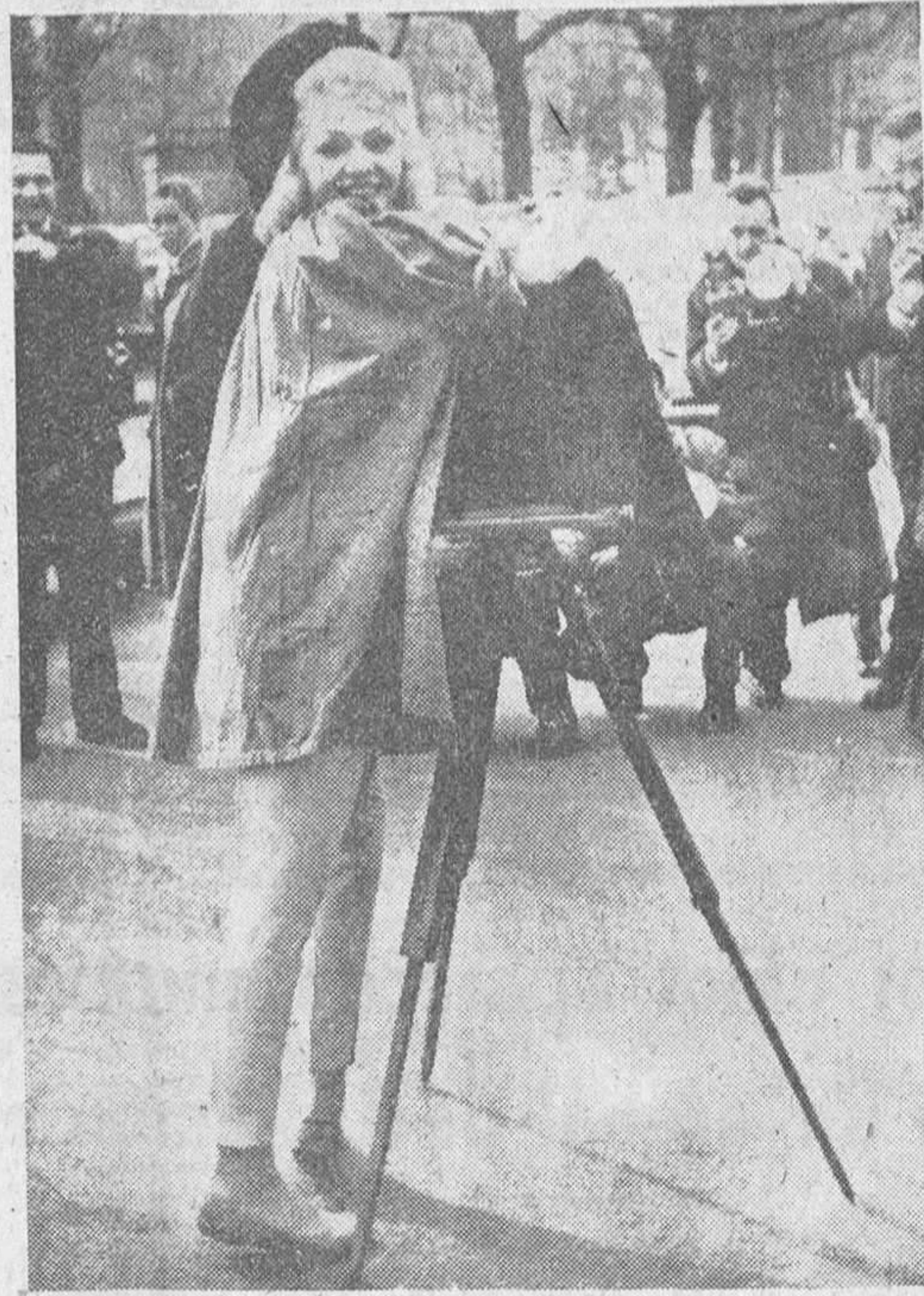
Ha comenzado en Paris el XXIV Salón de la Fotografía. La madrina es la rubia actriz Vera Valmont, que se ha disfrazado de original fotografa con una vieja cámara de los tiempos de Daguerre. En la foto la vemos "ametrallada" por unos modernos fotógrafos, que la admiran en su profesión.