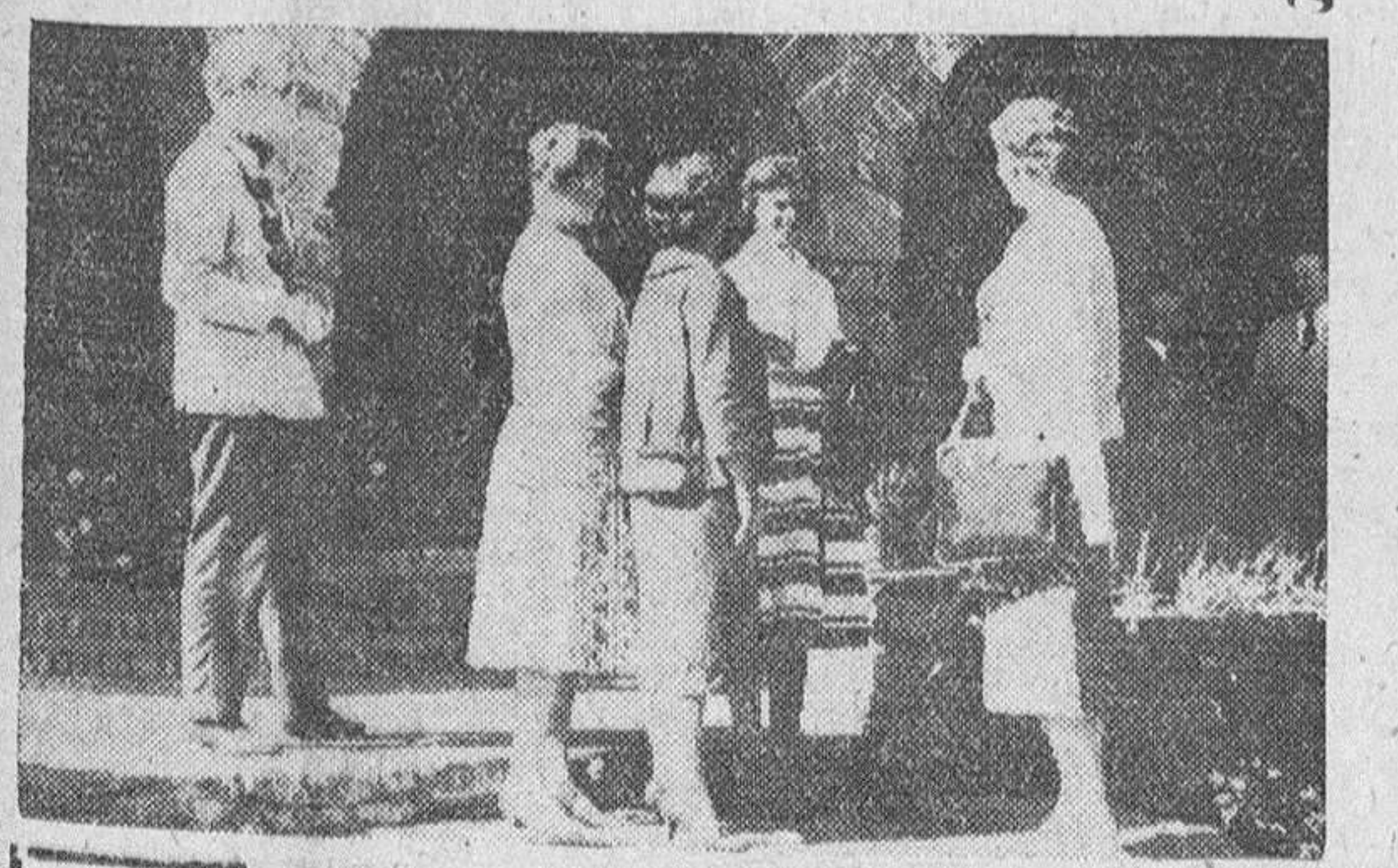
Málaga.—La Princesa Margarita y sus acompañantes, abandonan la hostería del castillo de Gibralfaro, en esta capital, para regresar a Torremolinos. — (Foto Cifra)