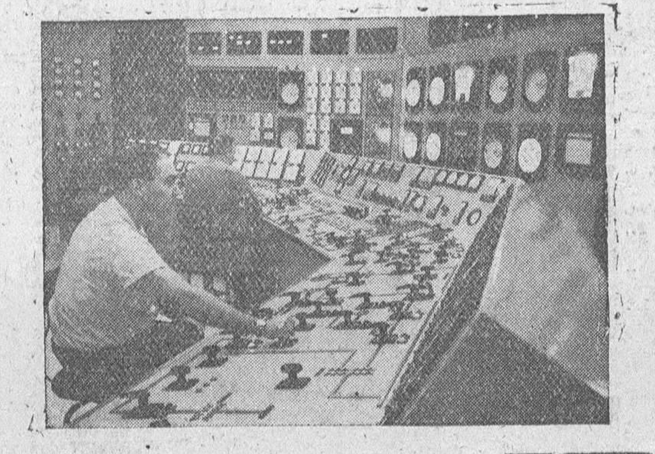
El centro que gobierna la explotación para usos pacíficos de la energía atómica es esta complicada sala de mandos, instalada en la central atómica de Shippingport (EE. UU.). Todo el manejo del reactor nuclear, su instalación complementaria y el turbo-generator, lo realizan estos tres operadores que se ven sentados ante los cuadros de mandos. La central atómica de Shippingport ha sido desarrollada juntamente por la Westinghouse Electric Corporation, la Comisión de Energía Atómica y la Duquesne Light Company de Pittsburg (Pensilvania).