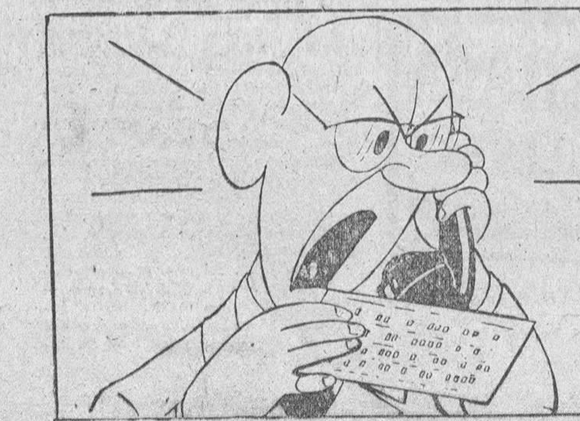
—¿Es la Compañía de electricidad?... ¡llamo para protestar! — ¡En el recibo hay un agujero mal puesto!