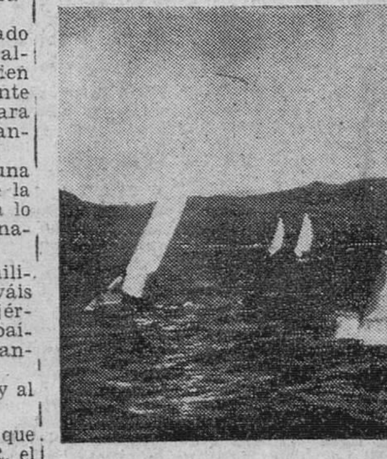
Vigo.—Los "snipes" que se disputan el Campeonato de Galicia de esta especialidad, maniobrando en la bahía de Vigo durante las pruebas.