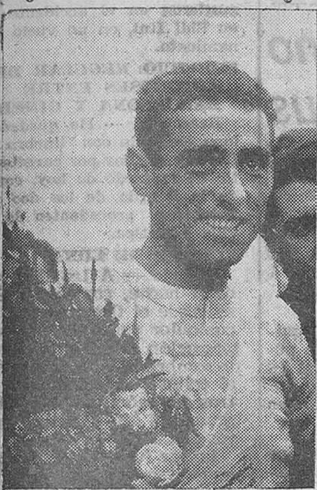
Bilbao. — El gran corredor Loroño, del equipo nacional español, vencedor en la Vuelta Ciclista a España 1957, con el jersey amarillo, símbolo del líder y el ramo de flores que se entrega a los vencedores, en la meta de Bilbao.

Suárez triunfó en la última etapa, corrida toda ella, bajo constante tromba de agua