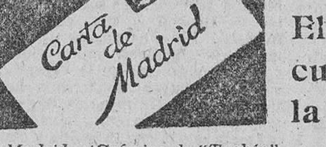
Madrid. (Crónica de "Tachin" exclusiva para DIARIO DE BURGOS).

Hoy han fenecido las colas de automovilistas en los surtidores de gasolina. Se han agotado. Y en gasolina, se han agotado, porque esta mañana los encargados de llenar los depósitos se han dado a la manivela sin un momento de descanso. Esta ha sido la respuesta a los alarmistas, que se habían remojado las barbas ante las noticias provenientes de Inglaterra y de Francia. Hasta el momento, la verdad es que no ha habido fundamento alguno para el acaparamiento, que ha desequilibrado el mercado en Madrid. Los mismos automovilistas pues, han creado una situación que en realidad carecía de razón; inopinadamente se presentaron ante los surtidores a fin de comprar la mayor cantidad posible de gasolina, para almacenarla en los garajes, en los domicilios —son el consistente pellico— en cualquier parte con tal de atribuirse a sí mismo los calificativos de previosores, talentosos y millines. Conquistaron así terminar en cuarenta y ocho horas con todas las reservas de Madrid, alarmar a la CAMPESA y hacerla traer combustible a la capital desde diversos puntos de España, desahasteciéndolos. No ha estado mal, por lo tanto, la respuesta a los acaparadores que soñaban con pingües e inesperadas ganancias. Esta es la impresión casi unánime: que no ha habido motivo de alarma y que no lo habrá. Por ahora no faltará la gasolina, reina de los líquidos, con perdón de los dipsomános sea dicho.