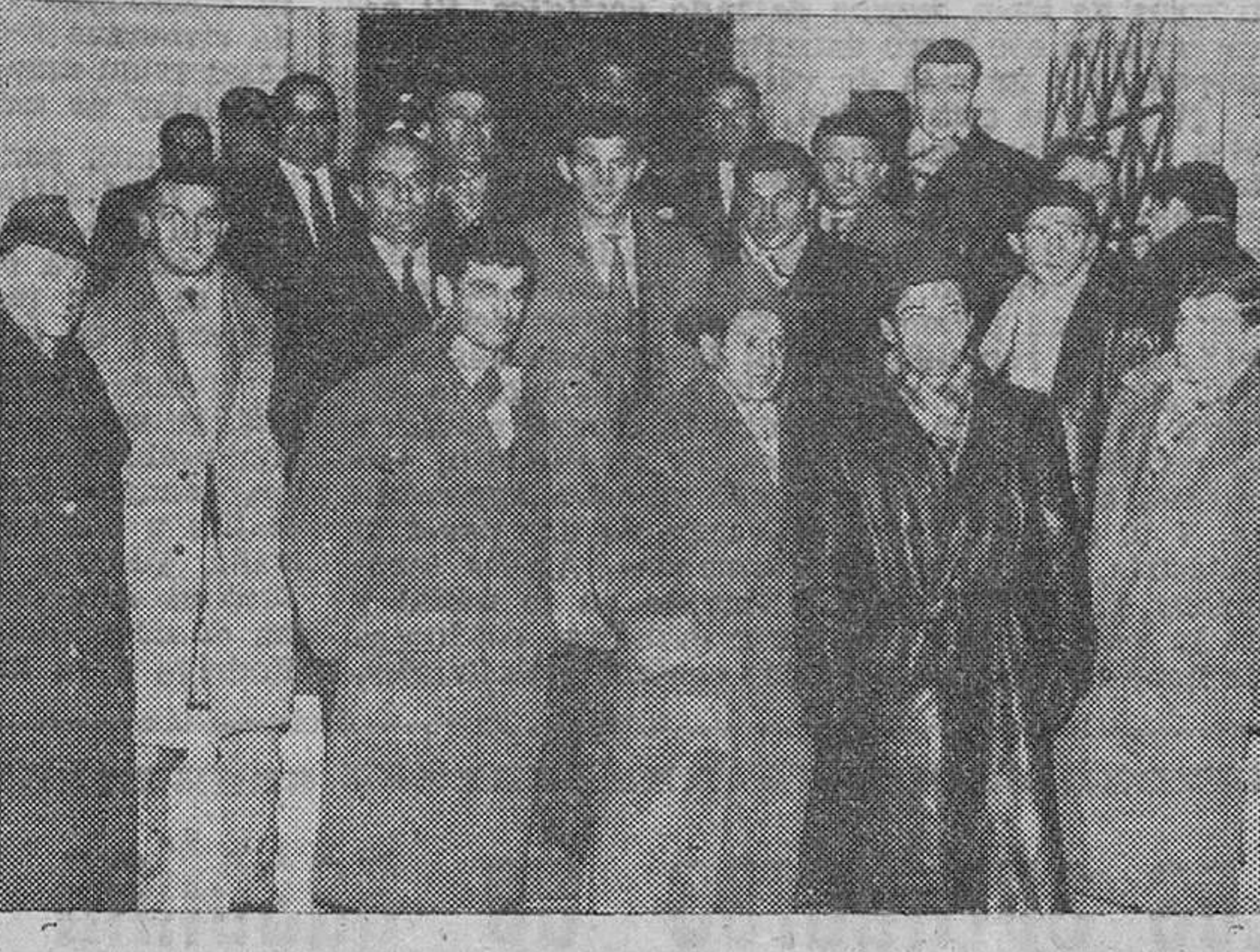
San Sebastián. — Los jugadores y directivos del Honved a su llegada al hotel de esta capital donde se hospedaban con vistas a su partido contra el Atlético de Bilbao.

Bilbao. — En San Mamés, con un lleno impresionante, que sobrepasaba las cuarenta mil personas, se jugó la primera eliminatoria de Europa, entre el Atlético de Bilbao y el Honved, de Hungría. Terminó con la victoria de los bilbaínos por tres tantos a dos. Lograron los goles del Atlético, Arceche, Marcaida y Arieta y, por los húngaros, Budai y Kocsis.