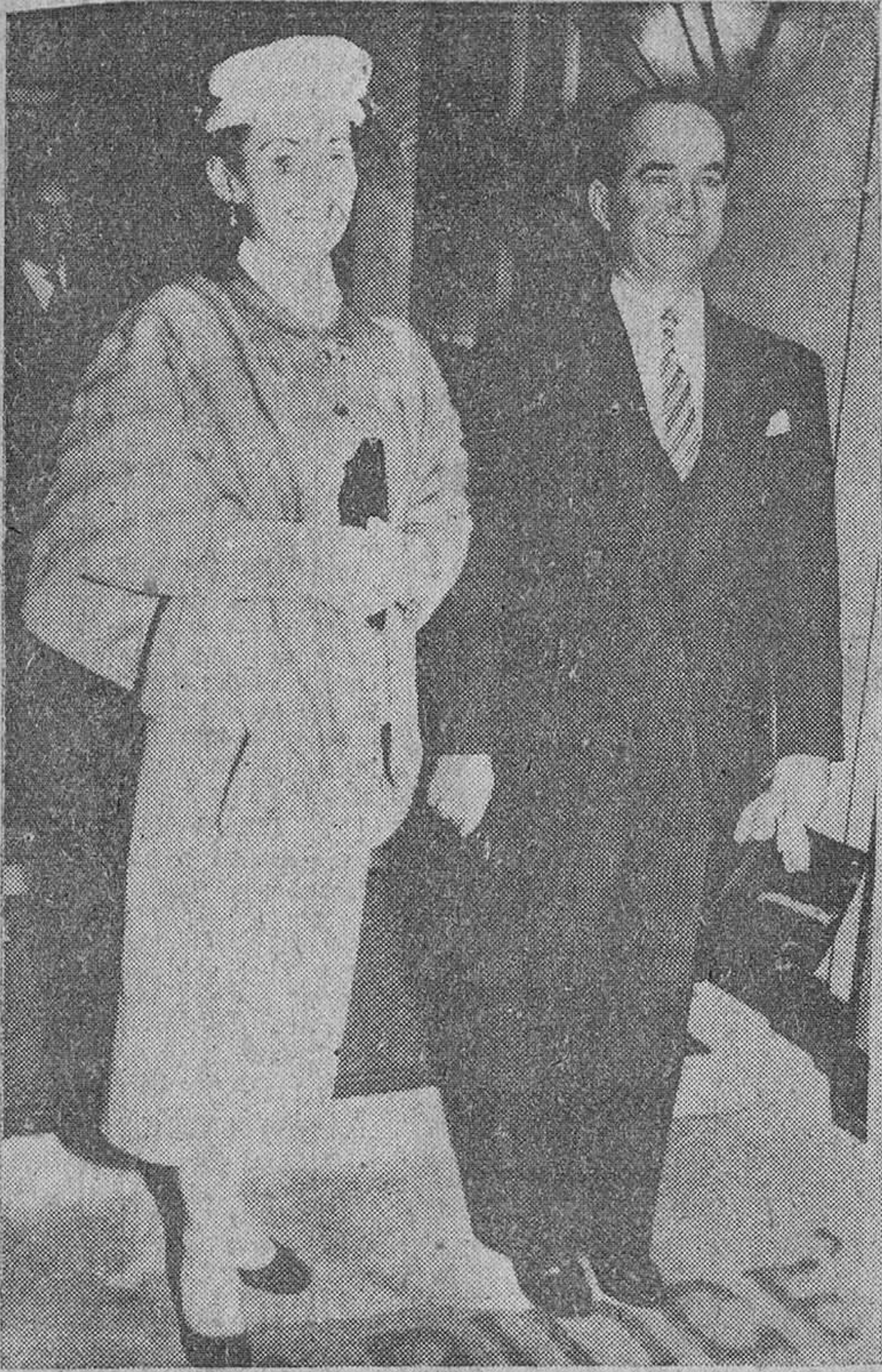
El presidente de Costa Rica, con su esposa, que ayer llegaron a Madrid, fotografiados días pasados en Londres.

Fueron recibidos en Barajas por el Caudillo con doña Carmen Polo de Franco, Gobierno en pleno y altas jerarquías de la Nación