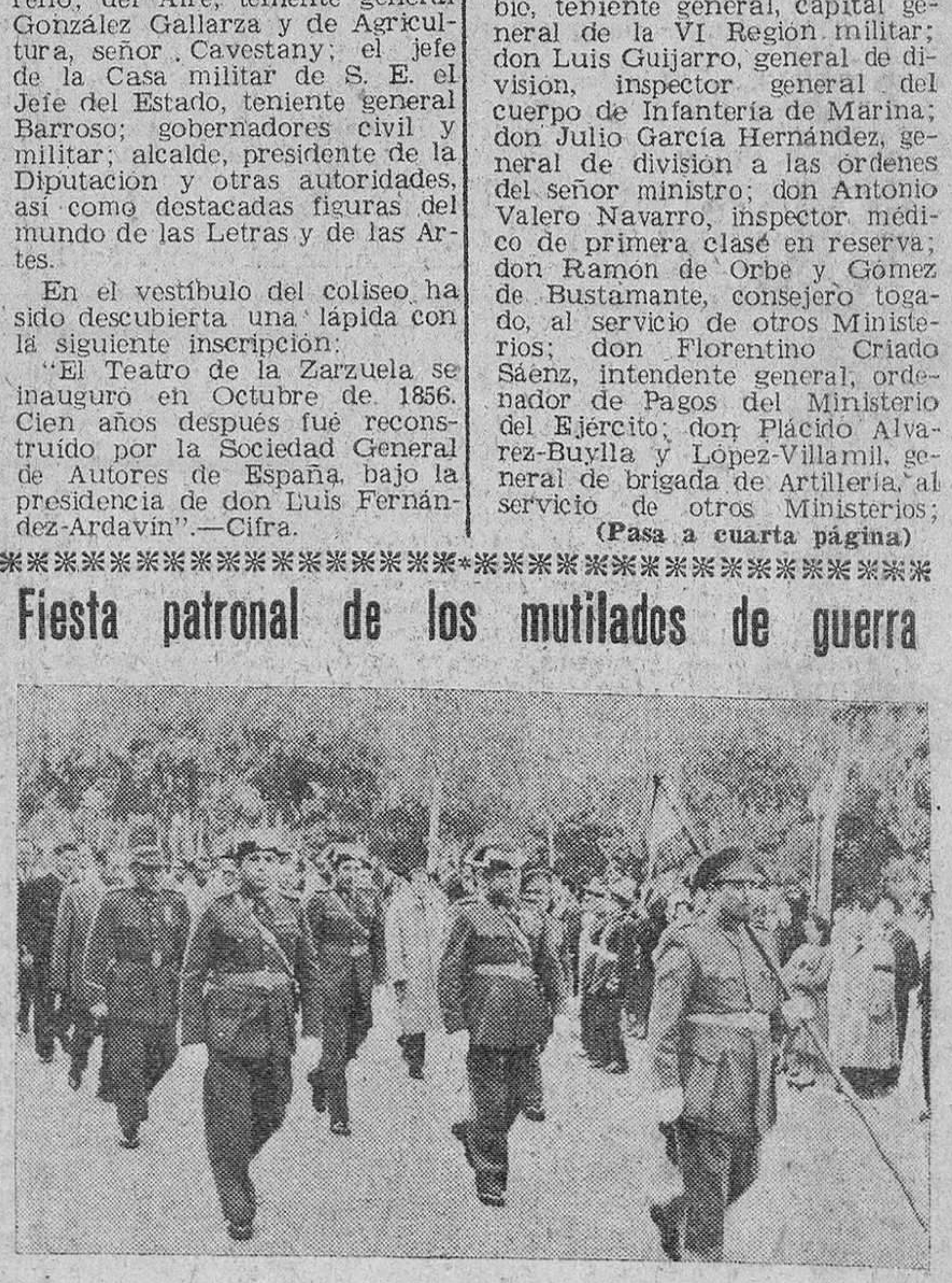
Ayer miércoles, festividad del Arcángel San Rafael, celebraron su fiesta patronal los mutilados de guerra por la Patria, un grupo de los cuales aparece, desfilando ante las autoridades, después de asistir a la misa que tuvo lugar en la iglesia de la Merced.