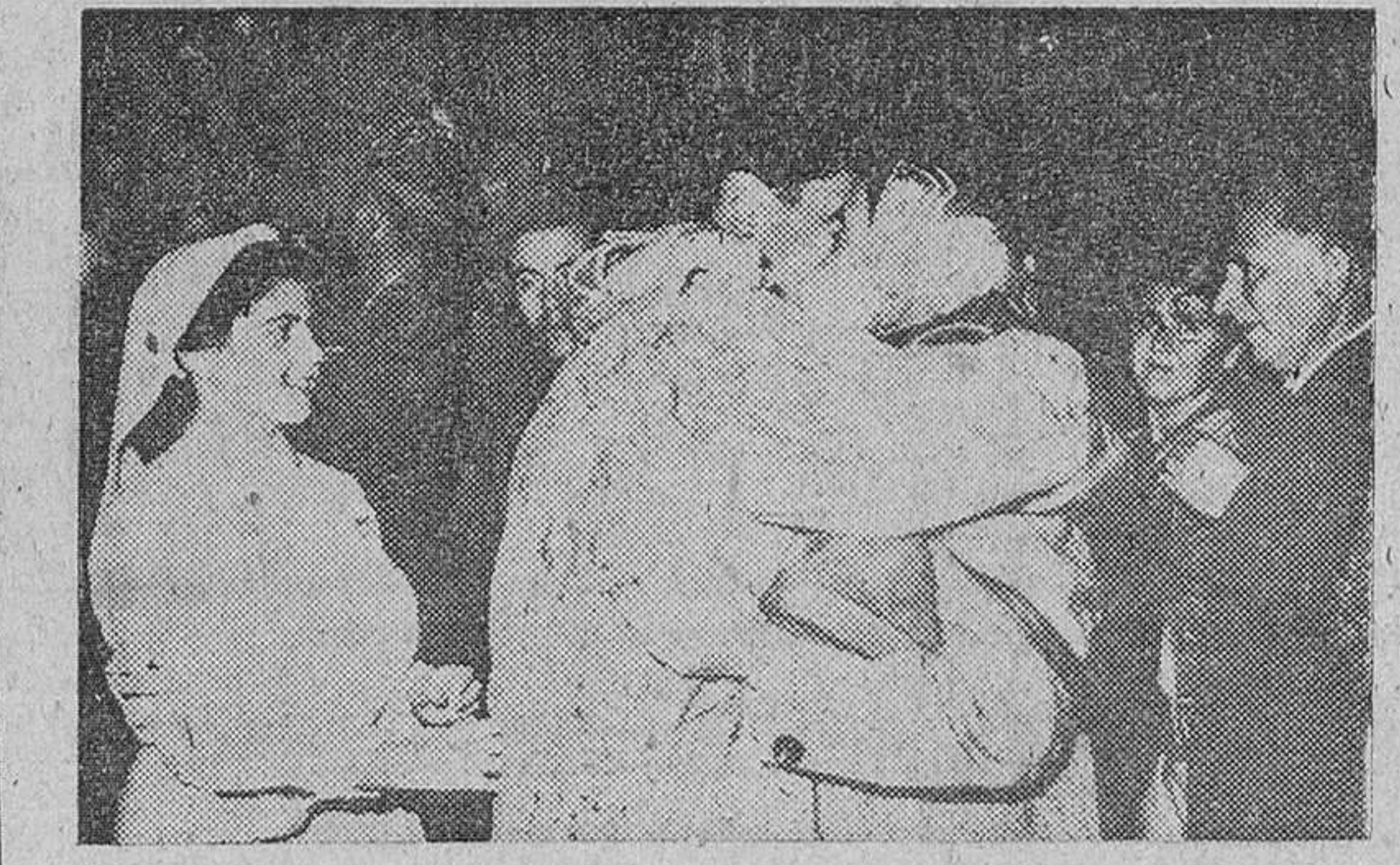
Valencia. — Una de las muchas escenas de emoción que se produjeron al desembarcar los repatriados españoles. Uno de ellos abraza a su madre que le esperaba en el puerto de Valencia.