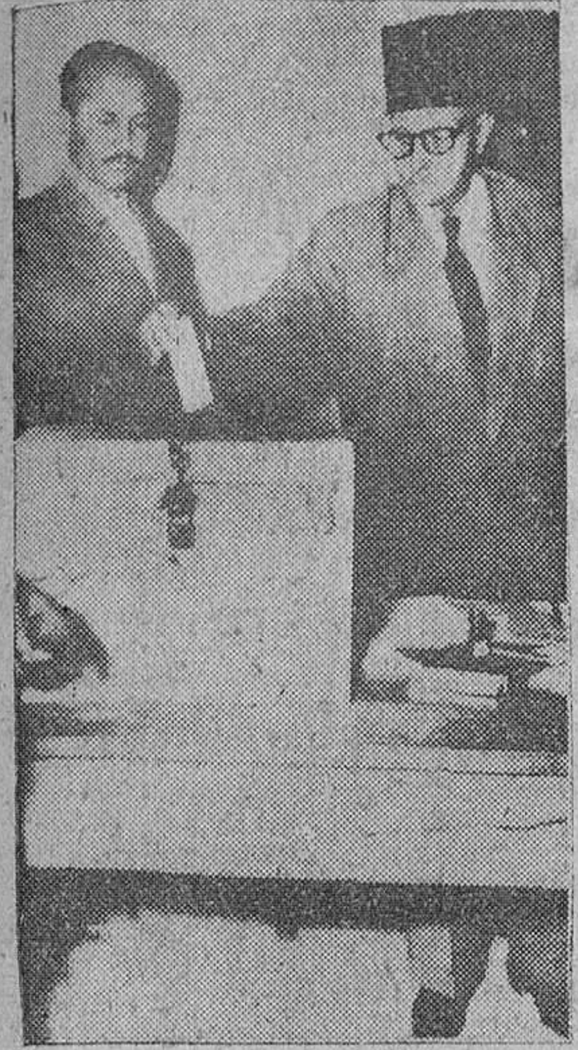
Amman. — El primer ministro Ibrahim Hashen en el momento de depositar su voto en uno de los colegios electorales, con motivo de las elecciones celebradas para elegir a los diputados del nuevo Parlamento jordano.

Las tropas rusas, cuya intervención pidió el Gobierno, combaten contra los rebeldes en Budapest, empleando tanques y aviación. Ha sido repuesto Nagy, quien promete grandes reformas políticas, solicitando el fin de la revuelta. Pese a los llamamientos hechos y a la dura represión, la lucha continuaba ayer por la noche.