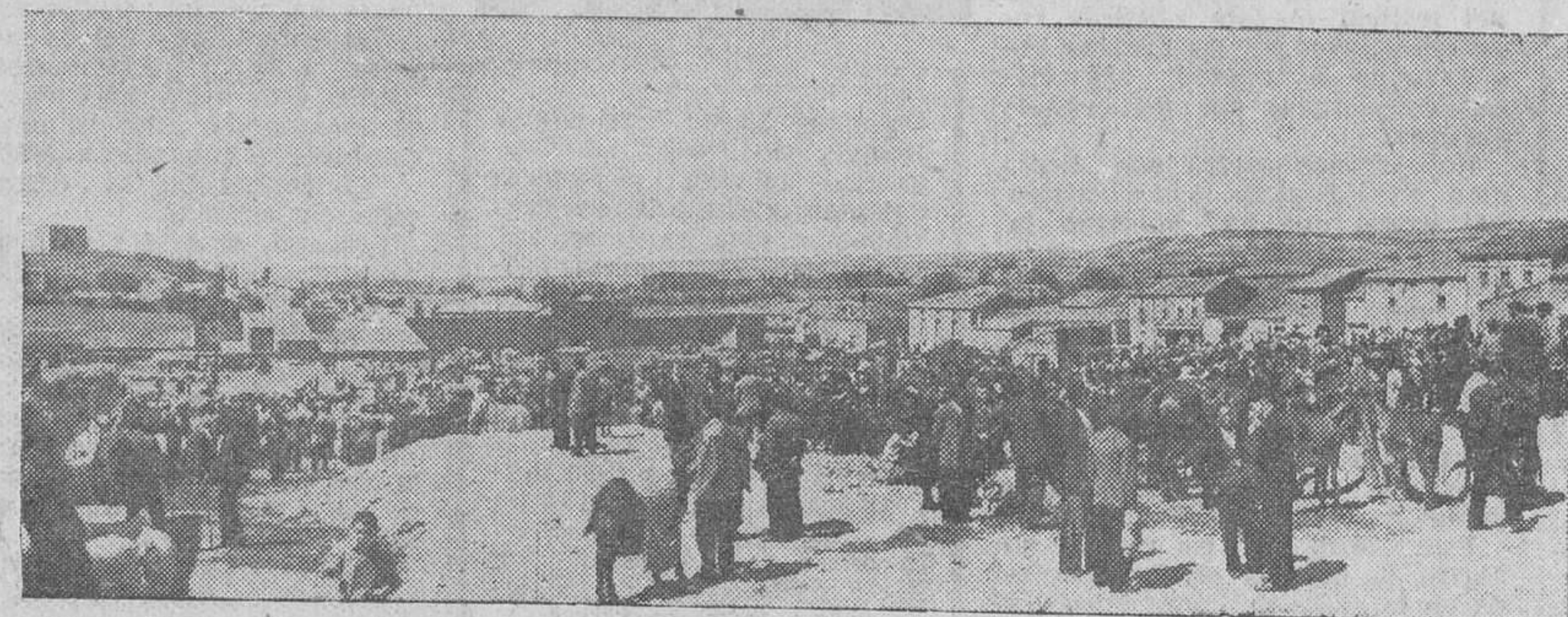
PANORAMICA DEL MERCADO DURANTE LAS FAMOSAS FERIAS DE SAN MATEO.

Desde luego ya es sabido que el problema vital que Pampliega tiene planteado es el del alcantarillado. Pues bien: ahí se concentran las preocupaciones y los anhelos del propio Municipio, juntamente con la construcción de un almacén granero, de tanto interés para los agricultores y campesinos.