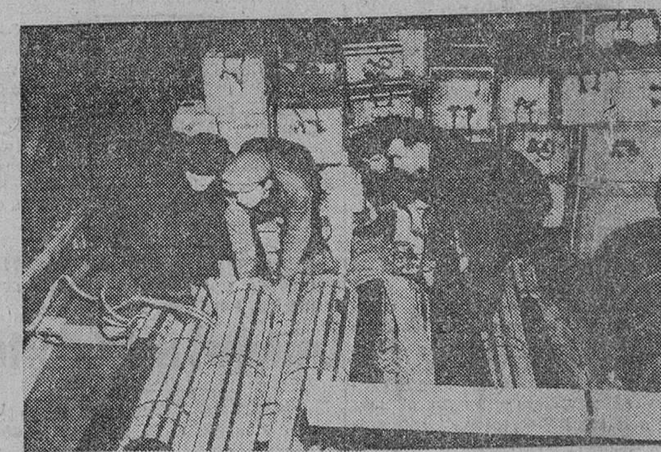
Liverpool.—Obreros del puerto de esta ciudad durante el cargamento de una partida de armas en el barco "Estrella de Suez" consignadas a diversos países del Oriente Medio. Con motivo de estos envíos, el jefe del partido laborista, Mr. Gaiskell, visitó al primer ministro británico, Mr. Eden, en su residencia oficial de Downing Street.