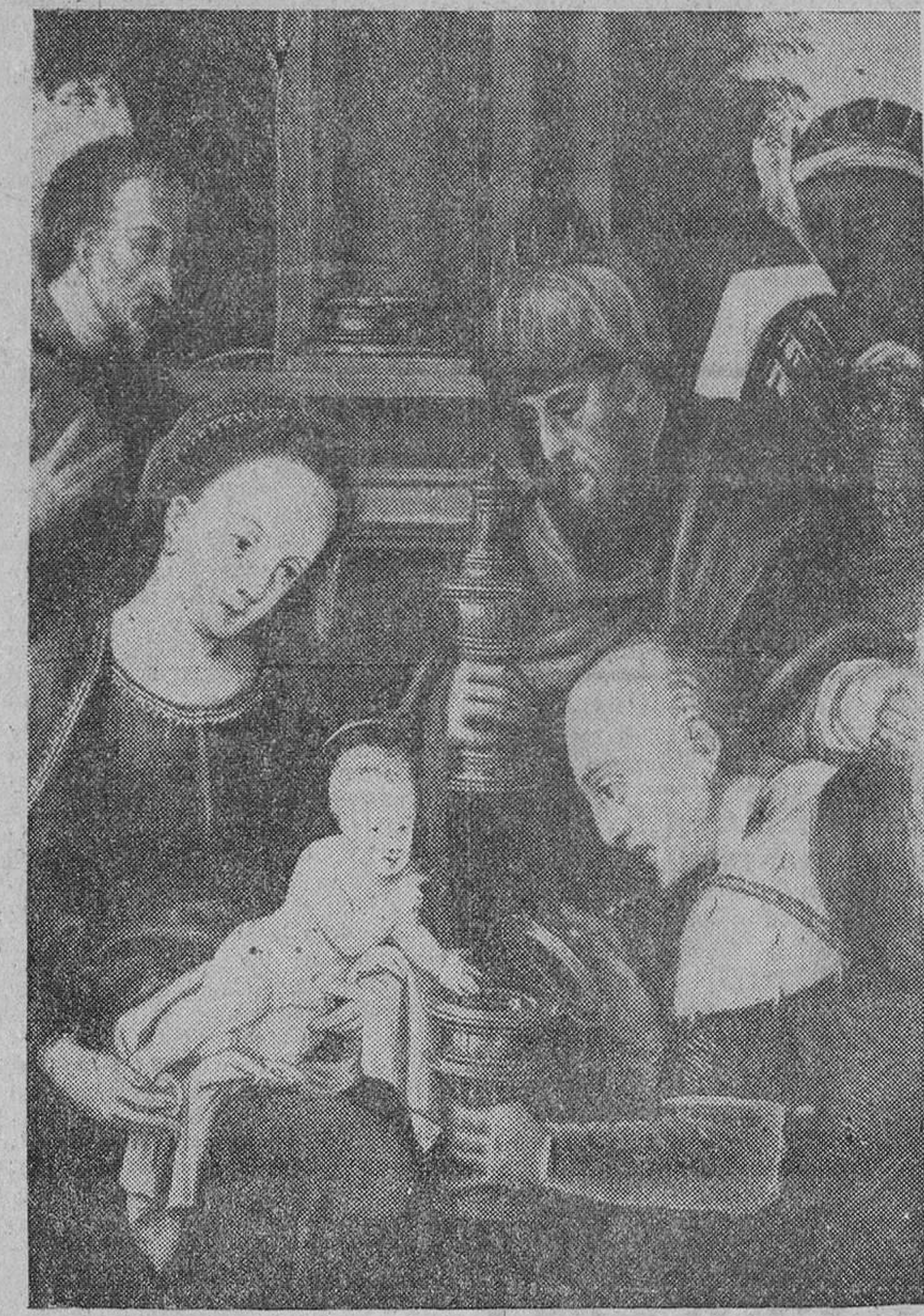
Tabla castellana del siglo XVI.

El Niño Jesús acepta la ofrenda del primer Rey arrodillado, en tanto los otros permanecen en pie con sus ciruelas. La ornamentación del fondo, las vestiduras y los recipientes de los dones, indican que esta tabla pertenece al repocamiento italiano del siglo XVI.