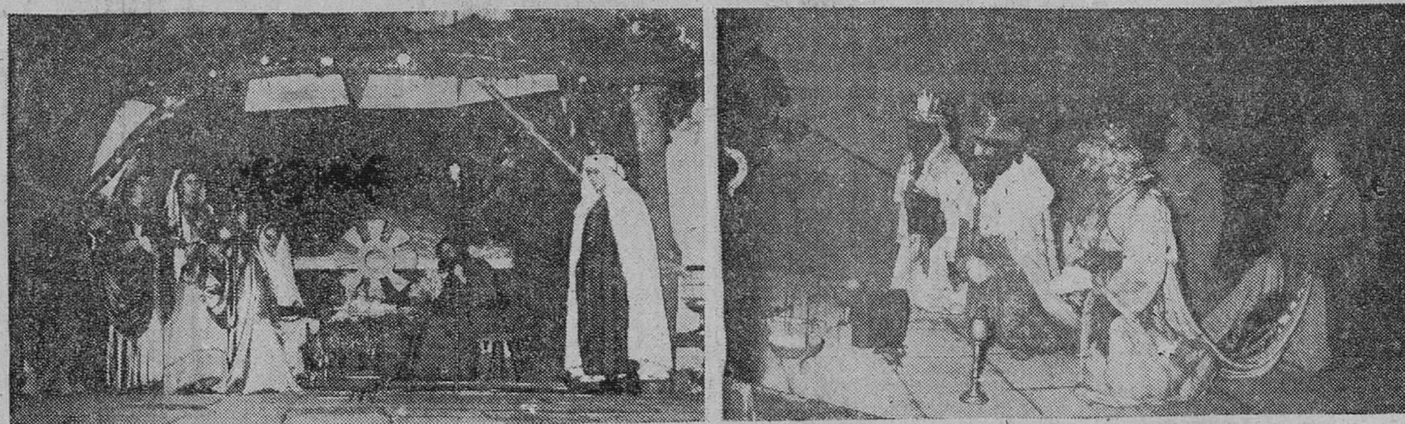
Anoche recorrió las calles burgalesas la cabalgata de los Reyes Magos, llegados de Oriente con su mágico cortejo de ilusión y copioso cargamento de juguetes. En primer lugar un detalle del desfile de la comitiva y a continuación los regios soberanos presidiendo adoración al Niño Jesús en el "portal de Belén" establecido en la escalinata del Sarmental.