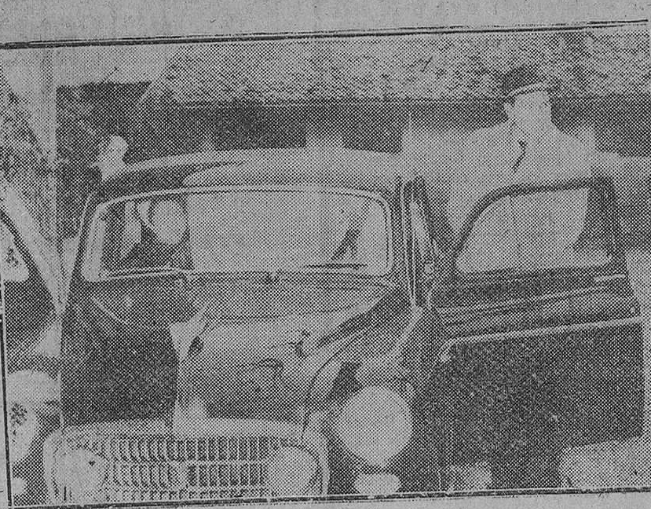
Zurich. — Los príncipes María Pia de Saboya y Alejandro de Yugoslavia, en el momento de emprender viaje a Cascais (Portugal), donde dentro de pocos días contraerán matrimonio.