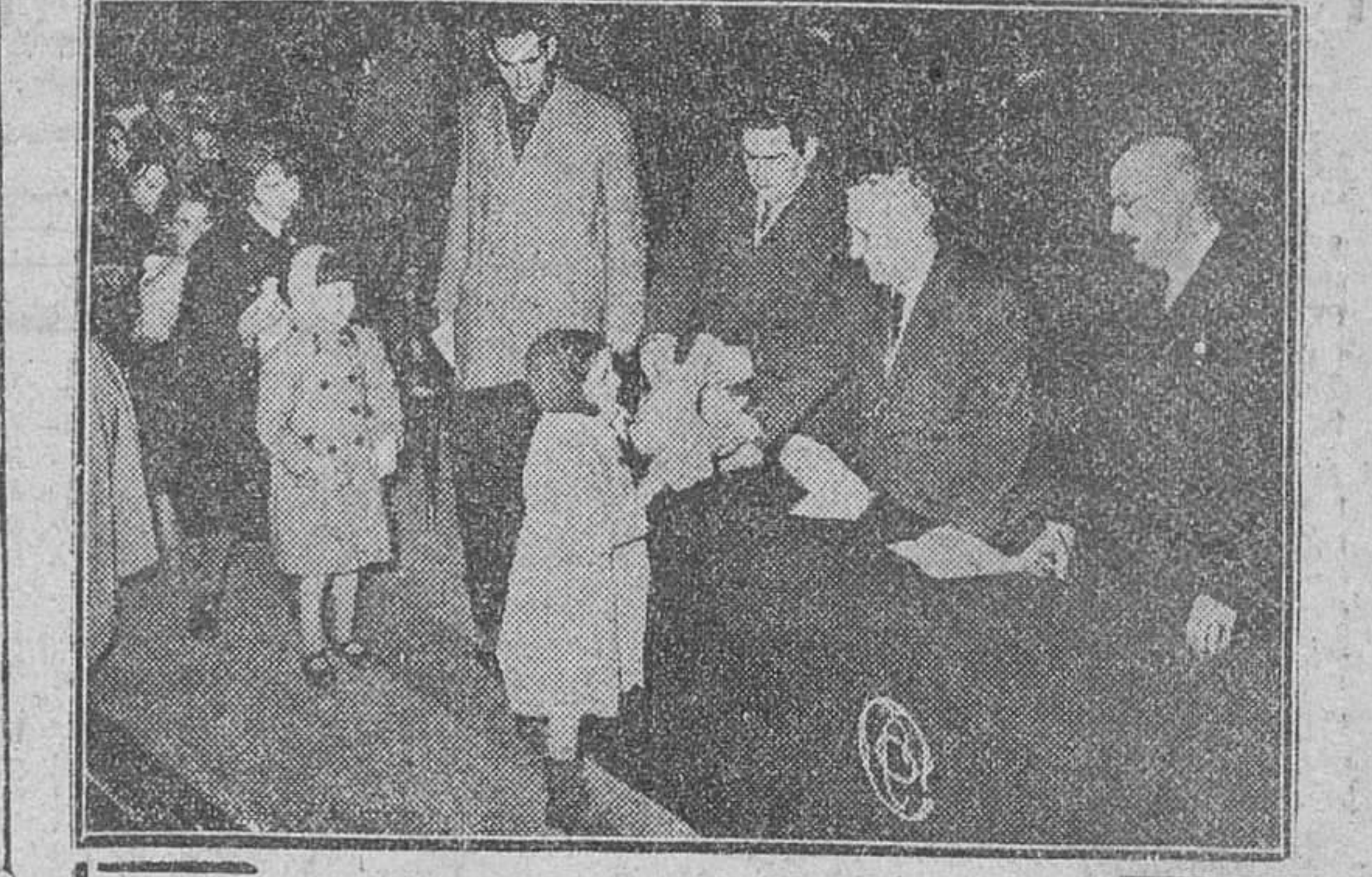
El presidente del Consejo de Gobierno de la Caja de Ahorros y monte de Piedad del Círculo Católico de Obreros, acompañado de otros consejeros y del director-gerente de dicha entidad, entregando los agüinaldos navideños a los niños que asisten a las escuelas sostenidas por el Círculo.