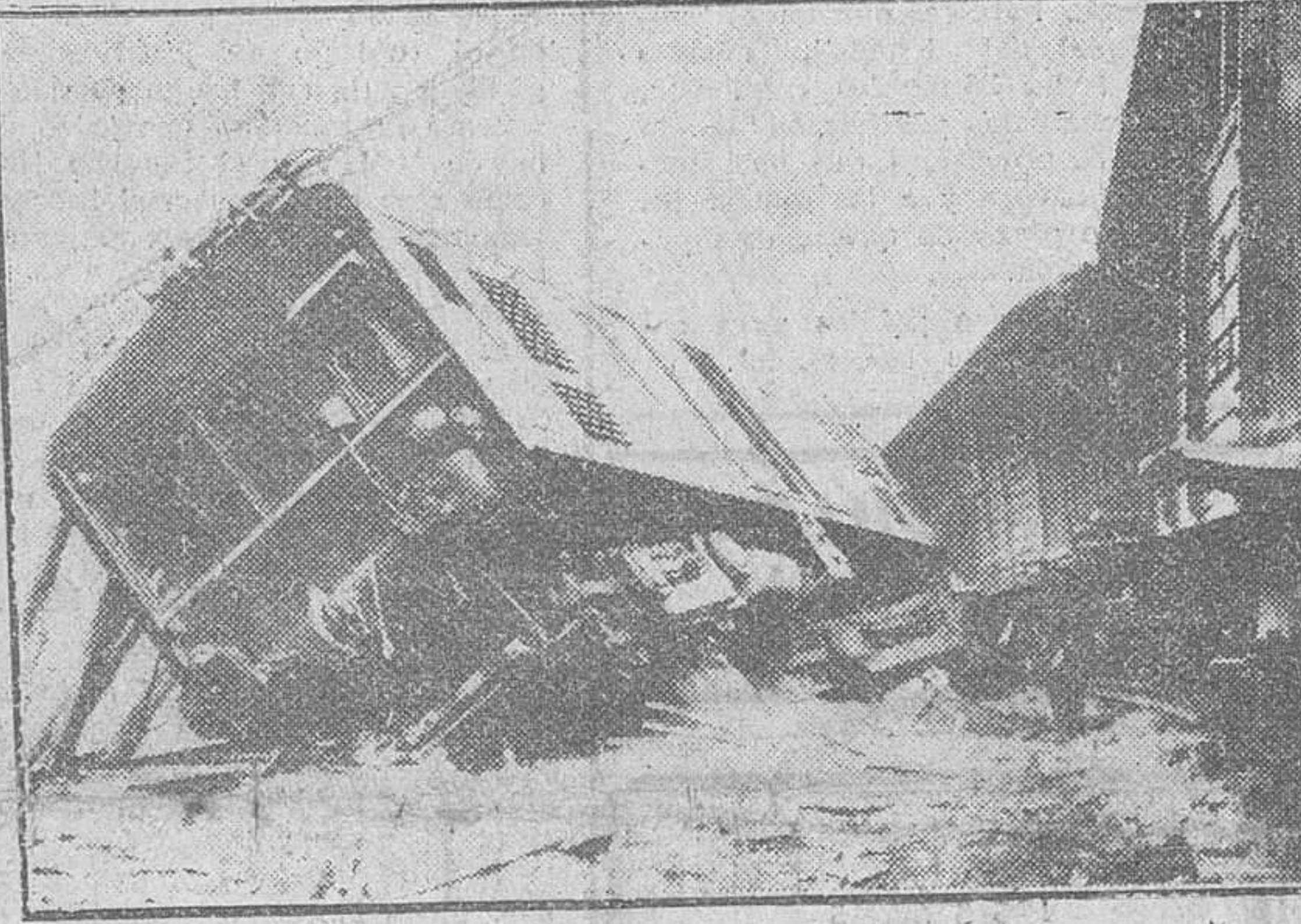
Bilbao. — Estado en que quedaron la locomotora y algunos de los coches del tren de viajeros, que descarriló entre Sestao y Ortuella, accidente en el que hubo que lamentar 21 heridos, varios de ellos graves.