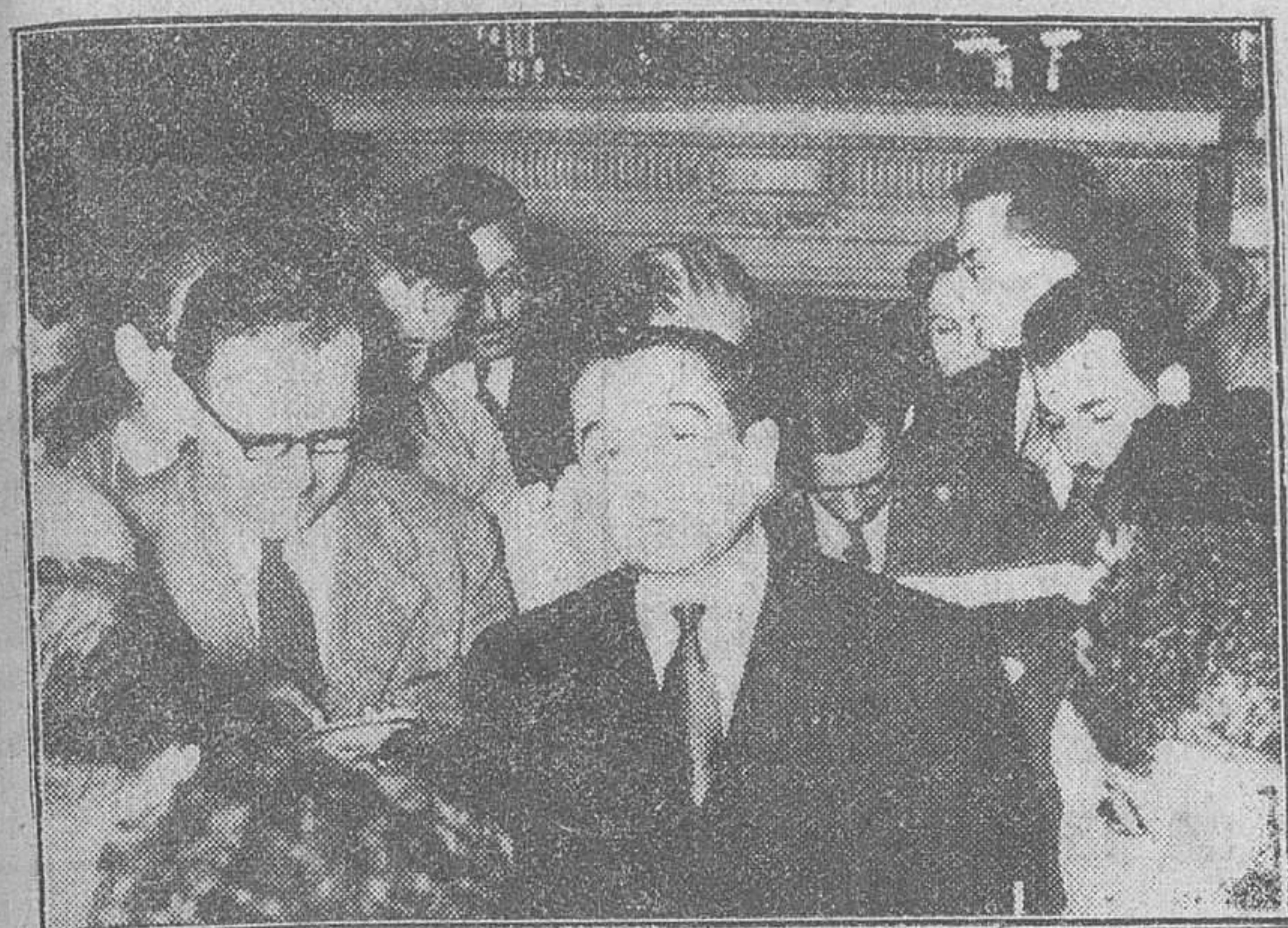
Paris. — El jefe del Gobierno francés, Mendes-France, conversando con los periodistas, antes de comenzar el debate en la Asamblea, sobre la Comunidad Europea de Defensa.

La negativa francesa -dice el secretario norteamericano- obliga a Estados Unidos a revisar su política exterior