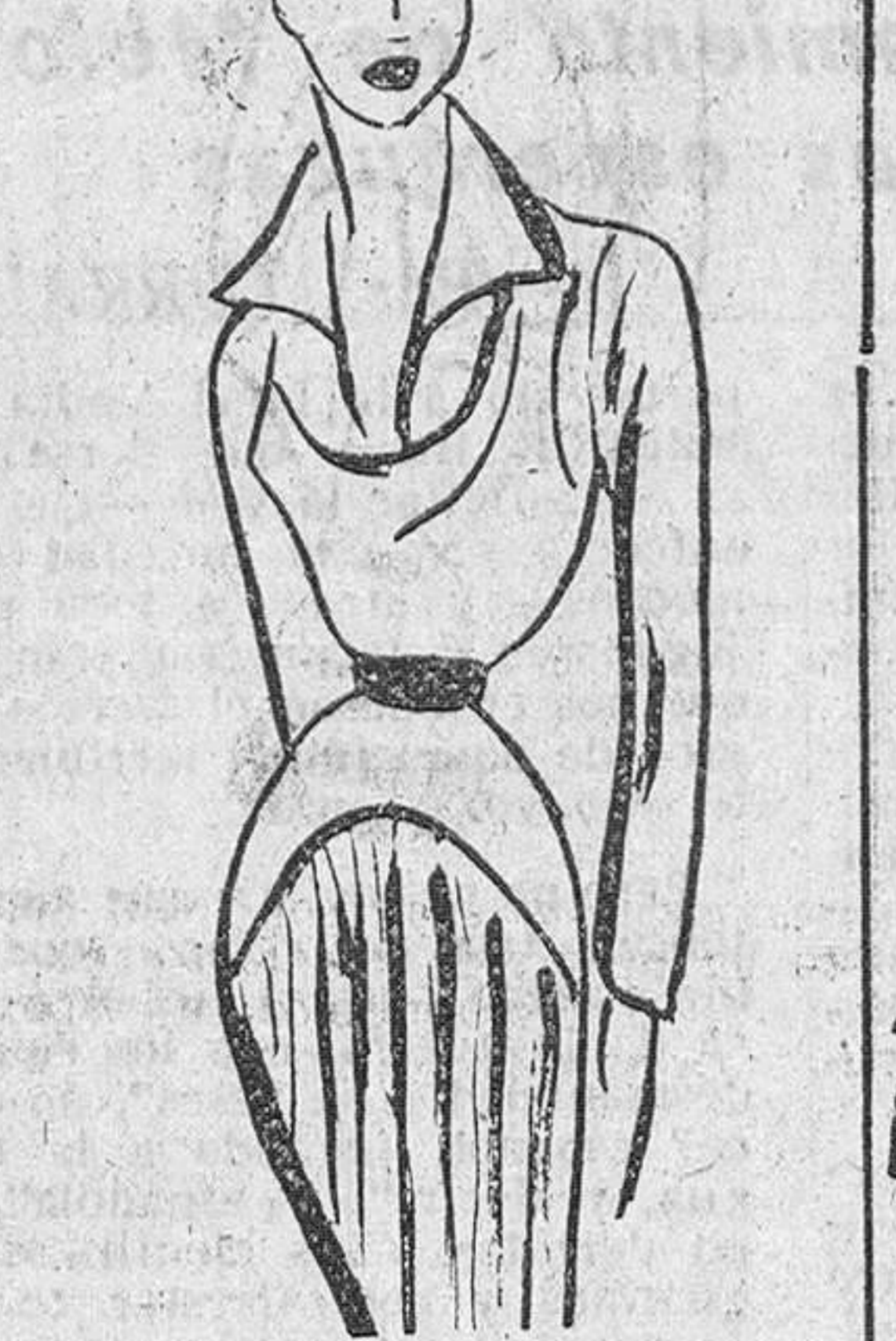
También he visto un vestido de popelina de algodón azul marino, llevado con un gorrito y una echarpe de cretona de fondo blanco con flores multicolores. Y un vestido sastré de popelina azul pastel, completado por un capotier, unos guantes, y un pañuelo de organdi amarillo limón.

Incuso los vestidos estilo sastré se hacen en estos materiales, y resultan en extremo juveniles y favorecedores.