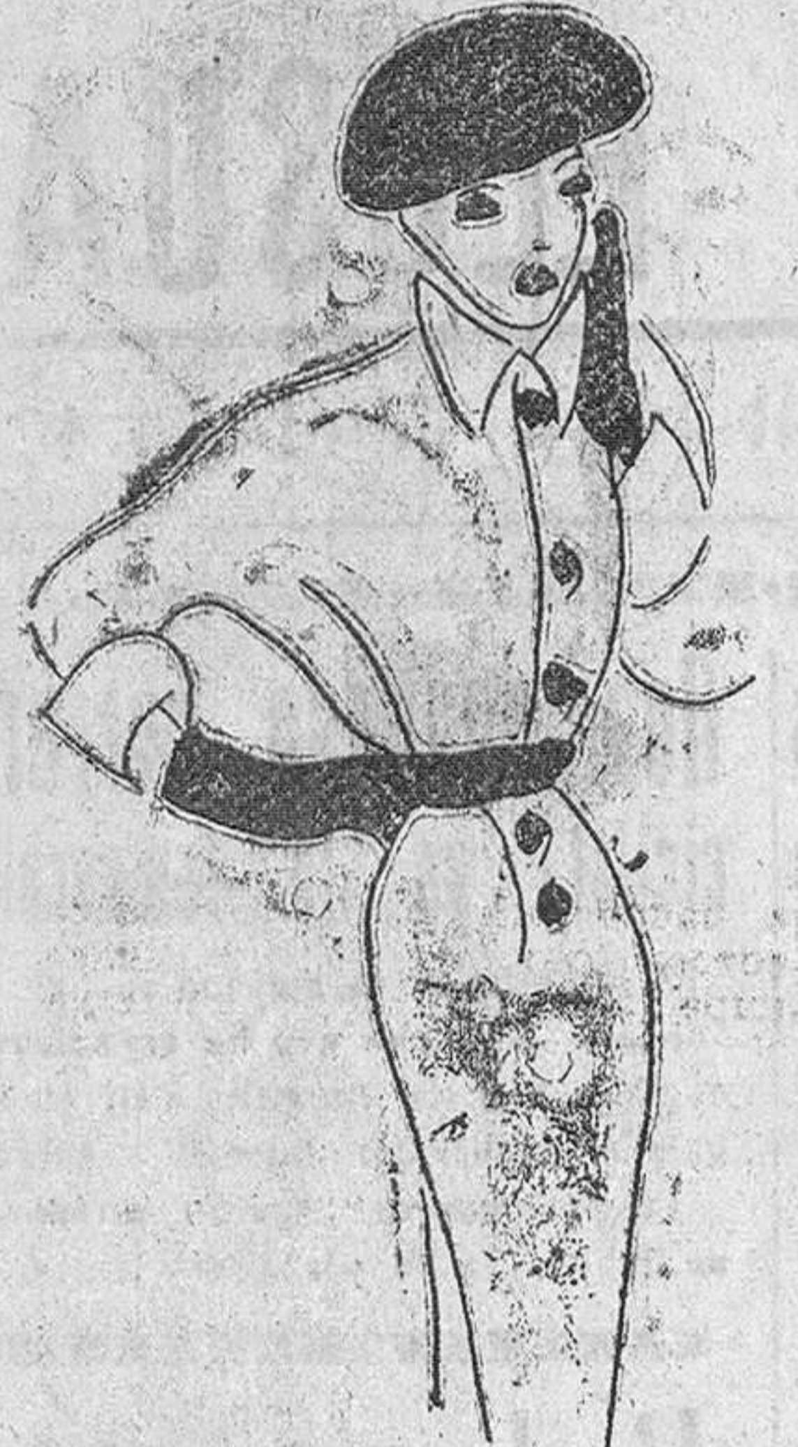
Vestido de tafetán en beige y caramelo. Creación Gres.

Con estos ejemplos tan elocuentes, a ver si todavía hay quien siendo amante del ferrocarril puede sostener que el directo Madrid-Burgos perjudicará el ingreso de la RENFE; a ver si viéndolo tan claro se transforman en ardientes defensores de su pronta terminación y toda la pasividad que hasta ahora tuvieron se convierte en actividad efectiva y no tengamos que recordar a nuestro gran Benavente con sus "Intereses Creados" y su "Ciudad alegre y confluente".