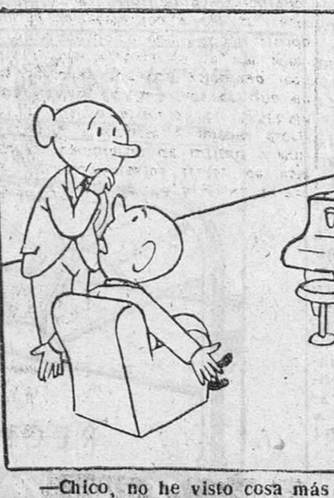
-Chico, no he visto cosa más aburrida que un "solo de piano".