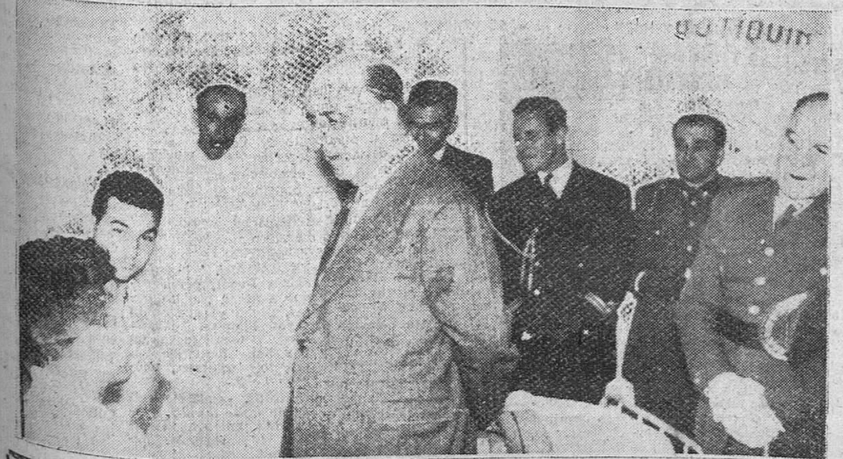
Alicantes. — El ministro de Marina, almirante Moré, acompañado de las autoridades de esta Región Militar, conversando con dos de los marinos supervivientes del dragaminas "Guadalete", hospitalizados en el Hospital Militar de esta ciudad.