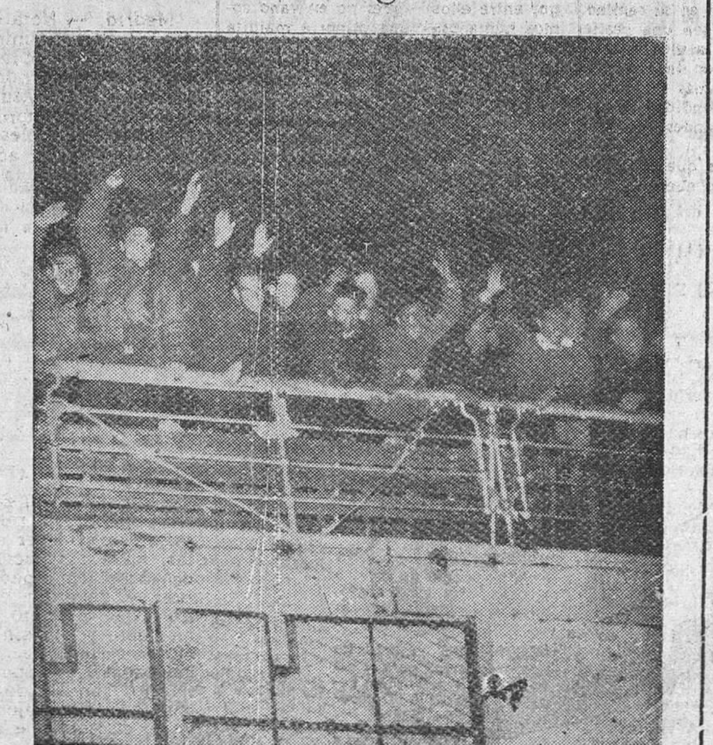
Estambul. — Desde la cubierta del "Semiramis" un grupo de los españoles repatriados de Rusia, manifiestan su alegría, a su llegada a este puerto, donde fueron recibidos por los representantes del Gobierno y la Cruz Roja española.

Los que ahora llegan cumplieron su deber; los demás, en nombre de la Patria agradecida, cumpliremos el nuestro.