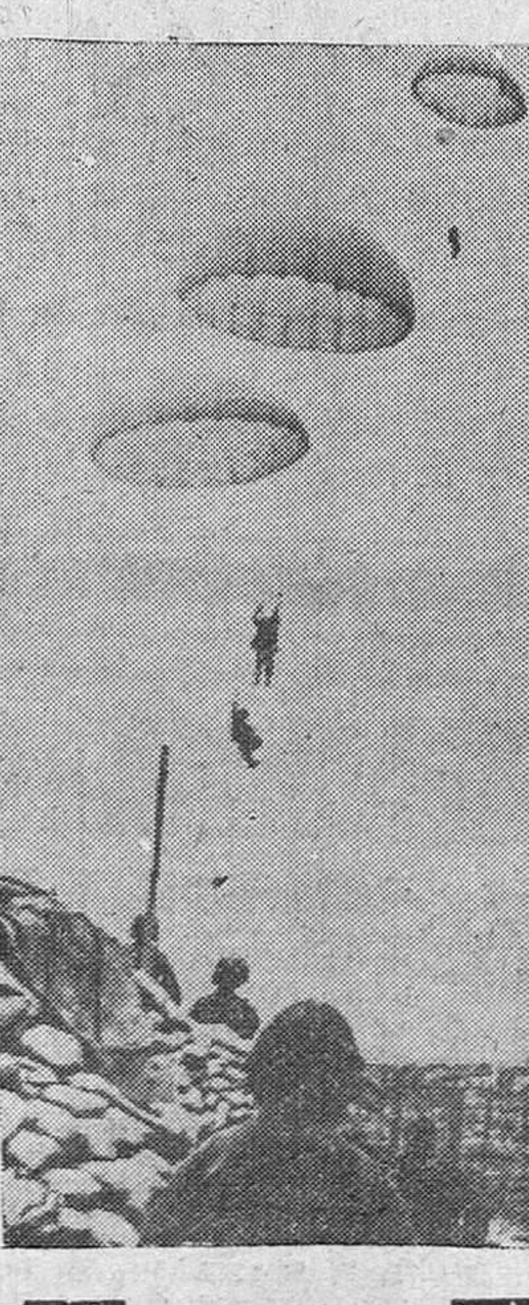
Esta fotografía ha atravesado el cerco comunista en torno al baluarte de Dien Bien Fu y nos ofrece algunos aspectos de la batalla que se libra por defensores y atacantes de aquella zona. He aquí un grupo de soldados, lanzados con paracaídas para reforzar a la guarnición francesa.—(F. Gil del Espinar)

Al llegar al lugar del siniestro el mercante italiano "Podesta" fueron también estos oficiales los últimos en llegar a bordo por no consentir ser salvados antes que ninguno de sus subordinados. Debido al estado del mar fue totalmente imposible salvar más de los que aparecen en la lista publicada en la Prensa de esta mañana quedando muy pocas esperanzas de poder rescatar más naufragos de los que faltan de la dotación del buque, en número aproximado de treinta. No obstante, continúan patrullando por aquellas aguas varias unidades de la Marina de guerra y de la Aviación, que sólo consiguieron rescatar cuatro cadáveres.—Cifra